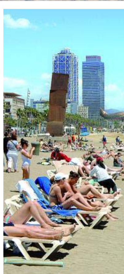
TURISME DE BARCELONA

concentren tots els amants de la vela. Una altra de les més concorregudes és la del Pont d'en Botifarreta, on es troba l'actiu Club Nàutic Bétulo, que organitza tot tipus d'activitats esportives.