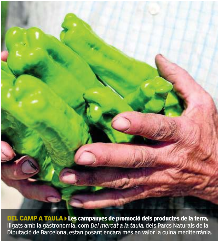
JOSEP CANO / DIPUTACIÓ DE BARCELONA

Mercat de Vic. Sens dubte, un dels mercats més populars de Catalunya. La Plaça Major acull cada dimarts i dissabte des del segle IX un munt de parades amb flors, artesanía, aviram, així com roba i com-