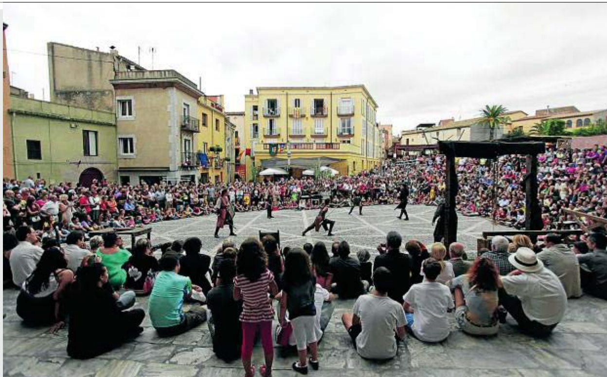
AJUNTAMENT DE CASTELLÓ D'EMPÚRIES

Preu: La majoria de les activitats són gratuïtes.