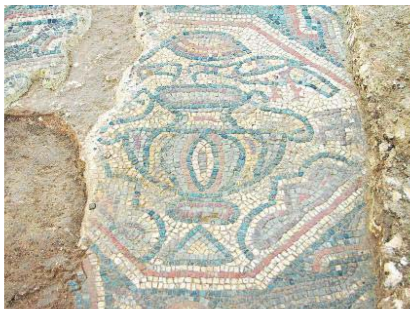
DANIEL ALCUBIERRE / CODEX SCSL / ARQUEOLOGIA ICUB

La ciutat evoluciona cada any amb nous projectes i, sovint, els treballs que s'hi fan fan aflorar noves restes del seu passat romà. Les obres de construcció dels accessos a la nova estació de la Sagrera van deixar al descobert una antiga vil·la romana i la reforma del Mercat de Sant Antoni també va fer sortir a la llum restes de Bàrcino.