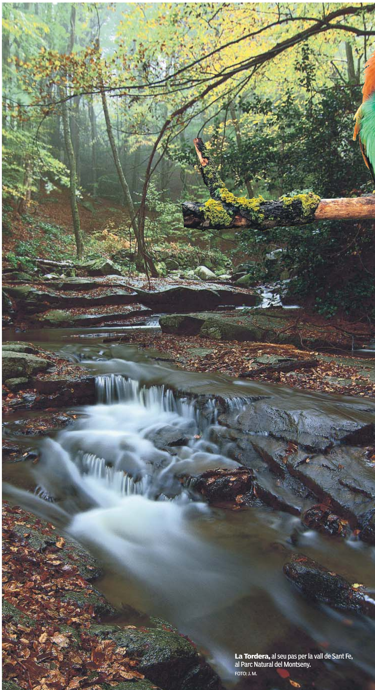
La Tordera, al seu pas per la vall de Sant Fe, al Parc Natural del Montseny.