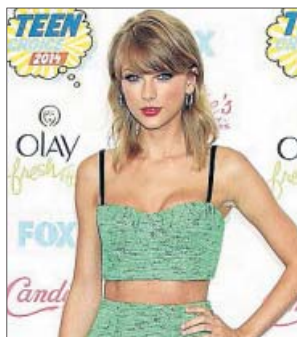
La cantante Taylor Swift en una imagen de archivo.

Además, según la cantante, su opinión se extiende por los círculos artísticos que frecuenta, aunque muchos «tie-