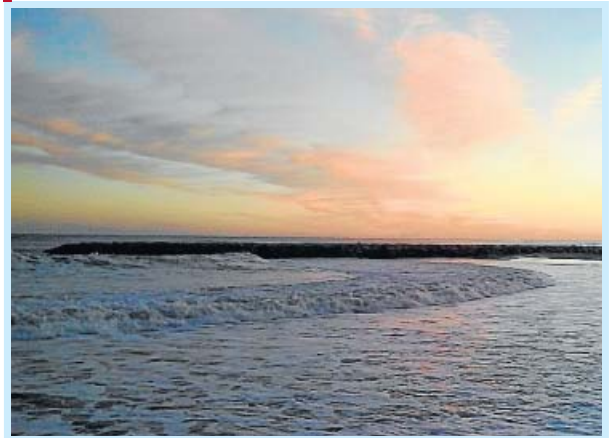
«Un precioso y tranquilo atardecer en la zona de Cubelles, Barcelona», Francisco Avi.

Amaneceres y ocasos. Nuestros lectores nos envían estas bonitas imágenes desde distintos puntos de España con el sol siempre como protagonista.