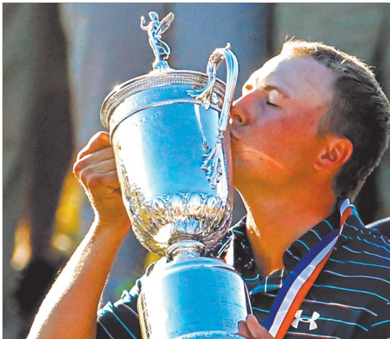
El golfista Jordan Spieth besa el trofeo de campeón del US Open.

Spieth cuenta con una sangre fría y una estrategia –«El golf