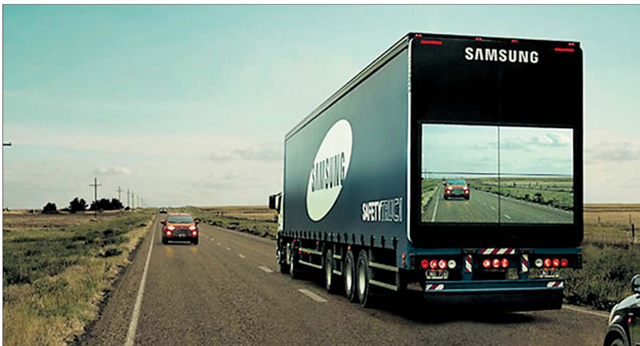
Uno de los camiones con el prototipo Road Safety.

La escasez de combustible está causando el cierre y la suspensión de actividades en hospitales de las provincias de Hama e Idleb, en el norte de Siria, denunció ayer Médicos Sin Fronteras.