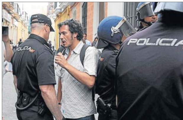
Dos instantes del desalojo. El alcalde, abajo, con la Policía.