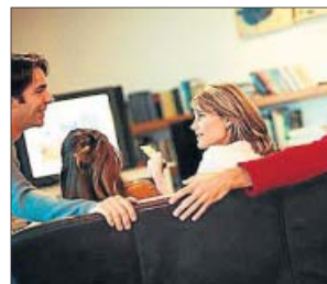
Crece el consumo de VoD.

Movistar TV ▶ Contenidos infantiles, series, películas, Fórmula 1, Moto GP... y un servicio de grabación de hasta 350 horas de almacenamiento.