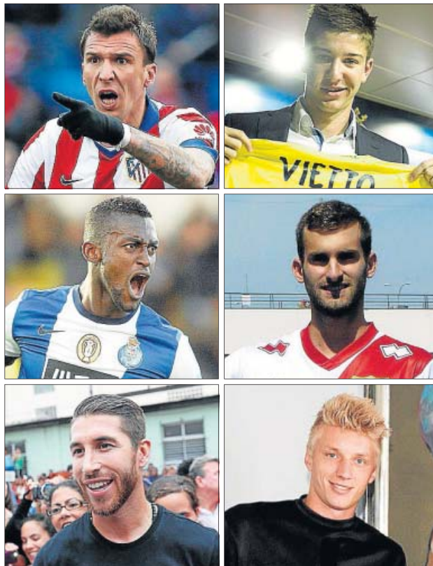
Mandzukic, Vietto, Jackson Martínez, Baptistao, Ramos y Daniel Wass. (de izquierda a derecha y de arriba abajo).

Por su parte, el Villarreal reemplazará la baja de Vietto con Leo Baptistao, que ha jugado esta temporada en el Rayo Vallecano cedido por el Atlético. Fernando Roig, presidente del club castellanense, también confirmó la ven-