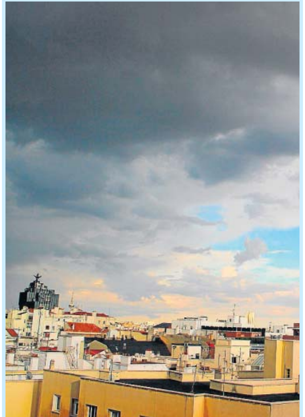
«Los tejados de la capital cubiertos de densas nubes», Jesús Zapatero.