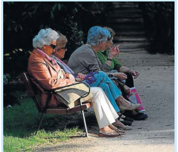
«Fotografía tomada al atardecer en el Parque del Retiro, Madrid», Rafael Muñoz Prieto.

MI MASCOTA Y YO ¿ESTÁS ORGULLOSO DE TU MASCOTA? Hazte una foto con el animal (él solo no vale), cuéntanos en 9 líneas qué dice de ti y tú de él, y envíanosla a zona20@20minutos.es o desde tu PC al subidor de 20minutos.es