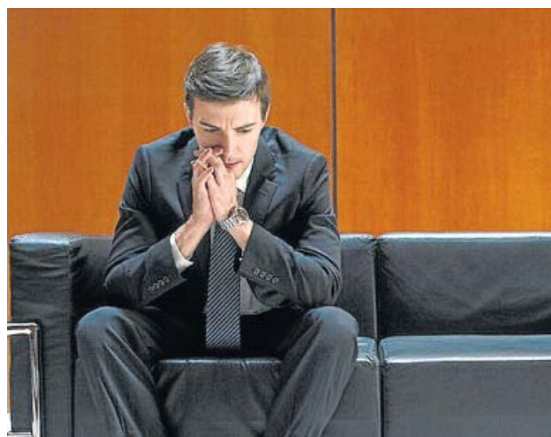
El 37% de los desempleados de todo el mundo son jóvenes.

«El coste de la inacción es muy alto, económica y socialmente», subrayó, para insistir en la pérdida de motivación y competencias pa-