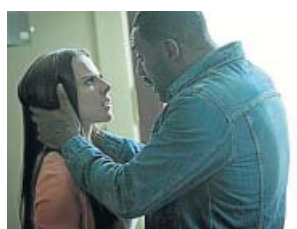
'Sin escrúpulos' NOVA. 22.40 H

En Barcelona, una de las ciudades portuarias de Europa más apreciadas por el tráfico de drogas y la prostitución, Gumer, una chica de 25 años, sale de la cárcel con la idea de formar junto a unas amigas una banda y montar negocios por su cuenta.