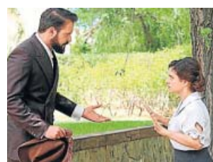
El secreto de Puente Viejo ANTENA 3. 17.30 H

La serie continúa con un Manuel Márquez desorientado; no acepta su nueva situación ni entiende las apariciones y consejos del 'enlace'. Además, el policía vive una difícil situación cuando acepta la invitación de Laura, su viuda, a cenar.