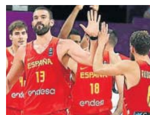
DEPORTES Eurobasket 2017 CUATRO. 20.30 H

Pedro García Aguado mostrará trucos y consejos para afrontar los gastos básicos de la casa y ahorrar, y nos ayudará a administrar mejor nuestro dinero para que no nos cueste llegar a fin de mes.