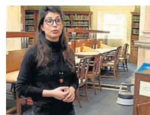
REPORTAJES Españoles en el mundo LA 1. 00.00 H

España - Eslovenia. Son las dos únicas selecciones que han ganado todos los partidos del campeonato y se verán las caras en semifinales. España busca su cuarto título, pero antes tendrá que ganar a Eslovenia.