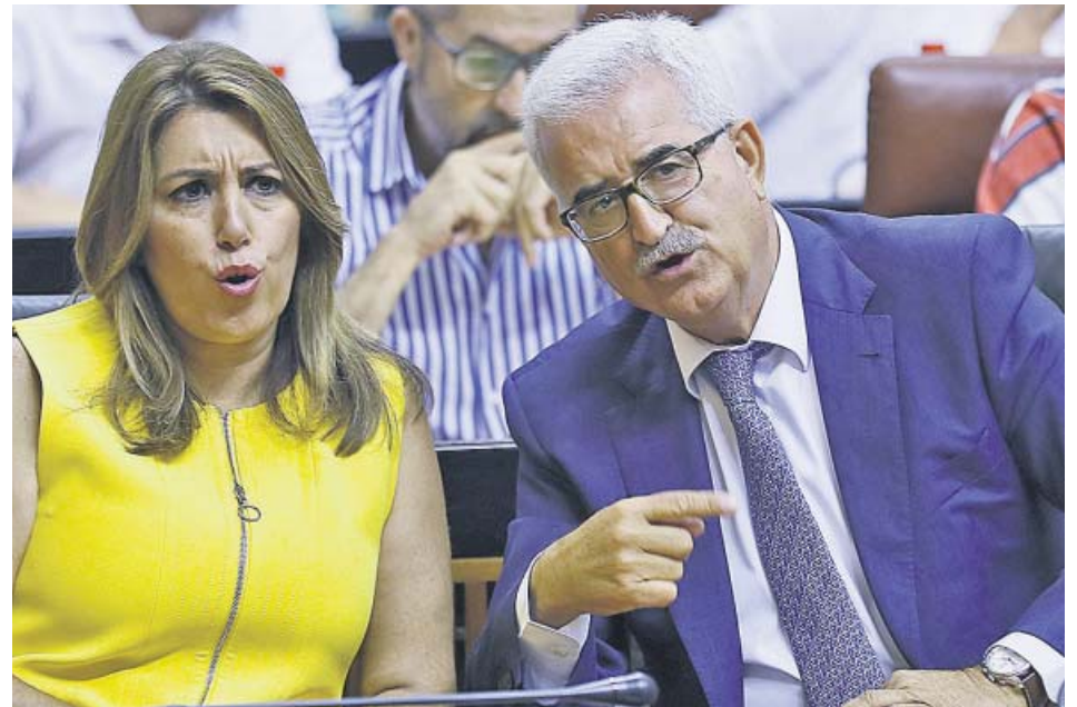
Susana Díaz y el vicepresidente de la Junta, Manuel Jiménez Barrios, en el Parlamento.