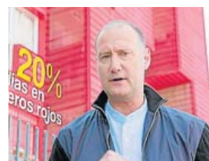
HOGAR Eso que te ahorras ANTENA 3. 22.40 H

Pedro García Aguado mostrará trucos y consejos para afrontar los gastos básicos de la casa y ahorrar, y nos ayudará a administrar mejor nuestro dinero para que no nos cueste llegar a fin de mes.