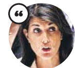
NIKKI HALEY Embajadora permanente de EE UU ante la ONU

«¿Quién entre nosotros aceptaría este tipo de actividad en su frontera? Ningún país actuaría con más contención que Israel»