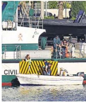
Agentes inspeccionan la barca en la que murió el pequeño.

A pesar de que el ministro del Interior, Juan Ignacio Zoido, aseguró que no se trataba de una narcolancha puesto que en el momento de la colisión iba sin carga, la embarcación había sido requisada el 26 de abril por la Guardia Civil puesto que era utilizada para cargar combustibles a narcolanchas. ● R.A.