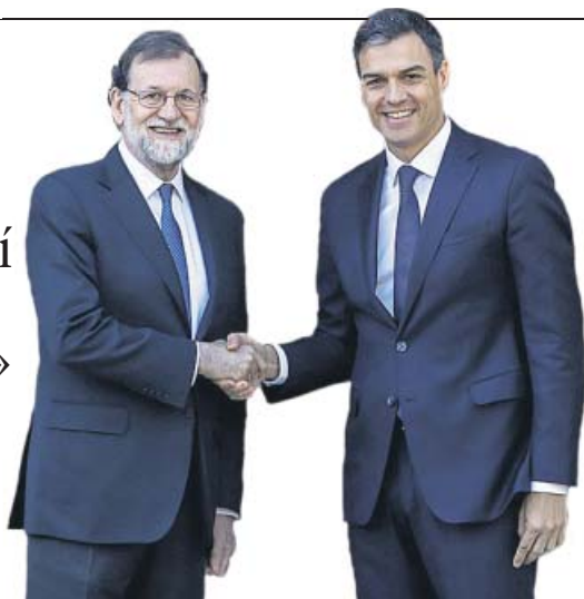
MARIANO RAJOY Presidente del Gobierno

«Se trata de defender la unidad y la soberanía. Aquí nadie toma una decisión unilateral»