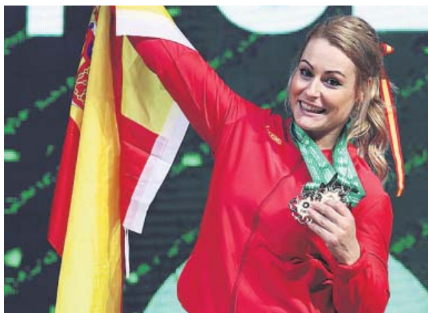
Lydia Valentín con sus medallas mundiales.

Valentín tuvo que subir de peso por unas molestias en los hombros que tiene desde hace dos semanas. «He estado 15 días bastante dolorida, pero quería competir y verme en esas situaciones», dijo. ● R. D.