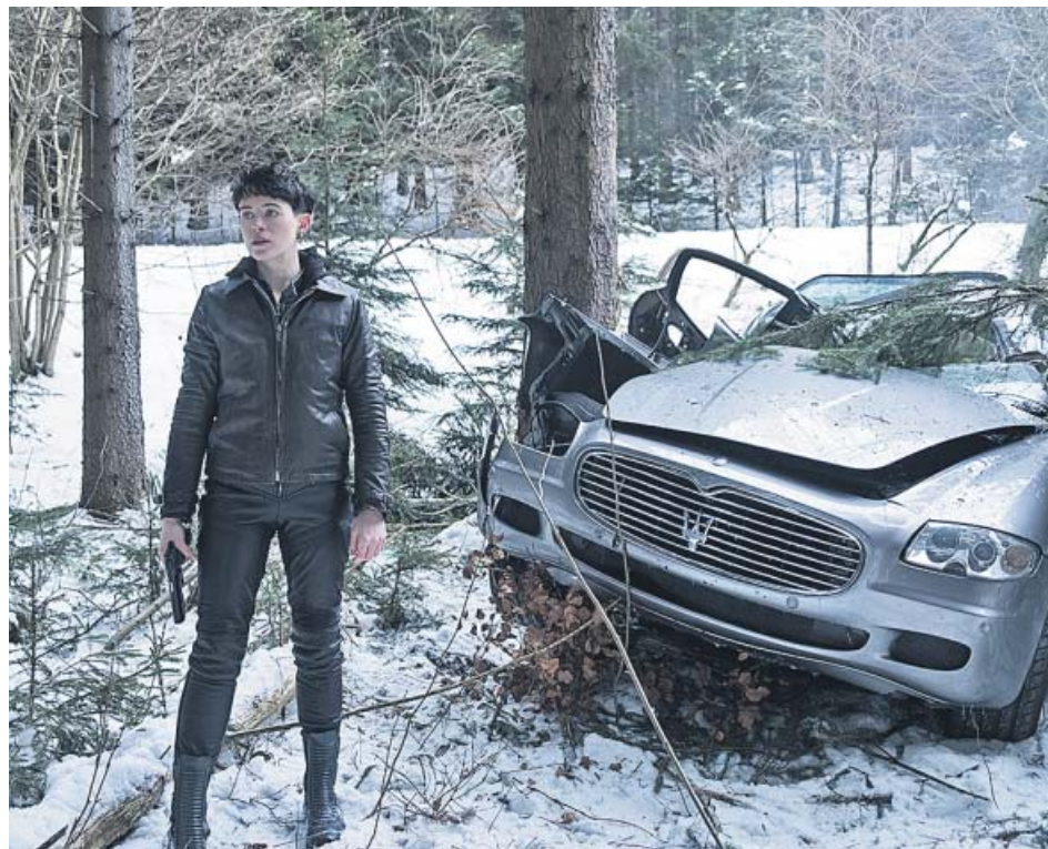
La actriz Claire Foy pasa de ser Elizabeth ( The Crown) a Lisbeth Salander.

Primero, porque quería hacer una película a escala más grande, y segundo, por la propia Lisbeth Salander, la antiheroína de los libros. Su Mi-