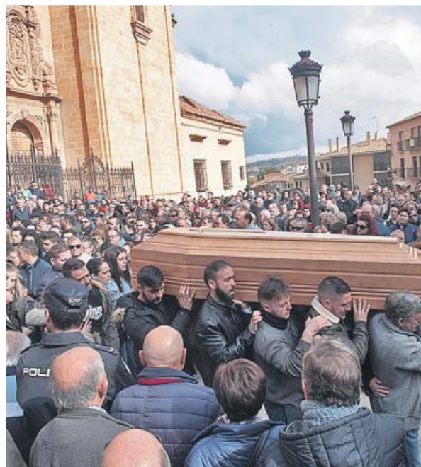
Funeral por las víctimas de la pirotecnia, en Guadix.