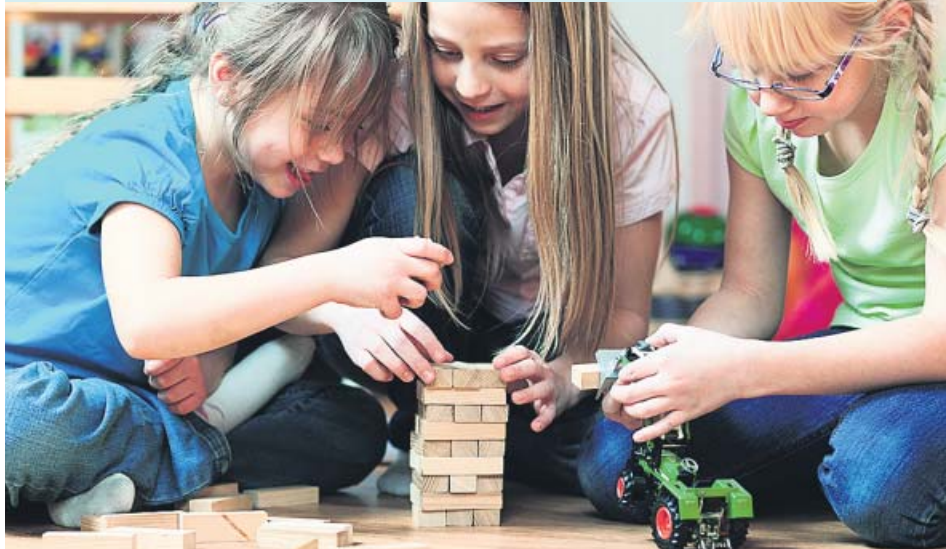
Los niños dejan de pedir juguetes a partir de los ocho años, las niñas tardan algo más.

Los niños piden ahora sus juguetes de Navidad influidos por las modas de internet y los fabricantes temen una mala temporada