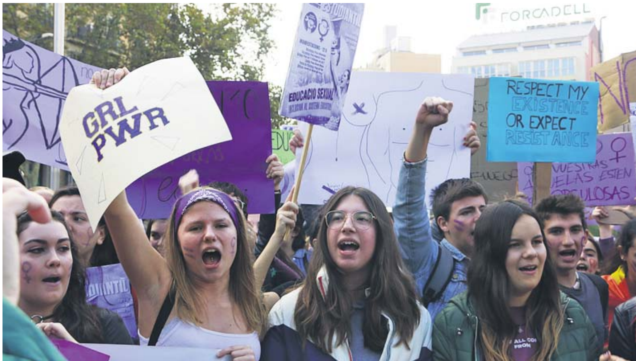
Estudiantes durante la manifestación contra el sexismo en la Plaça Universitat de Barcelona.

Cuatro policías nacionales investigados por la carga del 1-O, entre ellos un inspector jefe, insistieron ayer en defender la actuación policial el día del referéndum de Cataluña. Los agentes se escudaron en que los golpes a los concentrados eran «técnicas policiales» para defenderse. Sobre un golpe en la cara a una mujer dijeron que buscaban dejarla «atolondrada», para que no dificultara a los antidisturbios.