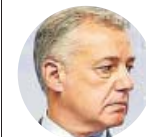
ÍÑIGO URKULLU Lehendakari del País Vasco, tras reunirse con Torra

«Es necesario aprovechar la actual mayoría en el Congreso para propiciar un cauce de solución política a la situación»