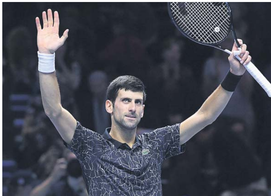
Novak Djokovic celebra su victoria ante Alexander Zverev en el O2 Arena.

El club galo puede quedar fuera de la Champions de confirmarse las irregularidades en unos contratos de patrocinio con entidades de Catar anteriores a 2015, según L'Equipe .