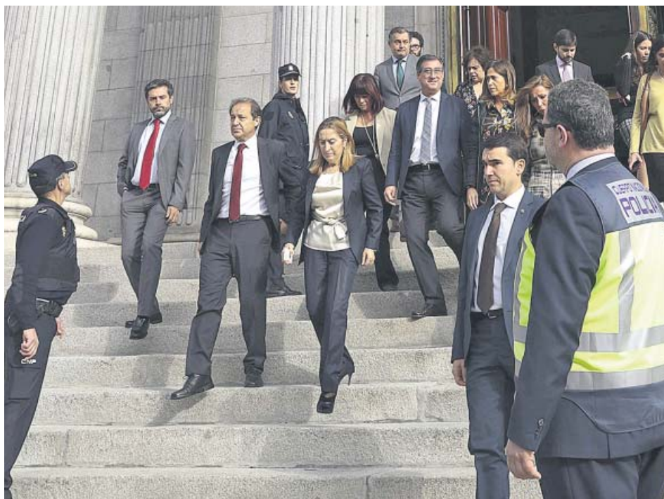
Algunos diputados y diputadas, entre ellos Ana Pastor (c), salen del Congreso.

El Congreso tuvo que interrumpir ayer la sesión plenaria por un simulacro de emergencia que se resolvió exitosamente y de forma ordenada con el desalojo del Palacio de las Cortes y los edificios parlamentarios en siete minutos. A las 10.45 horas sonaron las alarmas de los dispositivos de emergencia de la Cámara Baja, cuya presidenta, Ana Pastor, pidió a los diputados que abandonaran el edificio. Unas 1.800 personas permanecieron fuera unos 15 minutos. ●