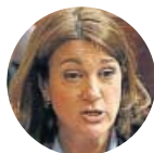
Soraya Rodríguez Exportavoz en el Congreso, criticó la propuesta del relator para Cataluña