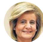
Fátima Báñez Exministra de Empleo, habría sido secretaria general del partido con Santamaría