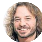
Miguel Vila Exdiputado, vinculado a la corriente de Íñigo Errejón frente a la de Iglesias