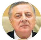
José Blanco Exsecretario de Organización y padrino político de Sánchez, apoyó a Díaz