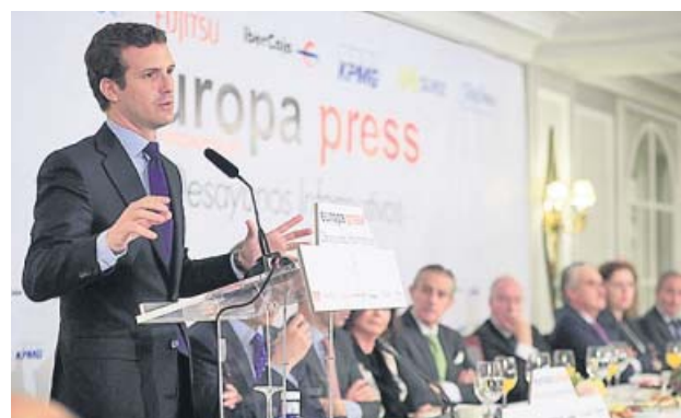
Pablo Casado, ayer, durante un desayuno informativo.

Estas declaraciones hacen referencia a las que vertió un día antes el presidente del Gobierno. En concreto, denunció que el PP cuestione el sistema del Pacto de Toledo y se refirió a una entrevista en la que