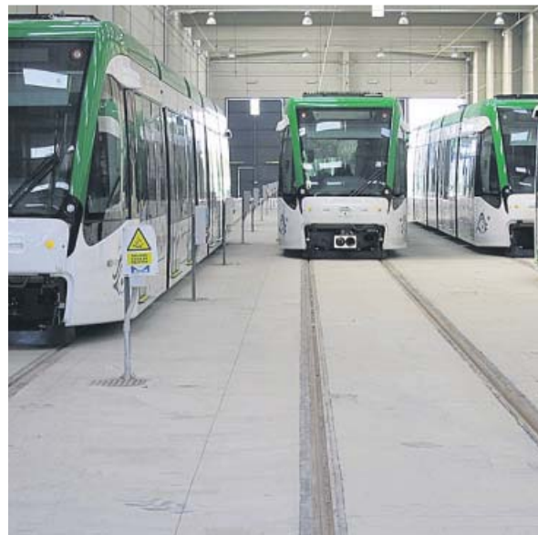
Cocheras del metro de Málaga.

La intervención se iniciará por el tramo Renfe-Guadalmedina y se extenderá cuando los trabajos lo permitan hacia la Alameda Principal y el paso bajo el río Guadalmedina. El