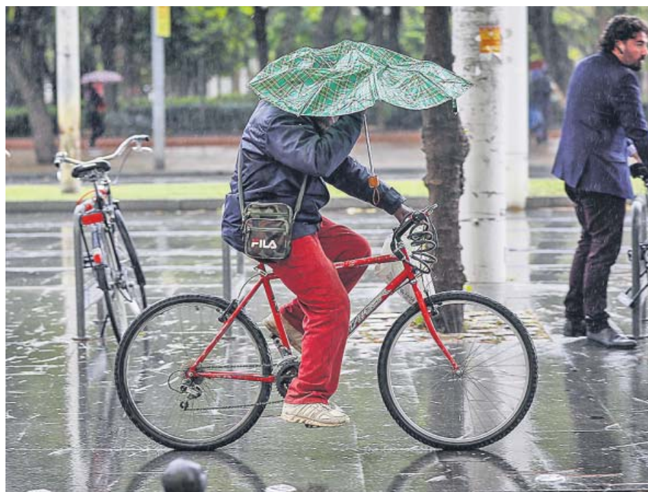
Un ciclista intenta resguardarse de la lluvia, ayer en Sevilla.

Tras las lluvias registradas ayer en buena parte de la comunidad, la inestabilidad persistirá durante los próximos días en Andalucía, donde a partir de mañana habrá una bajada importante de las temperaturas. El fin de semana, llegará una borrasca que dejará lluvias intensas, según la Agencia Estatal de Meteorología (Aemet). En Granada, por ejemplo, las máximas serán de 20 o 21 grados y las mínimas pasarán de 7 grados centígrados el miércoles a 3 el viernes. ● R. A.