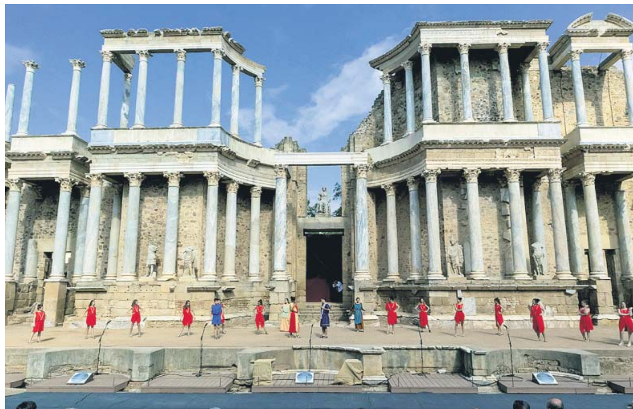
Un grupo de estudiantes actuaron, ayer, en la inauguración del Festival Juvenil de Teatro Grecolatino, en Mérida.

FRANK CUESTA Herpetólogo y activista contra el tráfico de animales