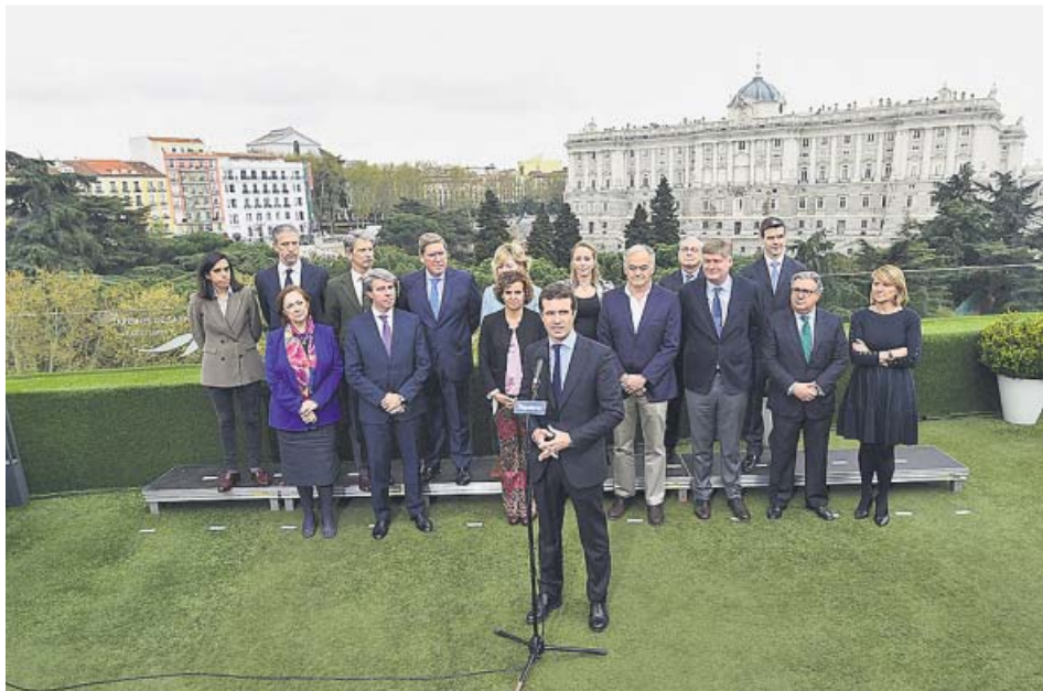
Pablo Casado durante la presentación de la lista del PP a las elecciones europeas.

CANDIDATA La portavoz en el Congreso irá acompañada por Garrido, Pons, Istúriz, Zoido o Margallo