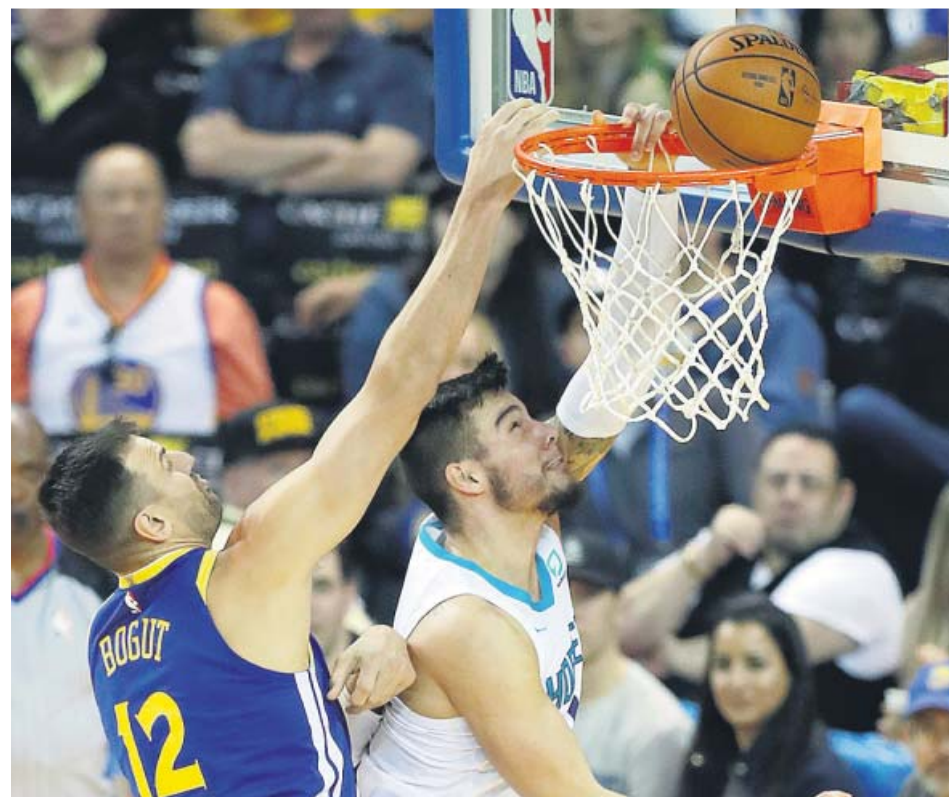
Willy Hernangómez anota ante Andrew Bogut en el Warriors - Hornets.

Esta semana, varios duelos directos apuntan a clave en la lucha por la salvación. Además de los citados Huesca-Celta y Levante-Huesca, el Leganés recibe el jueves al Valladolid, el sábado se juega un derbi catalán entre Espanyol y Girona con ambos tratando de poner tierra de por medio, y el domingo hay un Balaidos un Celta-Real Sociedad con los vigueses tratando de seguir con su escalada desde la vuelta de Iago Aspas y los donostiarres queriendo alejar posibles fantasmas. ●