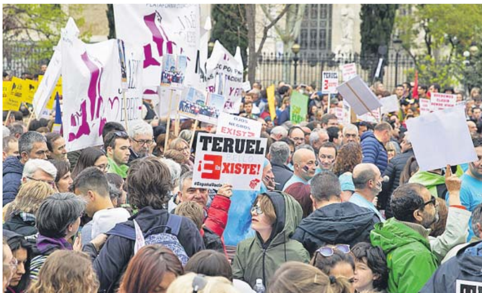
Un momento de la manifestación de la «España vaciada» celebrada en Madrid. ELENA BUENAVISTA

Mejorar el acceso a servicios básicos; políticas de empleo, sobre todo para jóvenes y mujeres, o modernizar las comunicaciones, entre las medidas más urgentes