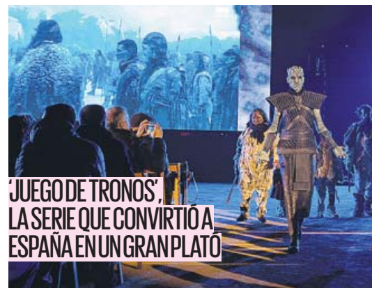
'JUEGO DE TRONOS', LA SERIE QUE CONVIRTIÓ A ESPAÑA EN UN GRAN PLATO

A menos de dos semanas para el inicio de su última temporada, localidades españolas escenario de la serie, como Osuna (Sevilla), recrean alguna de sus escenas más inolvidables. PÁGINA 14