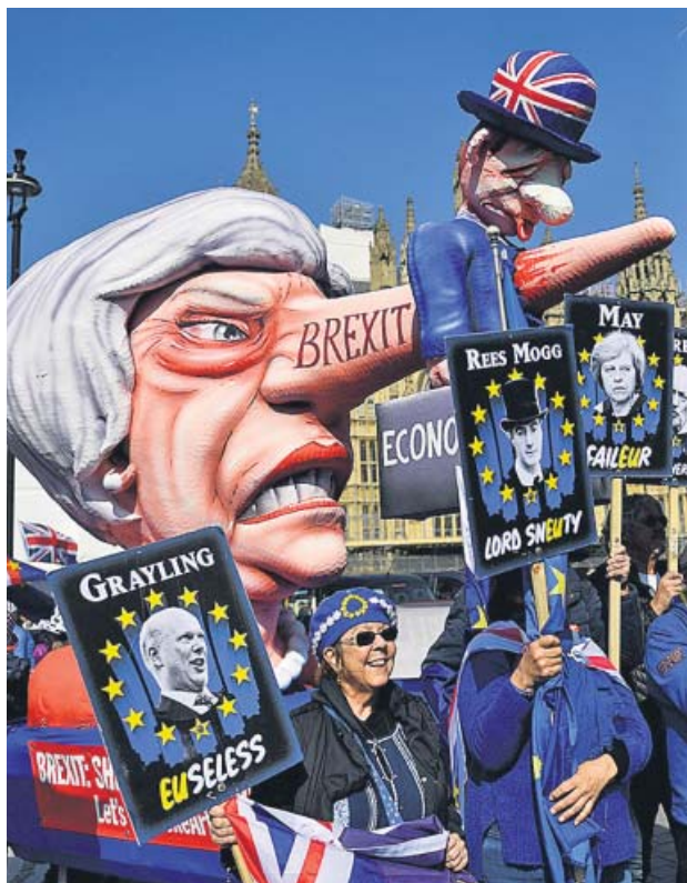
Manifestantes proeuropeos caricaturizan a May.