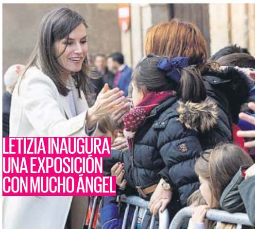
LETIZIA INAUGURA UNA EXPOSICIÓN CON MUCHO ÁNGEL

La reina acudió ayer a Lerma (Burgos) con motivo de la exposición Angeli , organizada por la Fundación Las Edades del Hombre y que persigue difundir el arte sacro en Castilla y León. PÁGINA 20