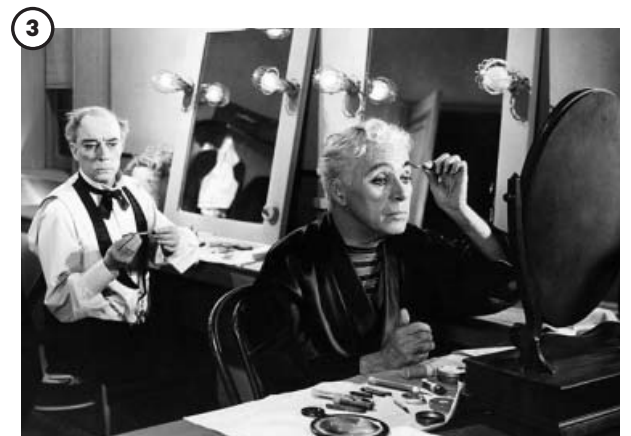
3 'Candilejas' (1952)

En esta crítica al capitalismo usó efectos de sonido y se pudo escuchar por primera vez su voz cantando. En la escena más famosa le engullen los engranajes de una cadena de montaje.