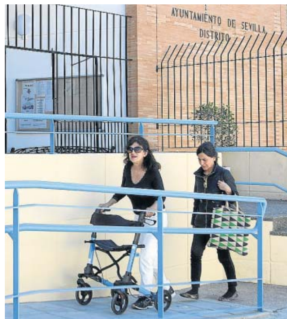
Rampa adaptada en la sede del Distrito San Pablo.

Fuera de la sede del Distrito San Pablo-Santa Justa, en la calle Jerusalén, se ha acometido la reforma de los accesos, incluido el porche, eliminando los desniveles que dificultaban el tránsito de las personas con movilidad reducida. Así, se ha generado un único nivel, instalado una estructura fija de sombra y plantado árboles de sombra, al tiempo que se han redistribuido los apar-