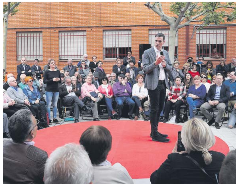
Sánchez prometió ayer blindar las pensiones en la Constitución en un acto con mayores en Leganés.

Sigue en nuestra web la información de todos los actos de campaña de los diferentes partidos políticos