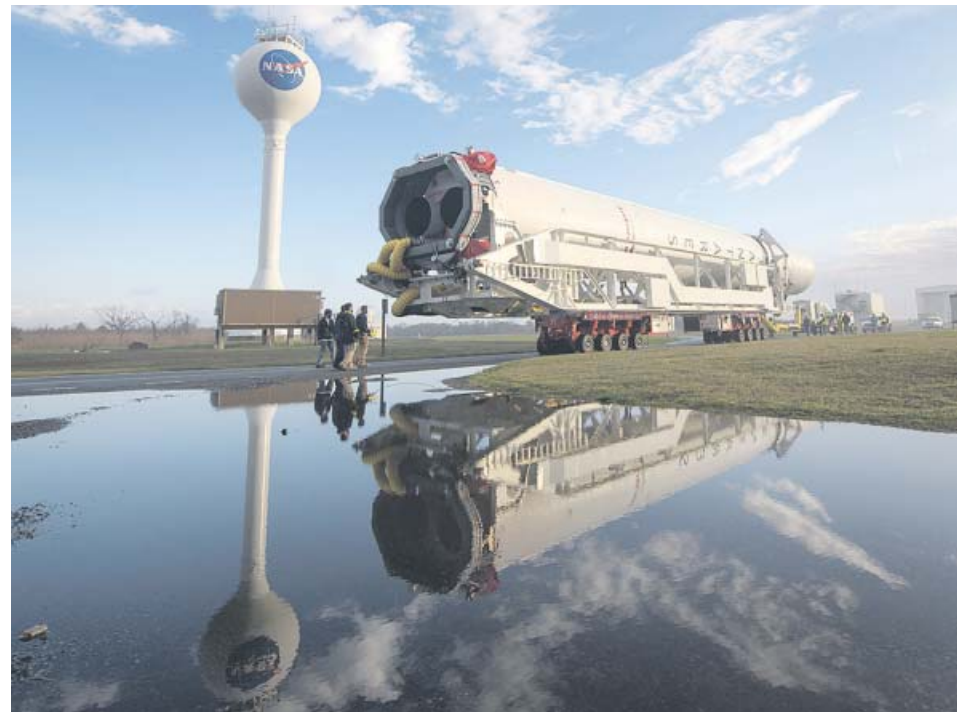
El cohete Northrop Grumman Antares mientras es desplegado.