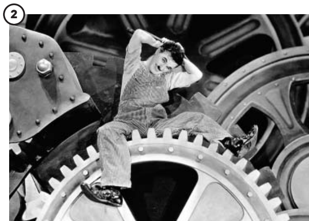
2 'Tiempos modernos' (1936)

El primer largometraje completamente hablado de Chaplin fue esta sátira del fascismo. Él mismo interpretó a un barbero judío que es confundido con un líder de un parecido, nada casual, con Hitler. Memorable aún es su discurso final. Tuvo numerosos problemas con la censura. En España no se estrenaría en cines hasta más de tres décadas después, en 1976.