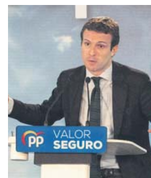
Pablo Casado, en un mitin ayer en Ciudad Real.

Ante un público formado principalmente por personas mayores, Casado anunció que si