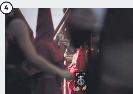
Estación del Buen Suceso de Córdoba Nazarenos de la hermandad del Buen Suceso durante su estación de penitencia ayer por las calles de Córdoba, ciudad que ayer visitó el presidente andaluz, Juanma Moreno.

artístico sacro. En cualquier caso, Bendodo afirmó ayer que, además de su «carácter religioso», la Semana Santa andaluza es «sobre todo, una manifestación cultural y un motor económico por su contribución al turismo», tal y como «se está comprobando estos días». Y remarcó que la Junta atiende «por primera