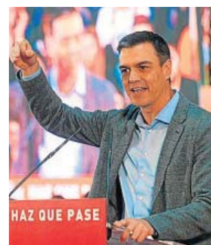
Pedro Sánchez, ayer, en un mitin en Vigo.