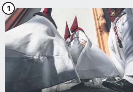
Momentos previos en el Cerro Nazarenos de la hermandad del Cerro del Águila, que ayer protagonizó uno de los estrenos de la Semana Santa —el paso del Nazareno del Cerro—, camino de su parroquia.