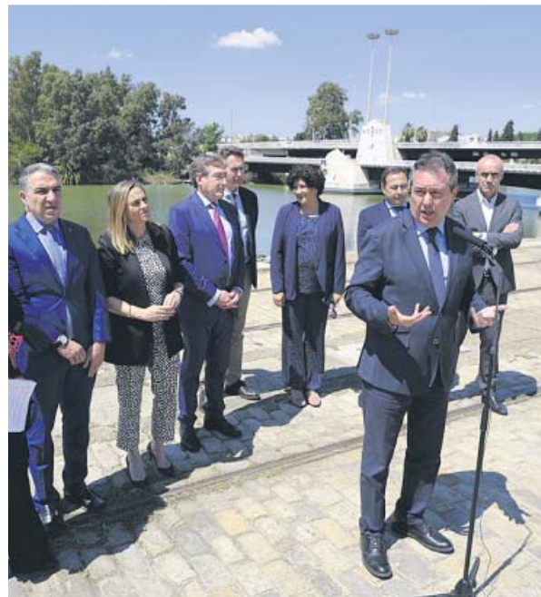
Juan Espadas, ayer en el Puerto de Sevilla.