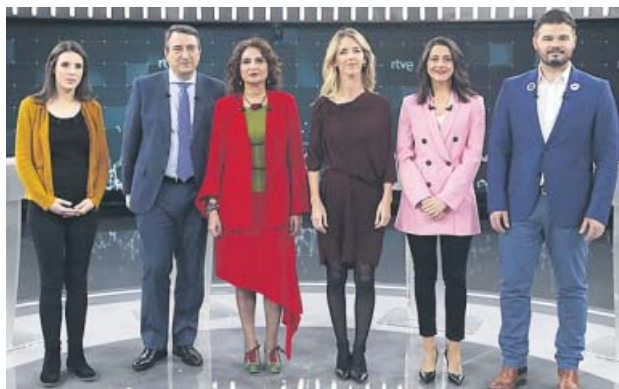
Irene Montero, Aitor Esteban, María Jesús Montero, Cayetana Álvarez de Toledo, Inés Arrimadas y Gabriel Rufián.

Aunque para encontraronzo el que Álvarez de Toledo tuvo con el número dos de ERC por Barcelona, Gabriel Rufián, quien declaró que le pareció «gravísimo» lo que la popular dijo en materia de igualdad sobre el «consentimiento afirmativo» y le pidió que lo revisara. Las mismas palabras de Álvarez de To-