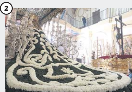
Una tradición que cumple 75 años El manto de la Virgen de las Penas, de Málaga, confeccionado por los jardineros municipales a lo largo de cinco días desde hace 75 años, recuerda este año el que lució la talla en 1944.