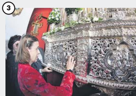
Una forma diferente de disfrutar los pasos Personas invidentes se han acercado a la Semana Santa de Granada gracias a los talleres sensoriales puestos en marcha por el Ayuntamiento. En la imagen, la hermandad del Vía Crucis.