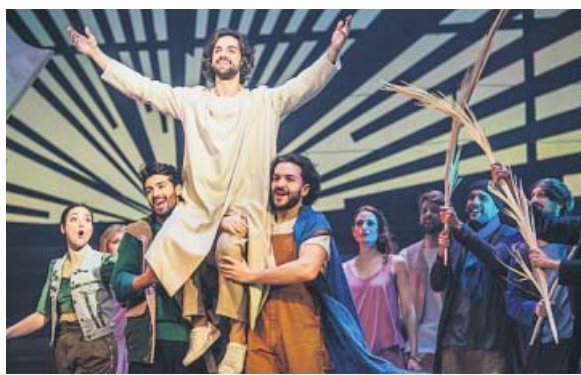
33 EL MUSICAL

Bajo la dirección del sacerdote Toño Casado, este musical 100% español narra la vida del Mesías de la mano de 28 actores que interpretan a 33 personajes. El show se estrenó el 22 de noviembre y se ha prorrogado hasta tres veces en Ifema (Madrid). La última fecha está prevista para el 12 de mayo y, a priori , no habrá ampliación. La producción ha contado con un presupuesto de 4,5 millones de euros.