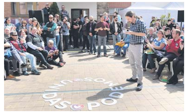
Iglesias recaló ayer en la localidad riojana de Nalda.

bernando. Nos han tomado el pelo porque no estábamos en el Gobierno», indicó. «Firman un acuerdo contigo, te dan la razón en muchas cosas y, una vez que tienen tus votos en el Parlamento, no cumplen», reprochó. ●