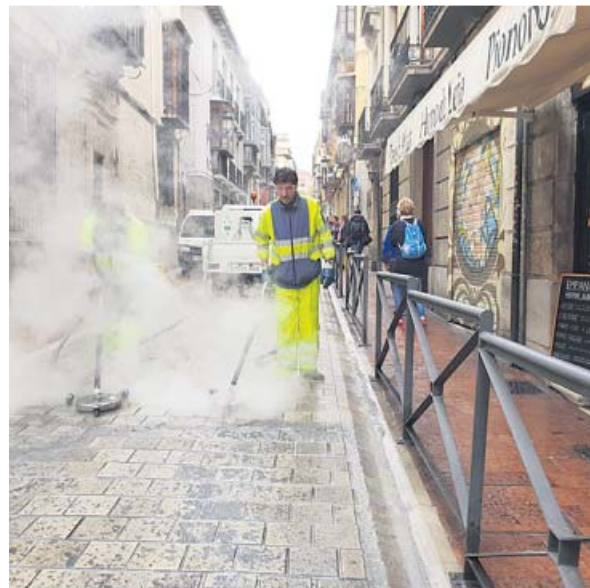
Operarios limpian la cera en una calle de la ciudad.