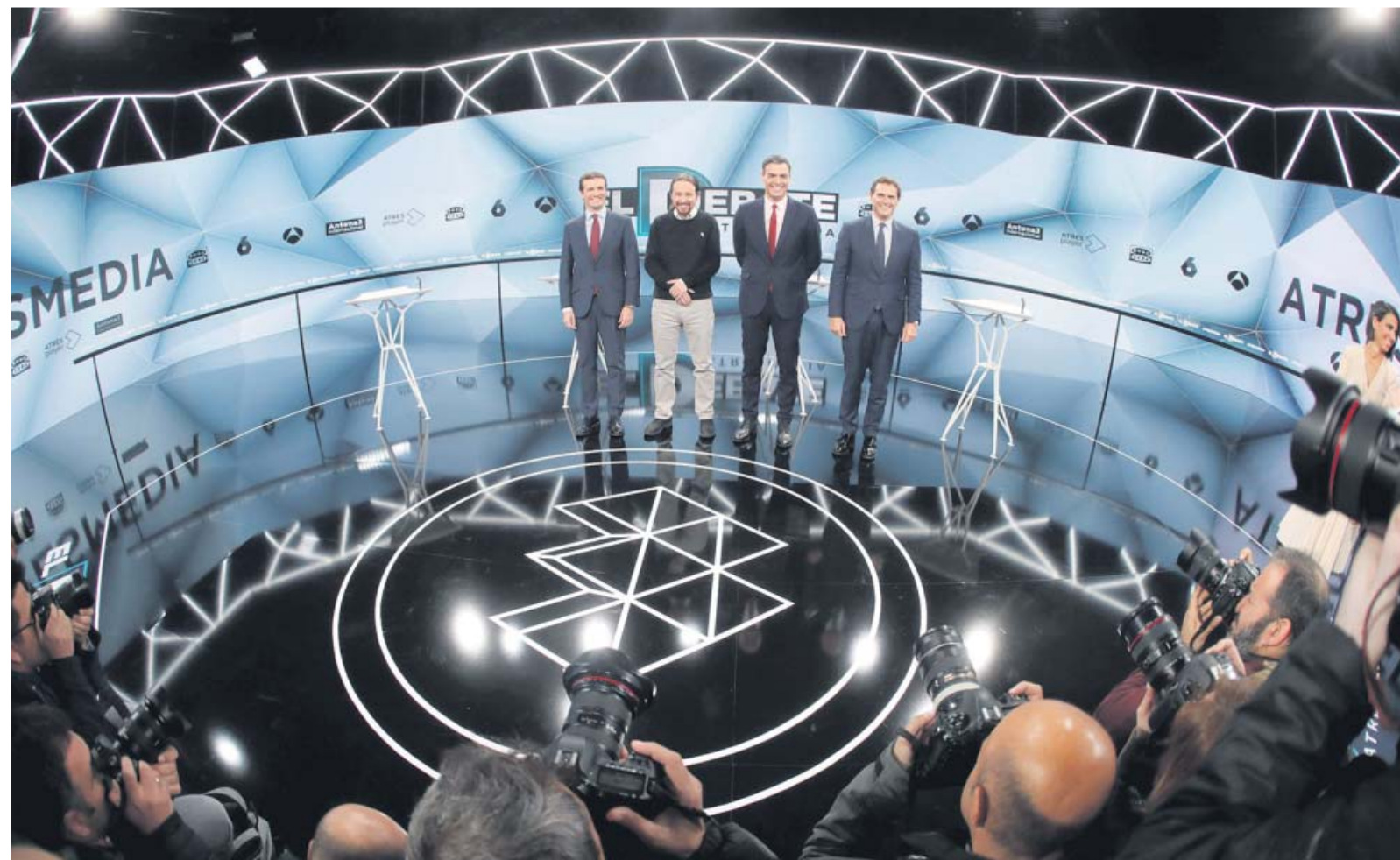
Casado, Iglesias, Sánchez y Rivera, anoche, posan al inicio del debate en el plató de Atresmedia.

En materia fiscal, el líder del PP insistió en su plan de relax fiscal, que cifró en 700 euros al año por contribuyente. «El debate no es bajar los impuestos, sino a quién», replicó Sánchez, que se comprometió a perseguir el fraude. Iglesias apostilló que él elevaría la presión sobre la