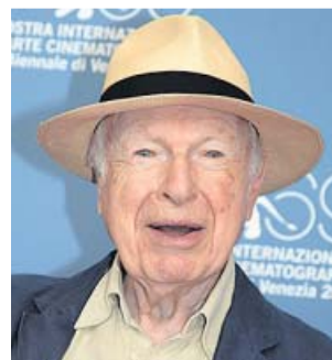
El dramaturgo Peter Brook en una imagen de archivo.

A sus 95 años, el dramaturgo continúa trabajando en el terreno artístico en el que se adentró con tan solo 20 años para dejar huella: se le considera uno de los mayores renovadores del teatro contemporáneo y el mejor director de escena del siglo xx. Ni los años ni el paso del tiempo son un impedimento para seguir activo; «mientras pueda ser útil» seguirá creando, porque sin ello la vida «no tiene interés», defiende.