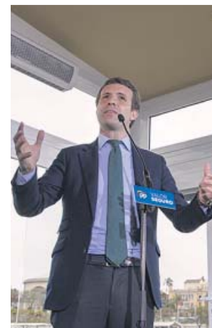
Pablo Casado, ayer, en un mitin en Sevilla.

aventuró a un pronóstico: «En cinco días seré presidente del Gobierno». Además, elevó a su formación como la única capaz de facilitar el «desbloqueo», asumiendo de nuevo como posible un pacto con Ciudadanos y Vox. Definió al Partido Popular como «dos por el precio de uno, alternativa a lo que va mal, solvencia, balance de gestión, buenos equipos, pero al mismo tiempo decir que con su voto no va a haber bloqueo», añadió.