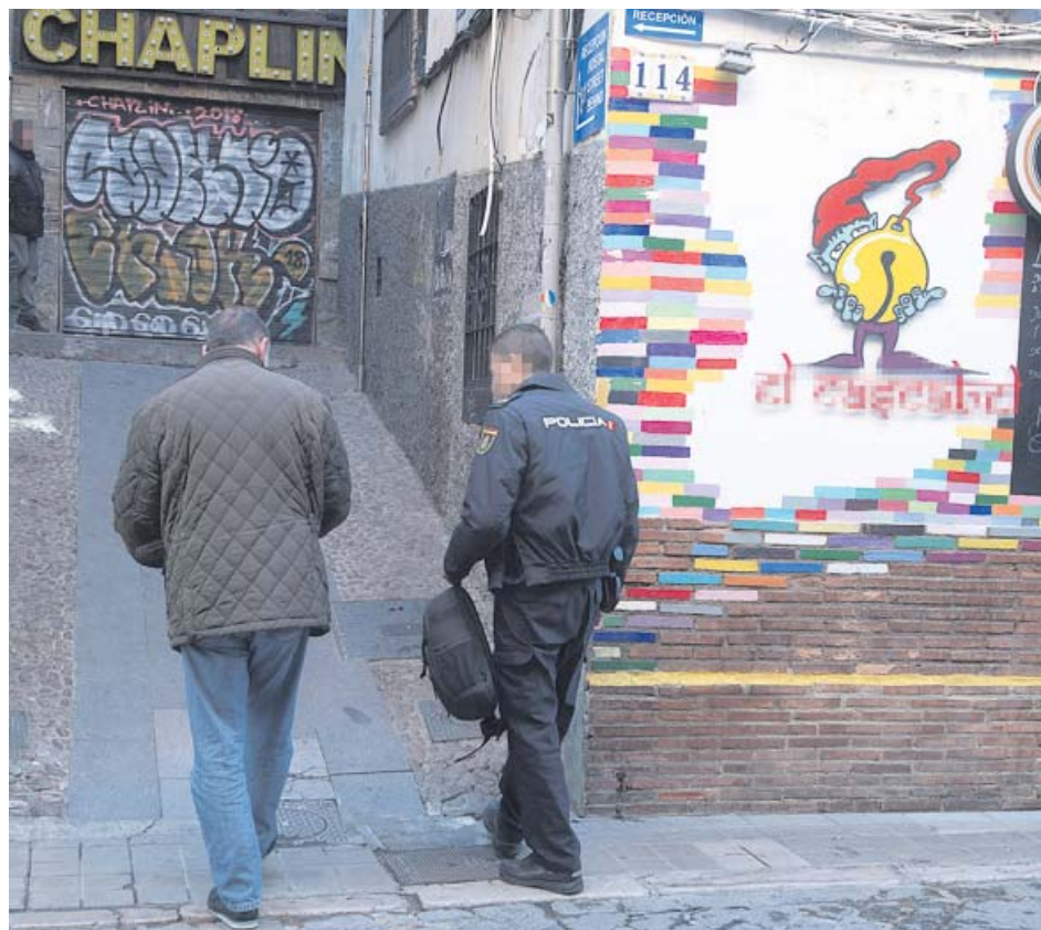
Un agente acude, con otra persona, al lugar donde apuñalaron a la víctima.

Un terremoto de magnitud 3,2 con epicentro en La Mojonera (Almería) fue sentido la madrugada del miércoles sin que se constataran daños materiales ni heridos, según informó ayer el servicio de emergencias 112 Andalucía. El seísmo tuvo lugar a las 6.17 horas, con una réplica 15 minutos después de magnitud 1,9.