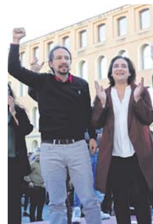
Iglesias y Colau, ayer, en un mitin en Barcelona.

Respaldado, eso sí, por la alcaldesa Ada Colau, Iglesias indicó que el «conflicto» en Cataluña «no se va a solucionar ni con cárceles ni con jueces, sino haciendo política». Así, se dirigió a «la gente del PSC» para evitar que la suma más favorable el 28-A para los socialistas sea con Cs: «Les pido que nos den la oportunidad de garantizar que en el Estado haya un gobierno de izquierdas