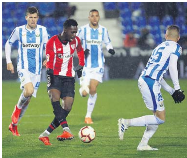
Arriba: jugadores del Atlético celebran uno de los goles ante el Valencia (i) y Coke, del Levante, el marcado por el Betis en propia puerta (d). Abajo: una jugada del partido entre Espanyol y Celta (i) y los jugadores de Leganés rodean a Williams (d).