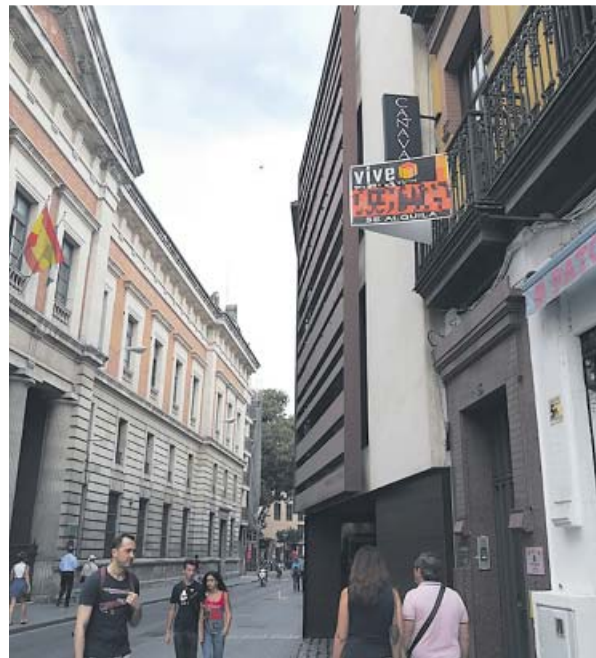
Anuncio de alquiler de una vivienda en Sevilla. B.R.