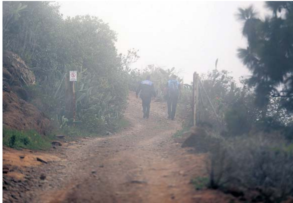
La Policía transita por un camino del paraje durante la búsqueda de la mujer y su hijo.

Los vecinos de La Quinta, cuando encontraron al crío deambulando en ese estado, lo primero que hicieron fue con-