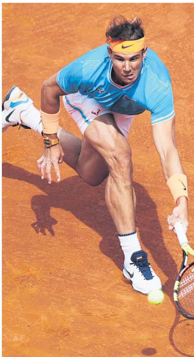
Nadal devuelve una bola durante el partido de ayer.

Pero ni entonces quiso rendirse Mayer, número 63 del mundo y que no sabe a qué sabe ganar a Rafa. El set definitivo comenzó igualado, pero el equilibrio terminó por