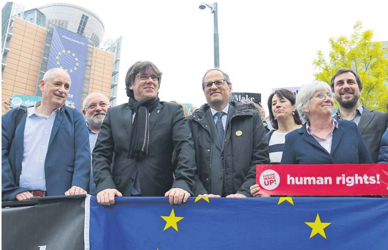
Carles Puigdemont y Quim Torra, ayer en Bruselas.