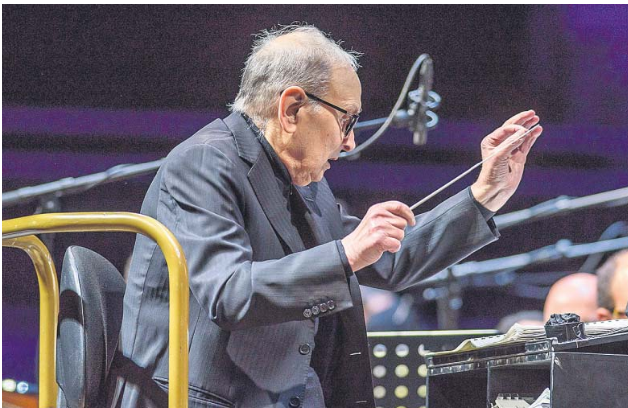
Fotografía del compositor italiano Ennio Morricone en el Bizkaia Arena de BEC, en Barakaldo.

«Uno de los proyectos que nos hace más ilusión es el archivo personal y la biblioteca. Es una fuente de información muy potente y estamos viendo la manera de hacerlo accesible, invitar a otros artistas y estudiosos y potenciar ese objetivo divulgativo, con Chillida Leku como centro del universo de Chillida», añade Massagué. ●