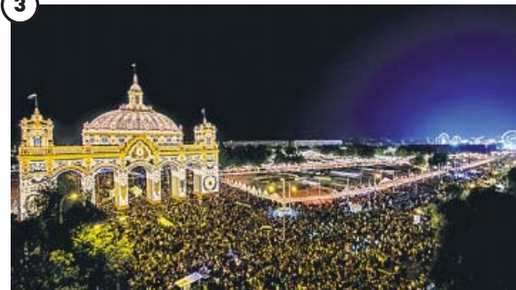
El alumbrado, pistoletazo de salida de la Feria

Una imagen del tradicional alumbrado en el Real de la Feria de Sevilla, una ciudad efímera de más de un millar de casetas que acogerá a miles de sevillanos y visitantes.