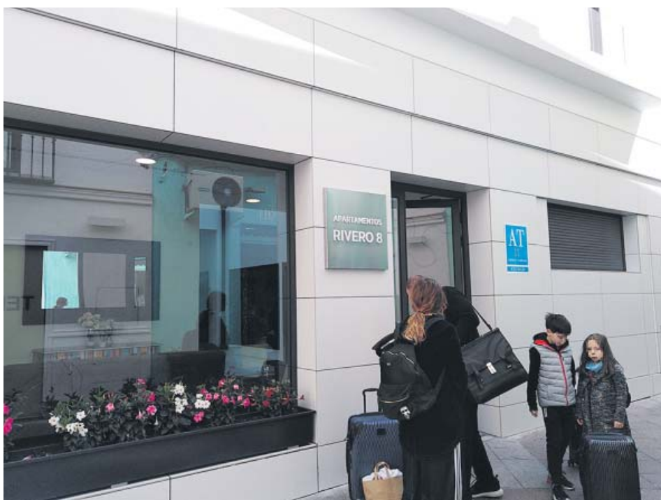
Una familia sale de unos apartamentos turísticos en el centro de Sevilla. B.R.

EL EMPLEO GENERADO fue de 4.600 personas, de las cuales más de 500 eran personal no remunerado