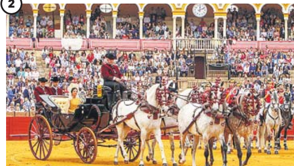
Exhibición de Enganches en la Real Maestranza

Victoria Federica de Marichalar, como madrina de la Exhibición de Enganches que tuvo lugar ayer en la plaza de toros de la Real Maestranza de Sevilla.