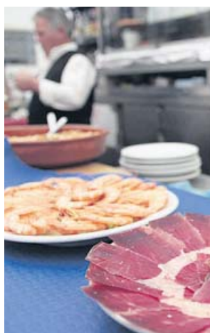
Platos de gambas y jamón en la Feria.

Una imagen del tradicional alumbrado en el Real de la Feria de Sevilla, una ciudad efímera de más de un millar de casetas que acogerá a miles de sevillanos y visitantes.