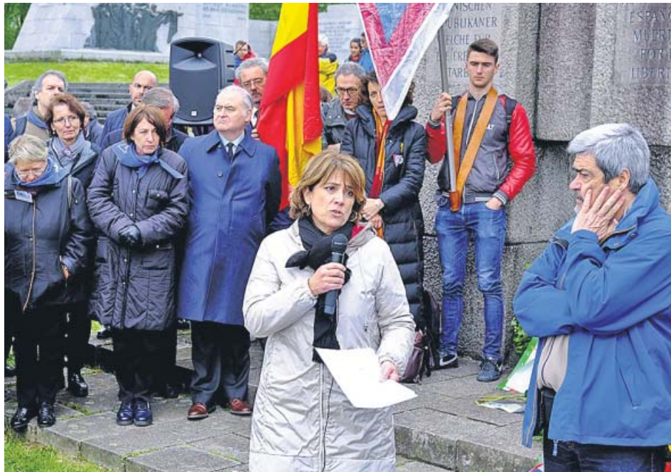
Delgado, ayer, durante un momento de su intervención en el campo de concentración.

La ministra de Justicia en funciones, Dolores Delgado, abandonó ayer un homenaje de la Generalitat a los presos españoles de Mauthausen (Austria) después de que se les comparara con los políticos en prisión preventiva por la consulta del 1-O. Delgado participó en varios homenajes en el antiguo campo de concentración nazi. Tras escuchar las palabras de la representante de la Generalitat, abandonó el lugar. Regresó después para la ofrenda floral. ●