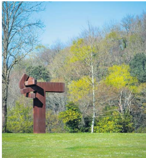
Lotura XXXII (1998, en grande) en el jardín, la fachada del caserío del s. XVI y Chillida y Pili en Grasse (1985). * ZABALAGA LEKU, SAN SEBASTIÁN, VEGAP, 2019. SUCESIÓN CHILLIDA Y HAUSER & WIRTH.

De esta manera, uno de nuestros artistas más universales (Gran Premio Internacional de Escultura en la Bienal de Venecia de 1958, expuso en el Guggenheim de Nueva York o el Martin-Gropius-Bau de Berlín) dejó a su tierra el legado de toda una vida dedicada al arte. En Chillida Leku se encuentra, en la actualidad, el corpus más amplio del artista. Solo en los terrenos que rodean el caserío pueden contemplarse cerca de