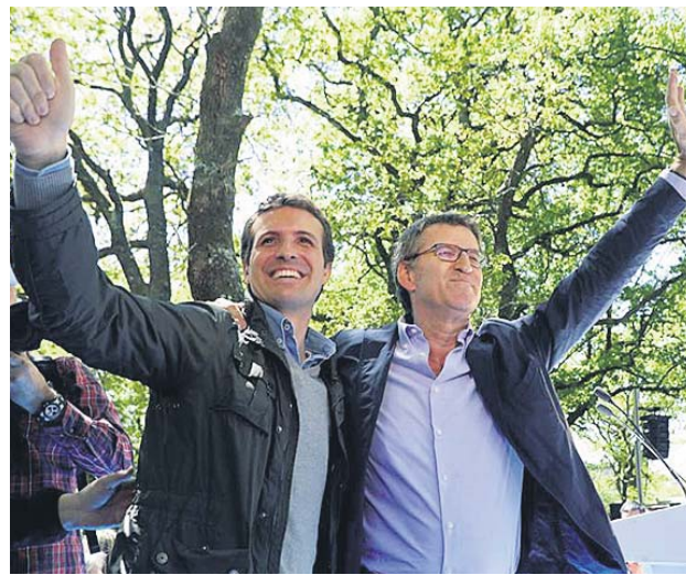
Casado y Feijóo, este sábado en O Pino (A Coruña).

Después irá a la Moncloa, donde tiene previsto informar a Sánchez de que será oposición a su Gobierno y pedirle explicaciones por la subida de impues-