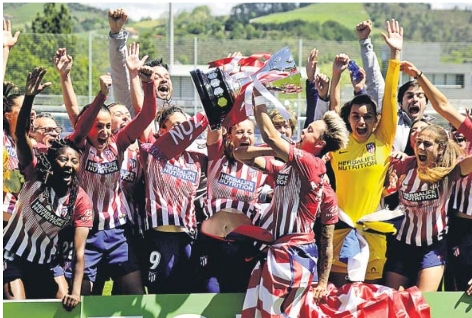
Las jugadoras del Atlético de Madrid celebran su victoria ante la Real y el título de Liga.