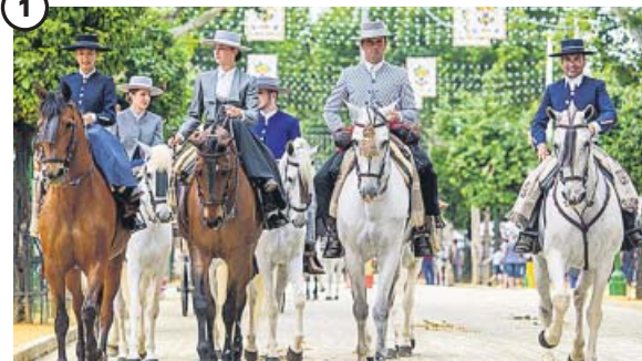
Paseo de caballistas en el Real

Un grupo de seis caballistas con sus trajes tradicionales en el Real de la Feria ayer, primer día de la Feria de Abril de Sevilla, que durará hasta el día 12 de mayo.