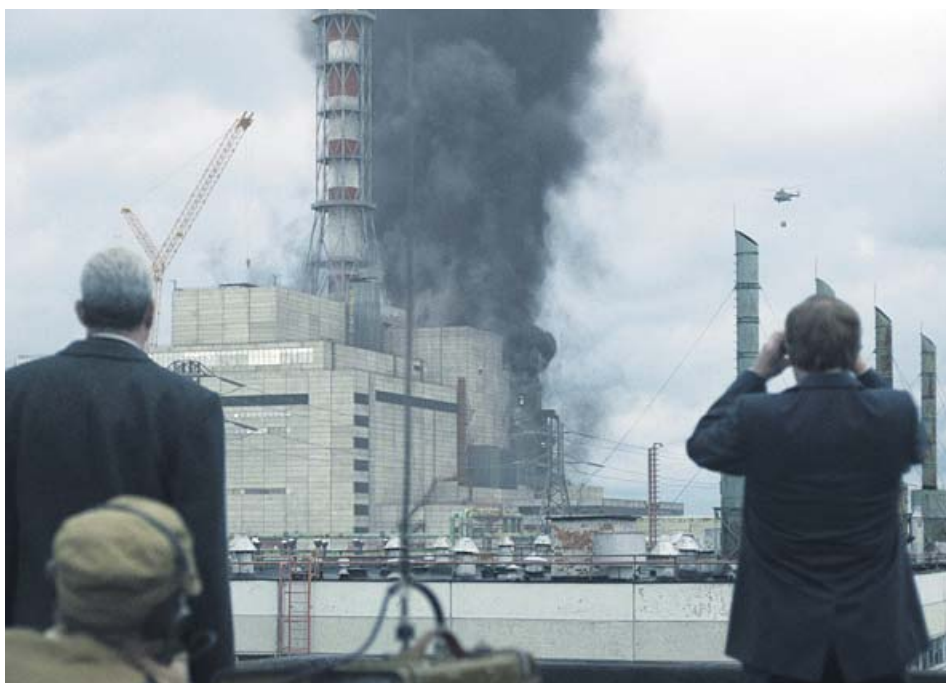
Jared Harris y Emily Watson dan vida a los científicos que contuvieron el desastre.