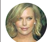
CHARLIZE THERON, Cuando le propusieron ser la madre de Wonder Woman

«Hollywood te da la bofetada cuando empiezas a envejecer. Se trataba de un momento definitivo en mi carrera»