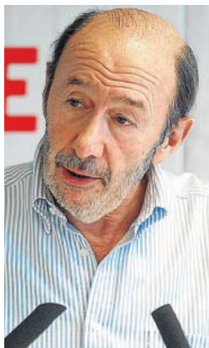
Rubalcaba, en un mitin.

Rubalcaba fue entonces atendido por un equipo médico que se desplazó hasta el lugar y determinó su traslado al centro, donde ingresó alrededor de las 19.00 horas. Al cierre de esta edición (23.00 horas), Pérez Rubalcaba permanecía hospitalizado aun-