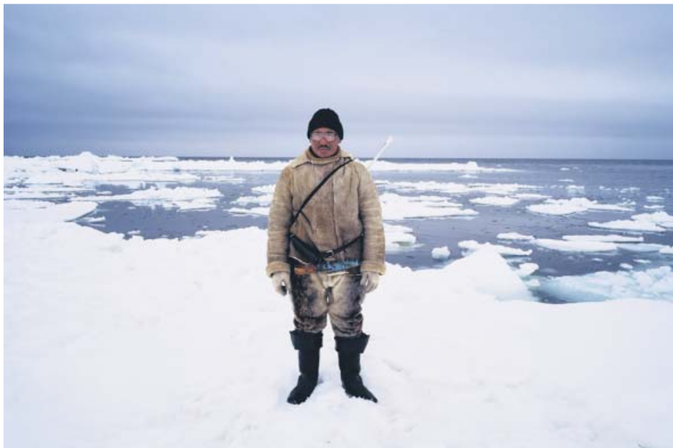
Fotograma del filme Cazadores (2008), de Carlos Casas.