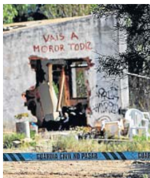
Casa donde vivía la familia, en Godella.

había ordenado Dios». Según su confesión a la Guardia Civil, publicada por el programa Espejo Público , explicó a los agentes que quitarles la vida a sus hijos «era la única forma de salvar sus almas y salvarme yo misma». La mujer asegura que Dios le «ordenó que practicara un ritual de purificación». Gombau tenía antecedentes por problemas mentales y desatención a los menores que habían alertado a los servicios sociales. ●