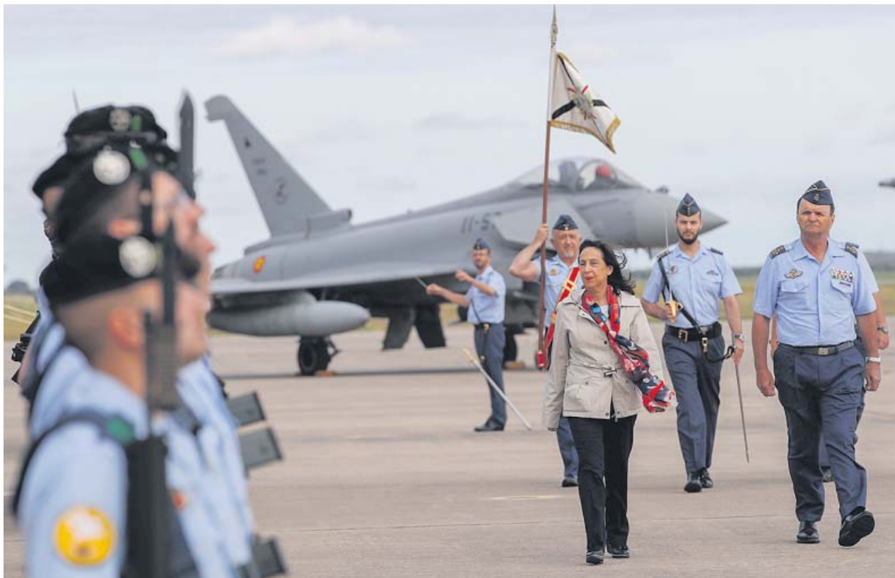
La ministra Margarita Robles, acompañada del jefe del Estado Mayor del Aire, Javier Salto Martínez-Avial (d), en Morón.

Todo este reciclaje ha contribuido de manera directa al ahorro de 1,45 millones de toneladas de materias primas y ha evitado el consumo de más de 20 millones de metros cúbicos de agua. Igualmente, se ha conseguido reducir el gasto de energía en 6,2 millones de MWh y en 1,6 millones de toneladas de CO 2 enviadas a la atmósfera, lo que equivale a casi 36.400 vuelos entre Madrid y Sevilla. ●