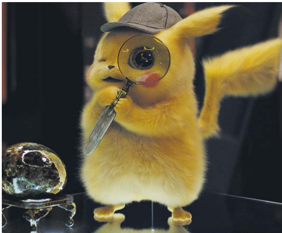
Pikachu, el detective esponjoso que preferirás tener lejos de tu cafetera.

Sin embargo, con el primer tráiler nacieron las ganas irrefrenables de adentrarnos en ese mundo de Pokémon hiperrealistas que conviven en paz y armonía con los humanos. El hecho de que esté inspirada en el videojuego homónimo de Nintendo y prescindir de Ash Ketchum, protagonista en la serie y las películas animadas, ya nos ponía sobre aviso de que esta historia tenía ambición. Pero fue el primer adelanto,