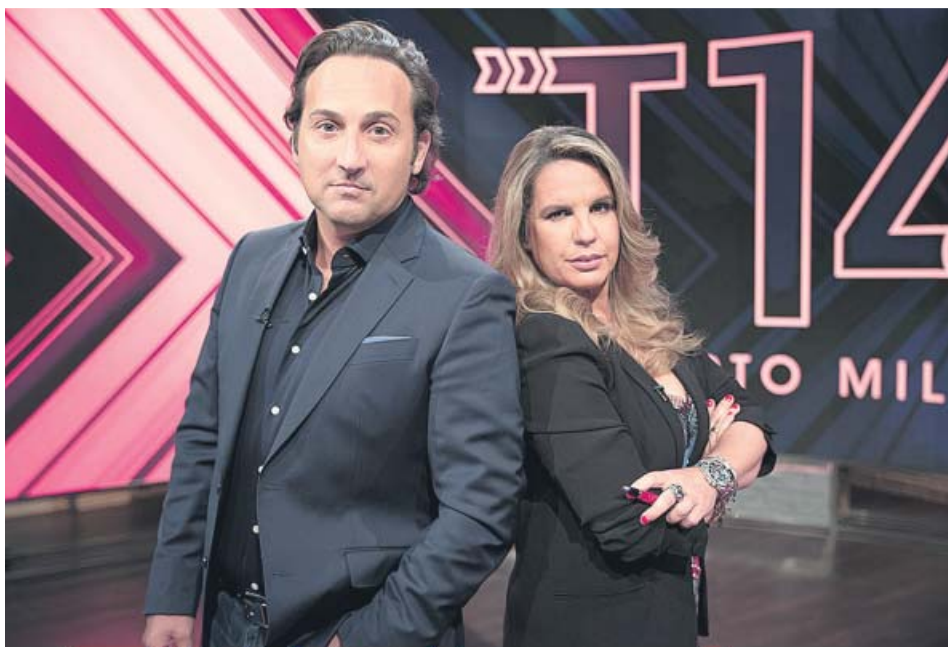
Iker Jiménez y Carmen Porter, presentadores del programa Cuarto Milenio.