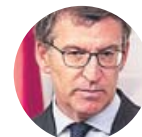
ALBERTO NUÑEZ FEIJÓO Presidente de la Xunta de Galicia.

«Soy presidente del Partido Popular de Galicia, estoy donde quiero estar»