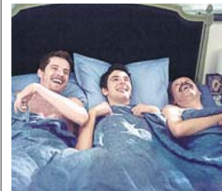
Los protagonistas de la película de Honoré.

La nueva película de Honoré quizá sea la que más cerca está de cumplir con las expectativas que un día erigieron al