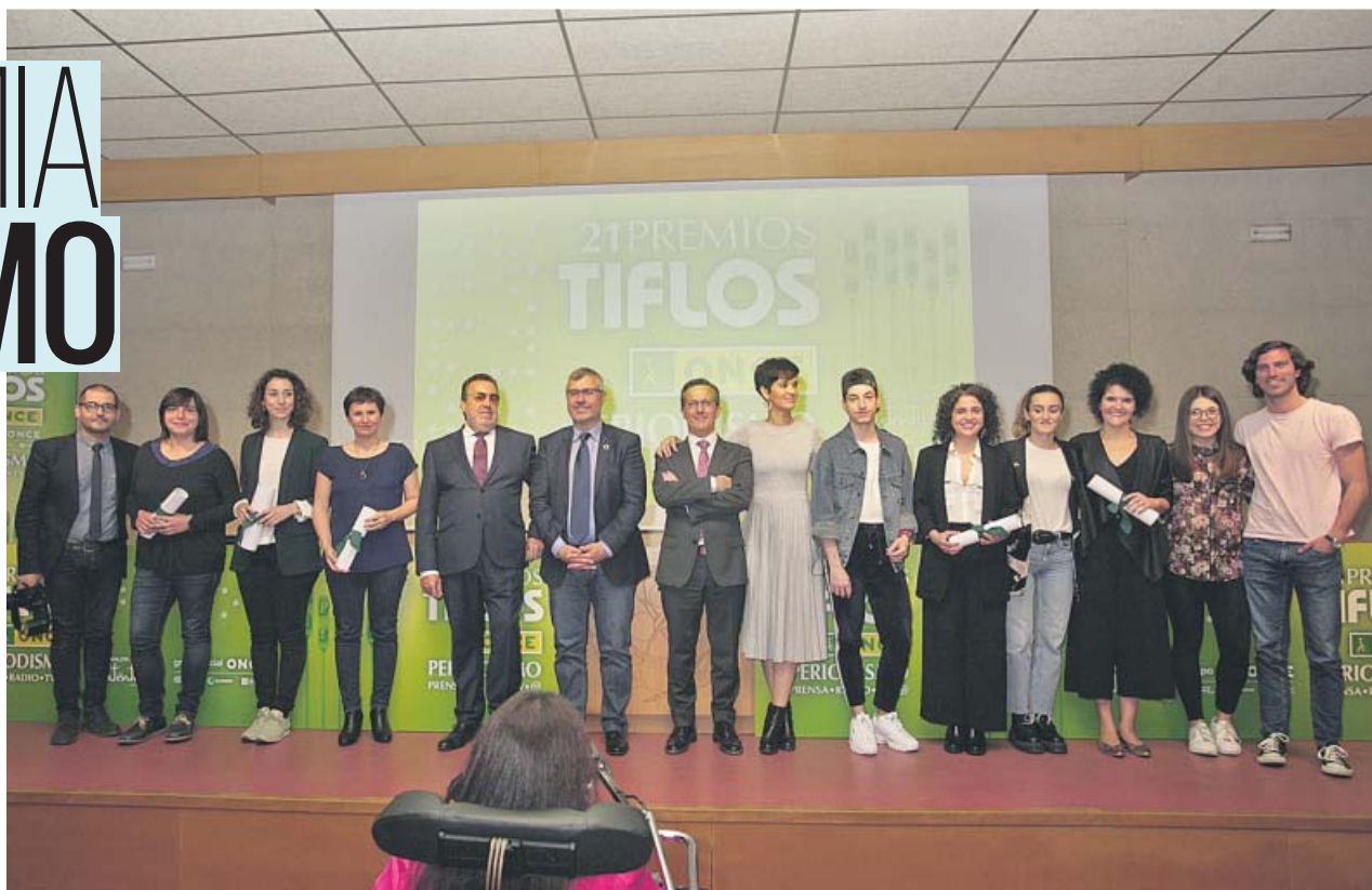
Los ganadores junto al presidente de la ONCE, el Secretario de Estado de Comunicación y el decano de la UCM.