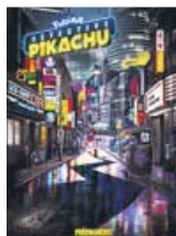
2019. Director Rob Letterman Reparto Ryan Reynolds, Justice Smith, Kathryn Newton

La película cumple con lo prometido. Es una delicia visual, poco más de hora y media en la que no pararás de decir «Ohhhhh» con cada