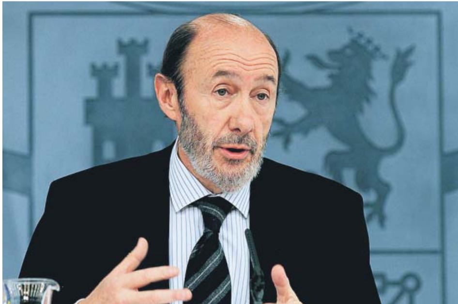
Alfredo Pérez Rubalcaba, en una imagen de 2010, cuando era vicepresidente.