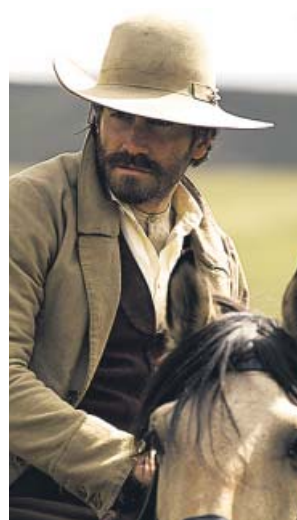
Jake Gyllenhaal cabalga por el salvaje Oeste.

Con un ojo puesto en El hombre que mató a Liberty Valance y otras aproximaciones al género en decadencia, Audiard hace caso omiso a la máxima del clásico de Ford y opta por imprimir los hechos y no la leyenda. Los hermanos Sisters cabalgan por un Oeste que ya no tiene casi nada de viejo. La misión que les ha encomendado el