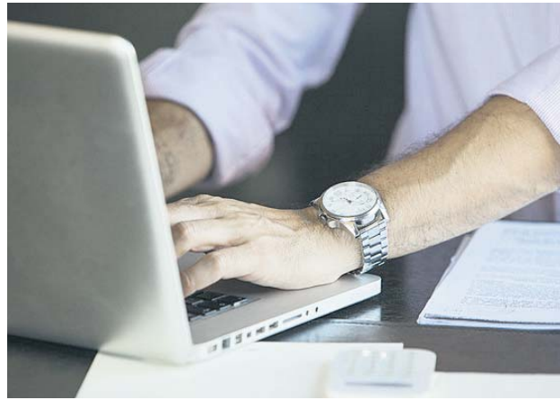
Imagen de un hombre con un ordenador.

Desde este domingo las empresas están obligadas a registrar cuándo empiezan y terminan a trabajar sus empleados. El cómo lo harán será negociable