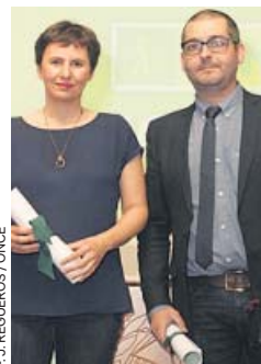
F.J. REGUEROS / ONCE

El 12 de mayo entra en vigor la modificación del Estatuto de los Trabajadores por la cual la empresa deberá garantizar el registro diario del horario de su empleado: cuando entra y cuando sale. La gran duda, el cómo ejercer ese control, estará sujeto a la «negociación colectiva» entre la empresa y sus trabajadores. PÁGINA 7