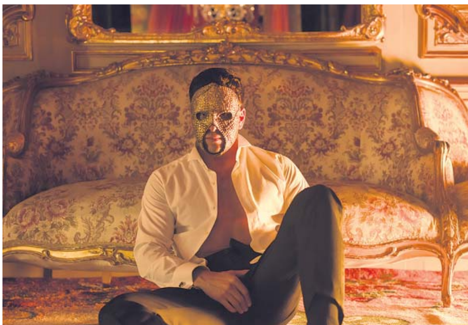
Marco Mur (Mario Casas) da rienda suelta a sus sueños eróticos.