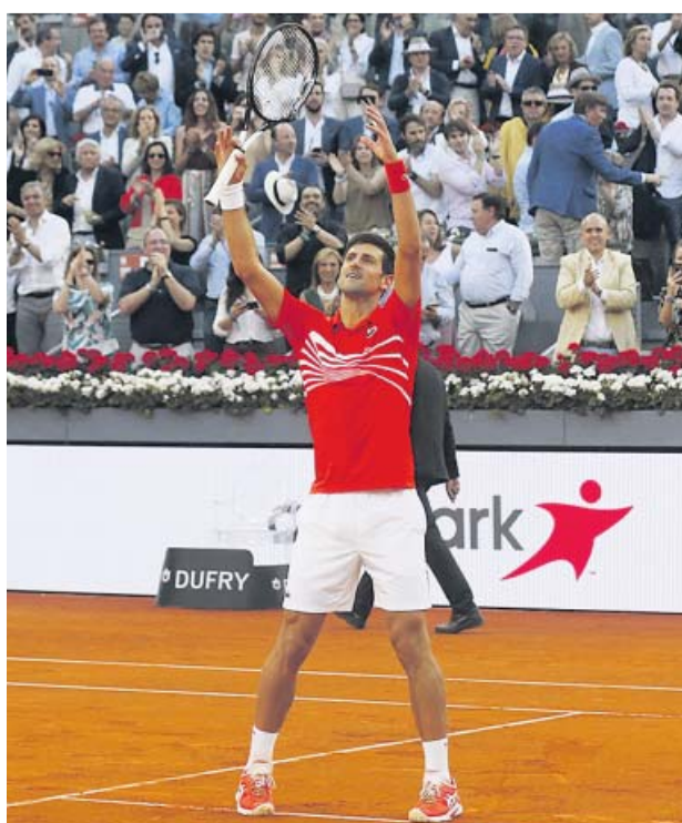
Djokovic celebra en título en el Mutua Madrid Open.

EL SERBIO derrotó en la final del Mutua Madrid Open al griego Tsitsipas en poco más de hora y media EL ACTUAL NÚMERO UNO ya había ganado en la capital de España en los años 2011 y 2016 LOGRA su segundo torneo del año, después del Abierto de Australia, y el Masters 1.000 33.º de su carrera