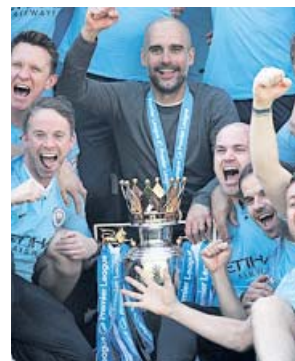
Guardiola celebra el título de la Premier League.

gunda plaza, pues los de Pep lograron, con su triunfo, 98. Por momentos, el título estuvo en las manos del Liverpool. El gol de Sadio Mané a los Wolves, unido al de Murray para el Brighton, hicieron soñar con el título a los de Anfield. Pero pronto se encargó el City de di-