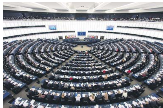
El plenario del Parlamento Europeo, en Estrasburgo.

España vota en un sistema de circunscripción única a los 54 eurodiputados, de un total de 751, que representarán al país en la Eurocámara.