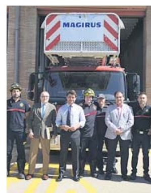
El candidato del PP visitó ayer un parque de bomberos. PP

Por otro lado, el candidato popular prometió la construcción de tres nuevos parques de bomberos, uno en el entorno de Los Remedios-Triana, otro en el Distrito Este-Alcosa-Torreblanca y un tercero en el Distrito Norte, además de la reforma y mejora de los que hay actualmente.