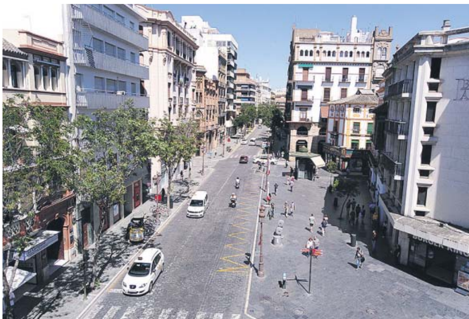
Vistas de la Campana y la calle Laraña, incluidas en el proyecto de peatonalización. B. R.

R. A. zona20andalucia@20minutos.es / @20m