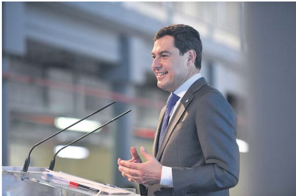
El presidente de la Junta anuncia los presupuestos para 2019 en el Foro ABC.

PROYECTO Se aprobará el día 30 y se iniciará su tramitación el 31