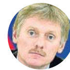
DMITRY PESKOV Portavoz del Kremlin ruso

«Sin lugar a dudas la guerra comercial entre EE UU y China tendrá consecuencias para el clima económico mundial»