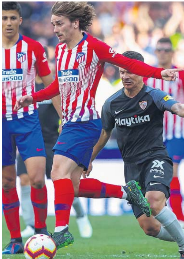
Griezmann, durante un encuentro ante el Sevilla.

A sus 28 años, Griezmann ha logrado en el Atlético de Madrid instalarse definitivamente en la elite del fútbol. Ahora, pondrá rumbo a Barcelona en busca de convertirse en el escu-