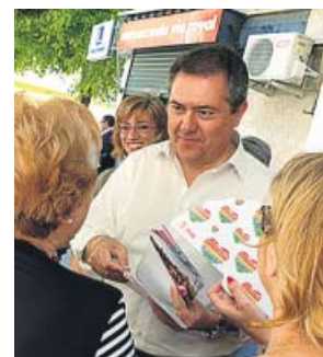
Juan Espadas, durante una visita ayer en la Macarena. PSOE

El alcalde de Sevilla y candidato del PSOE a la Alcaldía, Juan Espadas, anunció ayer un plan de inversiones en el arbolado y los espacios públicos de las barriadas que el Ayuntamiento ha empezado a recepcionar en este mandato y que ampliará durante el próximo. Se trata de espacios que durante los últimos 30 años han dependido de las comunidades de propietarios, por lo que el Consistorio no podía intervenir, pese