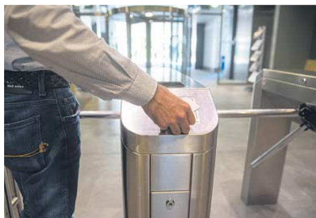
Un trabajador atraviesa unos tornos en su empresa.

●●● El Tribunal de Justicia de la Unión Europea dictaminó ayer que los Estados miembro tienen que obligar a las empresas a implantar un sistema «objetivo, fiable y accesible» que permita computar la jornada laboral diaria de sus trabajadores. Este fallo responde a una petición de la Audiencia Nacional para poder resolver una demanda de UGT, CCOO y otros sindicatos.