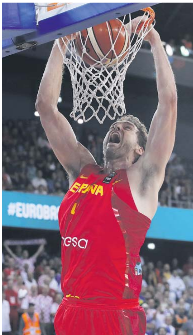
Gasol, en el Eurobasket de 2015 en el que ganó el oro.

En primer año fue una pieza importante en San Anto-