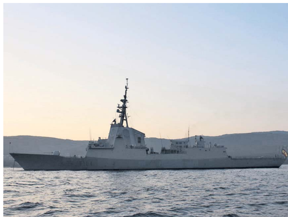
Una imagen de la fragata Méndez Núñez.

Las eléctricas también mejoran su percepción entre la ciudadanía y registran un 24% frente al 16% de 2018, pero una vez más cierran el ranking de las peor valoradas. No en vano, este sector suele acaparar un gran volumen de reclamaciones. En 2017 —últimos datos disponibles—, los usuarios presentaron 1,13 millones de quejas contra estas compañías, según los datos que maneja la Comisión Nacional de los Mercados y la Competencia. Esto supone una media de cuatro reclamaciones por cada cien clientes. Más de la mitad tuvieron que ver con discrepancias en la medida de los consumos y en la facturación y el cobro y el 40% fueron resueltas a favor del consumidor. ●