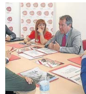
Espadas se reunió ayer con los jóvenes empresarios. PSOE

Se trata de un programa que vendría a reforzar los trabajos y la labor que se han desarrollado durante los últimos cuatro años a través del CREA y del servicio Sevilla Emprendedora.