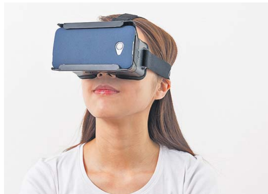
Está especialmente indicada en niños, a los que les cuesta más gestionar el miedo.

Si quieres conocer las últimas noticias sobre el caso Huawei visita nuestra web 20minutos.es