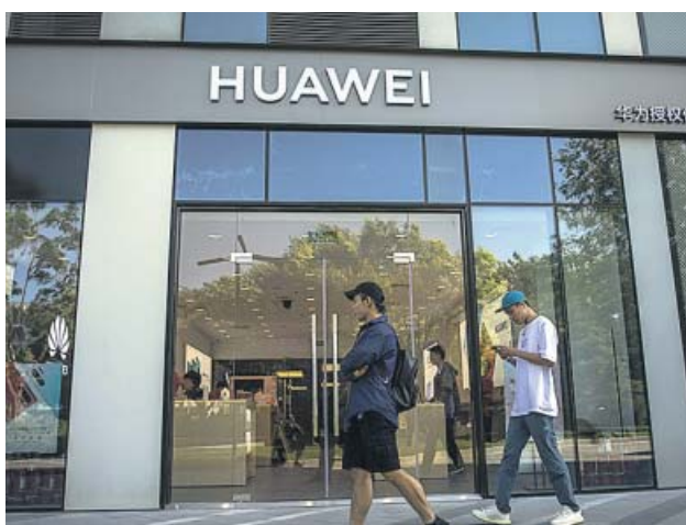
Dos hombres pasan junto a una tienda de Huawei en Pekín.