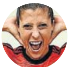
Jenni Hermoso ■ Atlético de Madrid ■ Extremo