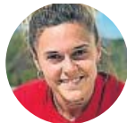
Mapi León ■ FC Barcelona ■ Lateral izquierdo