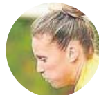
Sandra Paños ■ FC Barcelona ■ Portero