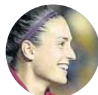
Alexia Putellas ■ FC Barcelona ■ Delanteras