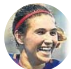
Mariona Caldentey ■ FC Barcelona ■ Centrocampista