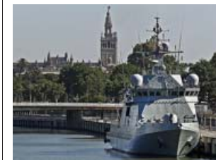
Uno de los buques.

Mientras, fuentes de Aena señalaron que el ensayo del desfile de diversos aviones provocó ayer retrasos de hasta una hora y media en al menos veinte vuelos. ● R.S.