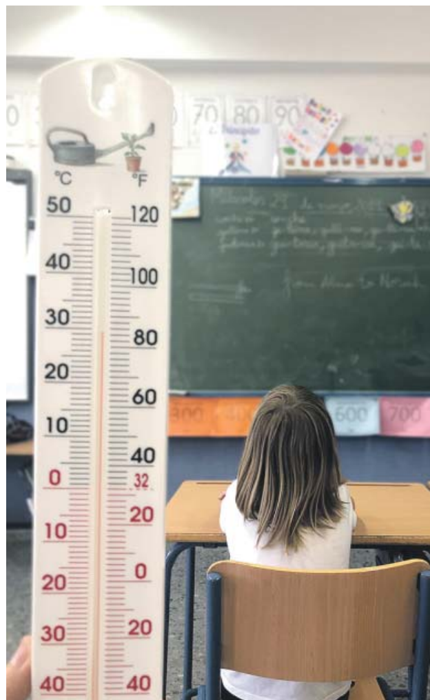
Aula de un colegio de Sevilla a casi 30 grados, ayer.

Estos trabajos contemplan la instalación de un aislamiento térmico exterior en las fachadas y en las cubiertas, la renovación de ventanas y la climatización interior con ventiladores, no con aparatos de aire acondicionado. También se mejorará la iluminación en las zonas comunes con criterios de eficiencia energética y se instalarán contadores para registrar la energía consumida en cada momento. Todo ello supondrá, según el Consistorio, una reducción de