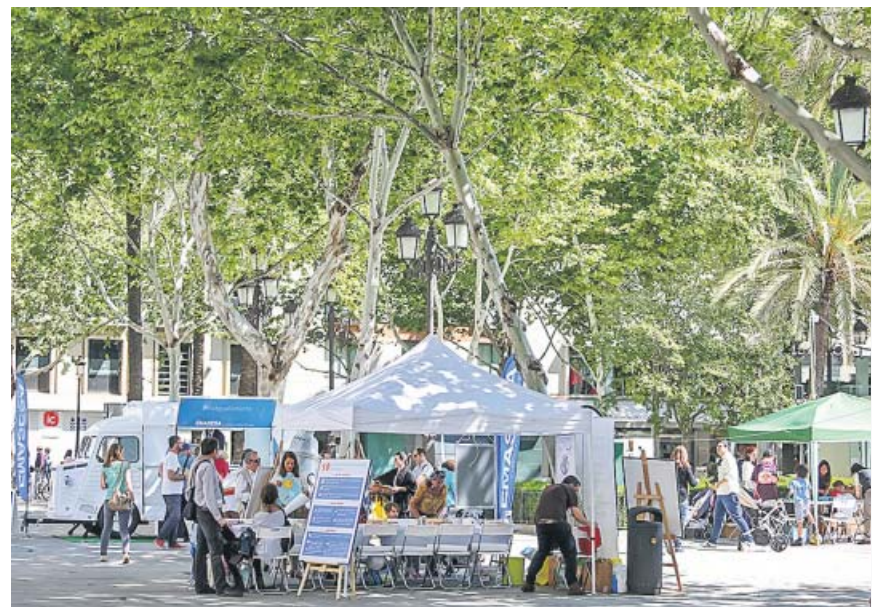
La empresa pública del agua ha organizado una serie de talleres dirigidos a todos los públicos.

La Estación de Ecología Acuática estará abierta el viernes 31 de 17.30 a 20.30 h y el sábado 1 de 11.30 a 14.30 h, donde podrán conocer los peces del río Guadalquivir en un acuario con un túnel por el que poder introducirse y disfrutar del movimiento de los peces sobre nuestras cabezas. Para más información visita: http://www.emasesa.com