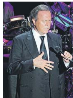
El cantante Julio Iglesias durante un concierto.