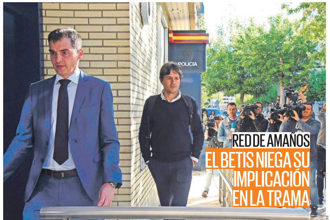
RED DE AMAÑOS EL BETIS NIEGA SU IMPLICACIÓN EN LA TRAMA

El Betis salió ayer al paso de las informaciones que hablaban de su partido ante el Huesca como uno de los investigados. «El Betis es ajeno a cualquier trama», anunciaba el club. Los posibles amaños también afectarían indirectamente al Sevilla, puesto que dos partidos del Valencia, rival sevillista por la Champions, podrían estar siendo investigados. PÁGINA 10