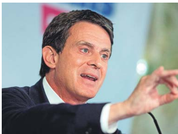
Manuel Valls, ayer, durante la rueda de prensa.

Valls, en cambio, no encontró el respaldo de Cs, que descarta las opciones «populistas e independentistas» y solo se abre a negociar con Collboni. «El resultado en Barcelona no nos permite gobernar la ciudad y por tanto estaremos en la oposición», comentaron fuentes del partido tras conocer las afirmaciones de Valls. «Si hubiera que impedir que haya un alcalde independentista o populista los concejales de Cs nego-