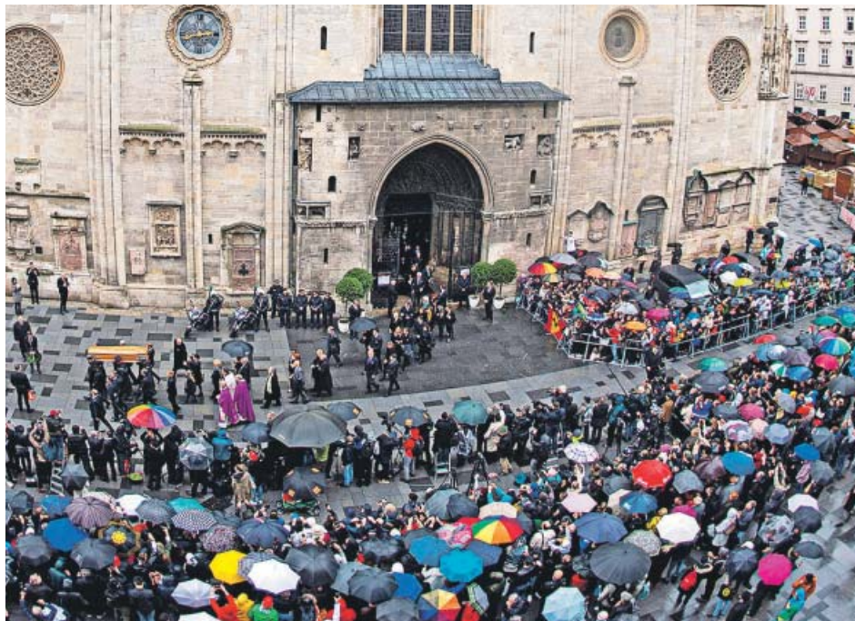
Larguísimas colas se formaron para poder despedirse del campeón austriaco.

La comisión técnica de la selección brasileña descartó que el delantero Neymar haya sufrido alguna lesión de gravedad tras los exámenes a los que lo sometió después de que el jugador del PSG abandonara cojeando el entrenamiento del martes.