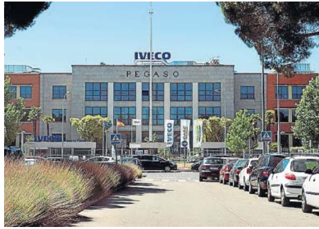
Sede de Iveco en San Fernando de Henares (Madrid).

Una mujer de 32 años se ha suicidado después de que sus compañeros de trabajo de la automovilística Iveco difundiesen imágenes suyas de carácter sexual