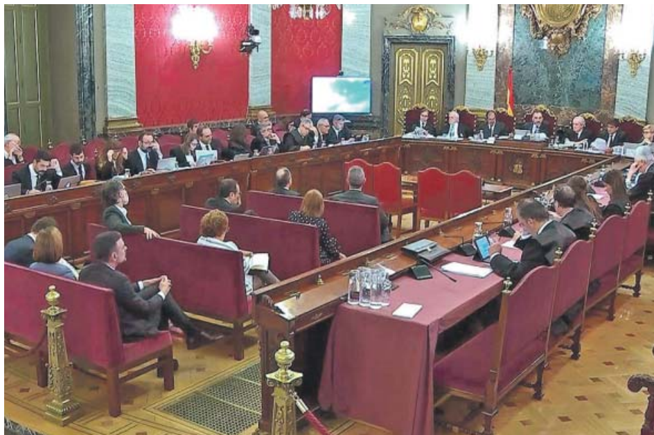
La Sala del Supremo donde se juzga a los líderes del procés .

En su escrito de 130 páginas, los fiscales describen un clima