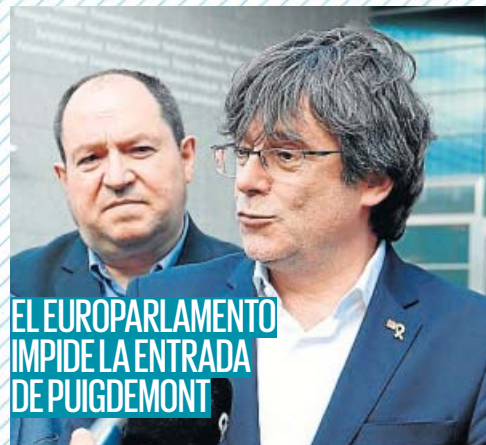
EL EUROPARLAMENTO IMPIDE LA ENTRADA DE PUIGDEMONT

La Fiscalía ha mantenido las penas de prisión contra los 12 líderes soberanistas tras computar un total de 208 actos violentos y ha pedido que si son condenados no se les aplique el tercer grado hasta cumplir la mitad de la pena, lo que impediría a la Generalitat aplicar beneficios antes de tiempo. PÁGINA 4