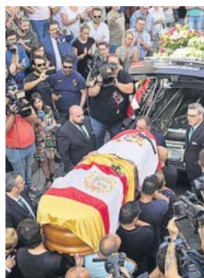
Emocionado adiós a José Antonio Reyes en Utrera.

El cuerpo de Reyes había sido velado la noche anterior en el Ayuntamiento utrerano, del que salió a las nueve de la mañana hacia el templo, cubierto con una enseña nacional y la bandera del Sevilla, el club en el que se formó y en cuyo primer equipo mi-