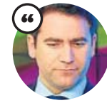
TEODORO GARCÍA EGEEA Secretario general del PP

«Pido un esfuerzo por parte de todos, la foto de Gobierno en Andalucía ha sido positiva»