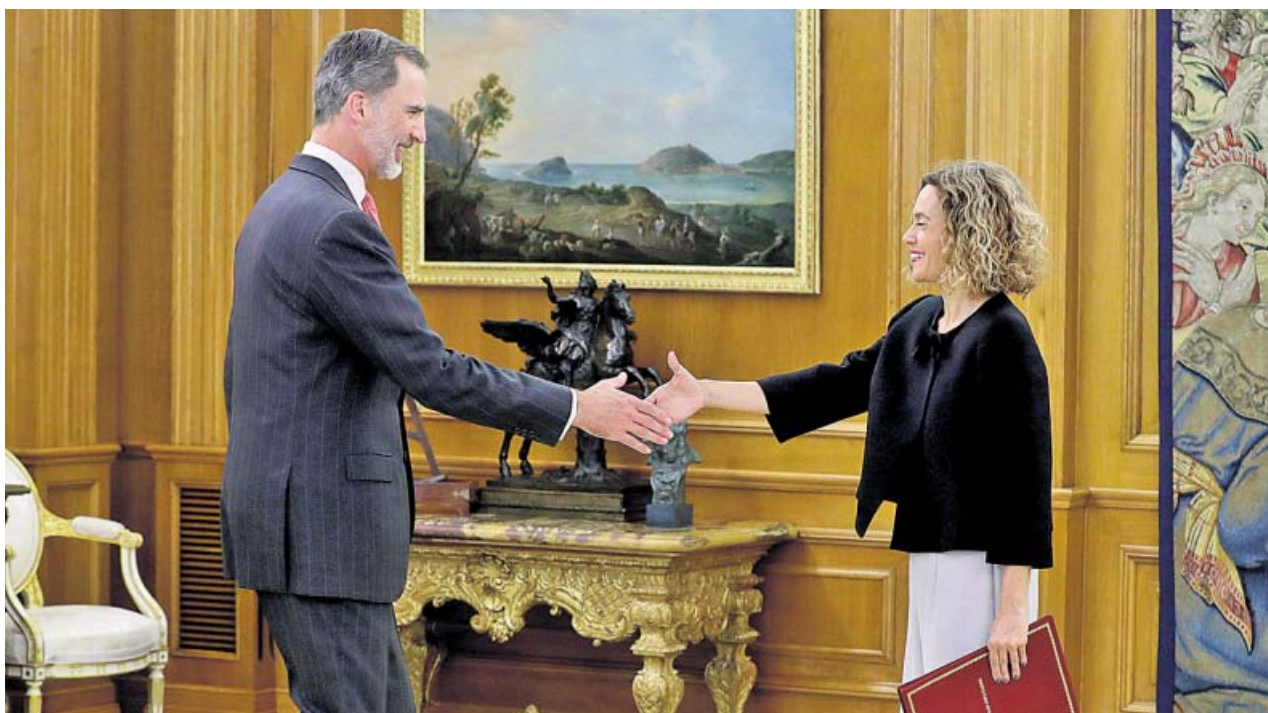
El rey Felipe VI y la presidenta del Congreso, Meritxell Batet, ayer durante el encuentro mantenido en la Zarzuela.

Ciudadanos insiste en su defensa de «la regeneración democrática, la bajada de impuestos y la limitación de la burocracia». Según Villegas, van a ser «el dique de contención» del Gobierno de «Sánchez e Iglesias que está por hacer». También será un pilar fundamental la unidad de España y la «defensa del Estado de derecho», en referencia a la aplicación del artículo 155 en Cataluña: «Son nuestros ejes de siempre». ●