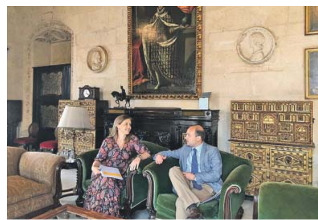
Los concejales electos de Vox en el Ayuntamiento de Sevilla.