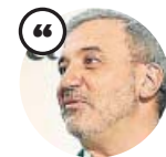
JAUME COLLBONI Candidato del PSC a la Alcaldía de Barcelona

«Nuestro objetivo es trabajar para formar un gobierno fuerte, estable y progresista»