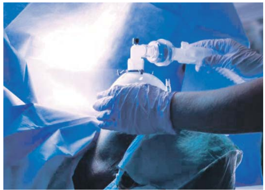
La epilepsia no es una enfermedad mental sino una lesión física en el cerebro.