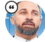
SANTIAGO ABASCAL Presidente de Vox

«Nunca vamos a aceptar un trágala de lo que pacten PP y Ciudadanos. Queremos diálogo»