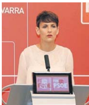
La candidata del PSOE al Gobierno navarro. FIRMA

gresista en torno a su inversión. La alternativa es que el PSN pacte con la unión de UPN, PP y Cs en Suma Navarra y Chivite seguirá explorando la suma de las izquierdas, para lo que deberá contar al menos con la abstención de Bildu. Esto colisiona con la posición de la dirección nacional del PSOE, que ha advertido de que la formación abertzale es la «línea roja» que no pasará para formar gobierno en Navarra. ● R. A.