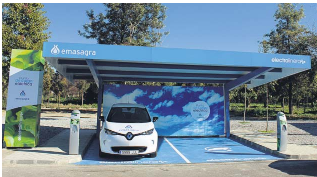
Arriba, una imagen de la Biofactoría Sur de Granada. Abajo, una de las 'electrolineras' de Emasagra.

Andalucía. Esta plataforma funciona como un espacio abierto y participativo donde se informa y divulga a todos los niveles (empresarial, institucional y social) para fomentar la sensibilización y concienciación social sobre los efectos adversos del cambio climático, además de promover actuaciones en este sentido.