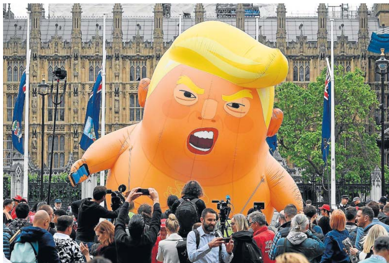
Los manifestantes rodean a Baby Trump, el globo gigantesco que se mofa del presidente.