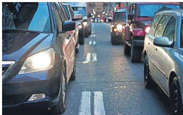
El tráfico es uno de los factores más contaminantes.

Usar el transporte público, compartir coche -mejor si es híbrido o eléctrico- o moverse en bicicleta, reducir el consumo de carne y lácteos con lo que se reduce las emisiones de metano que emite el ganado, reciclar, hacer un uso eficientes de los sistemas de calefacción y aire acondicionado en casa, y apostar por un consumo sostenible, son algunas sencillas pautas que desde la OMS recuerdan como fundamentales para reducir estas preocupantes cifras y mejorar, entre todos, el aire que respiramos. ●