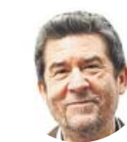
Por Carlos Santos Periodista

Lo tienen ya claro? ¿Se han enterado de que para representar a las personas que les han dado el voto van a tener que pactar y que pactar significa ceder, escuchar al otro y renunciar a algunos planteamientos previos? Aunque algunos siguen poniendo líneas rojas como posesos y parecen tan solo preocupados por el tradicional «a ver qué nos llevamos» yo creo que sí, que lo tienen claro y que van aprendiendo —a la fuerza ahorcan— cómo funciona la democracia representativa.