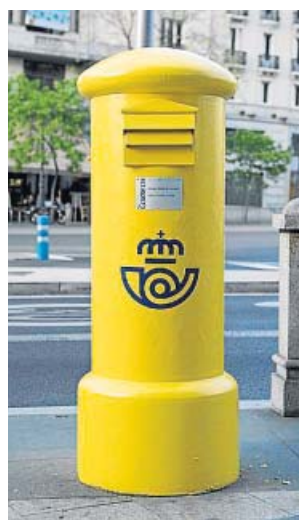
Un buzón de Correos con la nueva imagen corporativa.

Correos Express es la mayor red de transporte de España, con 54 delegaciones, más de 1.000 Oficinas de Correos, 1.800 vehículos y 3.000 profesionales. ●