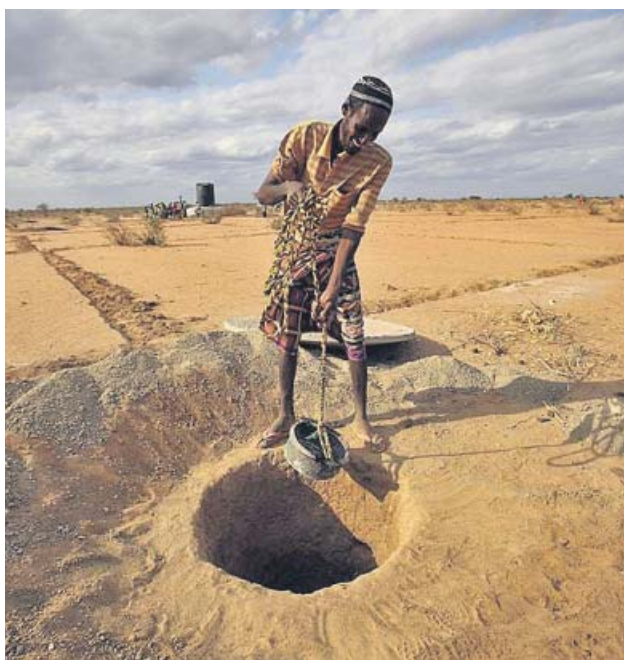
El Cuerno de África sufre una de las sequías más largas. CRISIS AID

De la fauna, las tortugas marinas serían las más afectadas en este territorio; en concreto, las tortugas boba, verde y laúd. El cambio climático pone en riesgo sus áreas de cría y alimentación, tal y como recoge WWF. Por un lado, la temperatura de la arena depositan sus huevos determina el sexo con el que las tortugas eclosionarán y el aumento de la misma puede propiciar que solo nazcan hembras; y, por otra parte, la subida del nivel del mar pone en riesgo sus nidos, provocando su extinción. ●