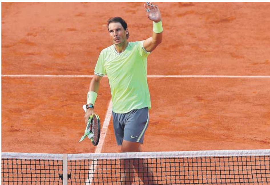
Rafa Nadal saluda al público francés tras su victoria ante Kei Nishikori.

LAS SEMIFINALES del torneo gallo verán un clásico de la historia del tenis: Rafa vs. Roger