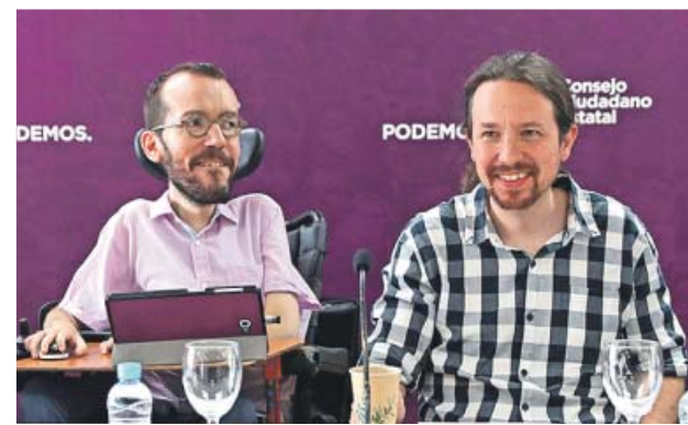
Echenique e Iglesias, en una foto del pasado mayo.