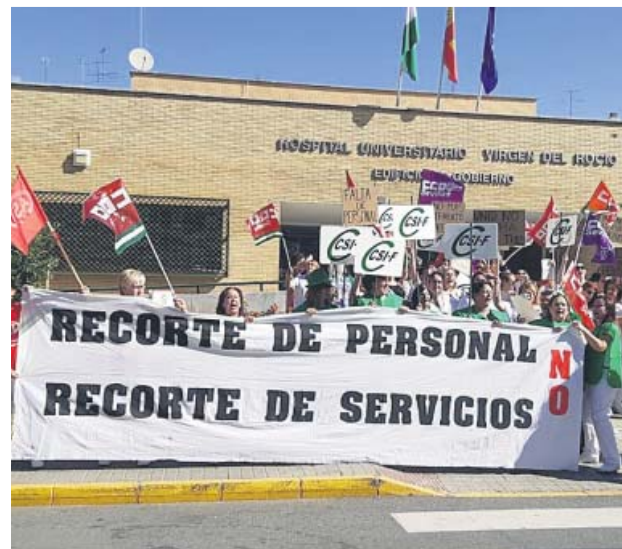
Concentración de las trabajadoras en el hospital, ayer.

Pero lo más grave, continúa, es la problemática que se da en las zonas «más sensibles» del centro. Así, tanto en la UCI como en los quirófanos «se supone que debería haber un limpiador solo para esas áreas, pero al no haber personal los trabajadores tienen que salir a limpiar plantas y luego volver, con el riesgo de contagio que ello supone». Lo mismo sucede en las zonas donde están hospitalizados du-