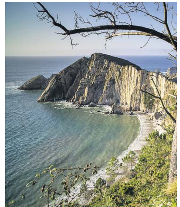
La playa del Silencio (Cudillero) es una candidata.

La lista de candidatas, que se puede consultar en 20minutos.es, incluye una decena de playas repartidas por el territorio nacional (una por cada comunidad autónoma) en las que la acción se hace especialmente necesaria debido a la riqueza de su ecosistema o a la dificultad que existe para acceder a ellas con medios mecánicos. Clientes, colaboradores y empleados de Carrefour y P&G también limpiarán una de las playas de Denia junto a voluntarios de Paisaje Limpio, la ONG Xaloc, Cruz Roja, Volans y el Ayuntamiento de la localidad. Además, desde la organización han asumido compromisos firmes para reducir los gases de efecto invernadero en la mitad de sus plantas de producción y para buscar soluciones al plástico mediante envases de plástico reciclado y reciclable. ●