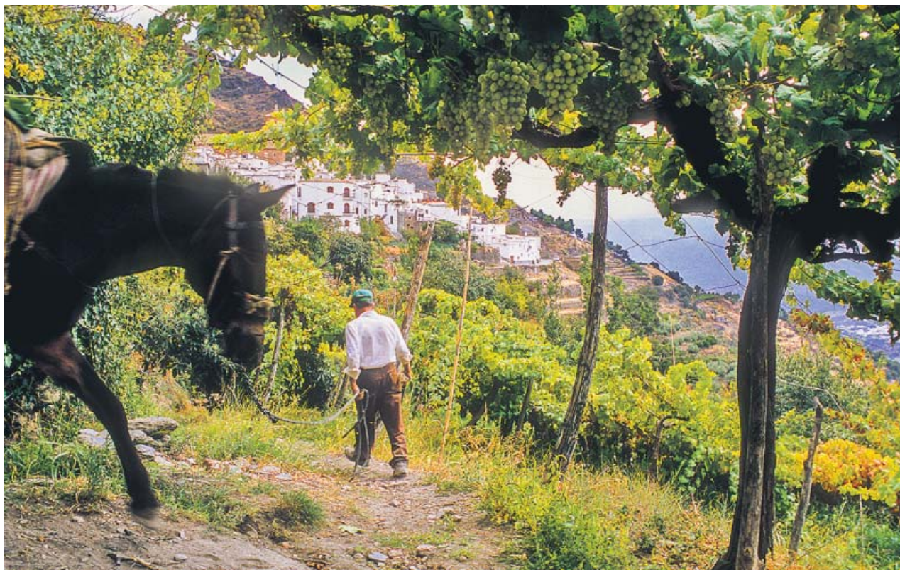
El municipio de Ohanes, en la Alpujarra almeriense, fue declarado en 1999 el primer municipio ecológico de Europa.