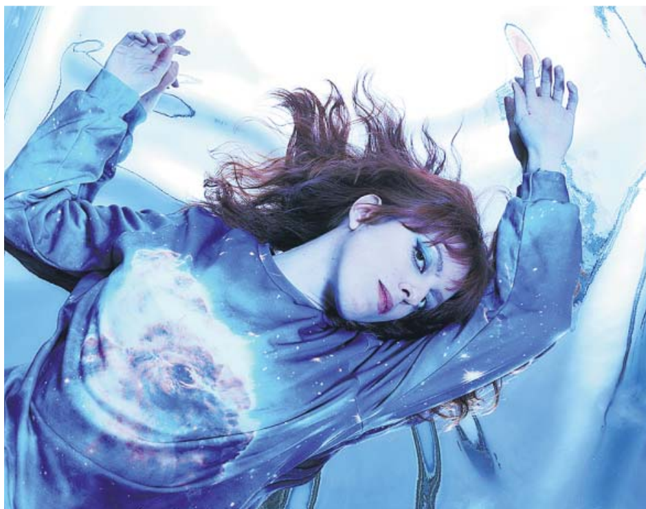
Le Parody en una imagen promocional de su nuevo disco, Porvenir . NICKIE DIVINE

La granadina se ha metido «de lleno» en la electrónica: «Pensé en hacer un disco puramente instrumental, de baile y sin voz, usando las máquinas para hacer directos improvisados». Por eso Porvenir es un trabajo «radical», de hecho, el que más: hay fuerza en el beat y en la forma de cantar. La artista explora «el cancionero típico andaluz» y, aunque para ella los textos no sean primordiales, los trata con mimo. «Acudí a letras antiguas de flamenco, las cogí tal y como estaban e hice calcos con mis propios temas; después probé combinaciones», explica.