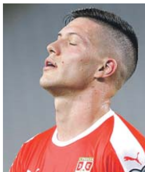
Jovic será presentado hoy por el Real Madrid.

Mientras, el Atlético se encuentra en stand-by, tanto en refuerzos como en posibles salidas. Oblak, Rodri y Costa siguen ocupando titulares para hacer las maletas, mientras el capítulo de llegadas de momento tiene su pilar central en la joya portuguesa Joao Félix.