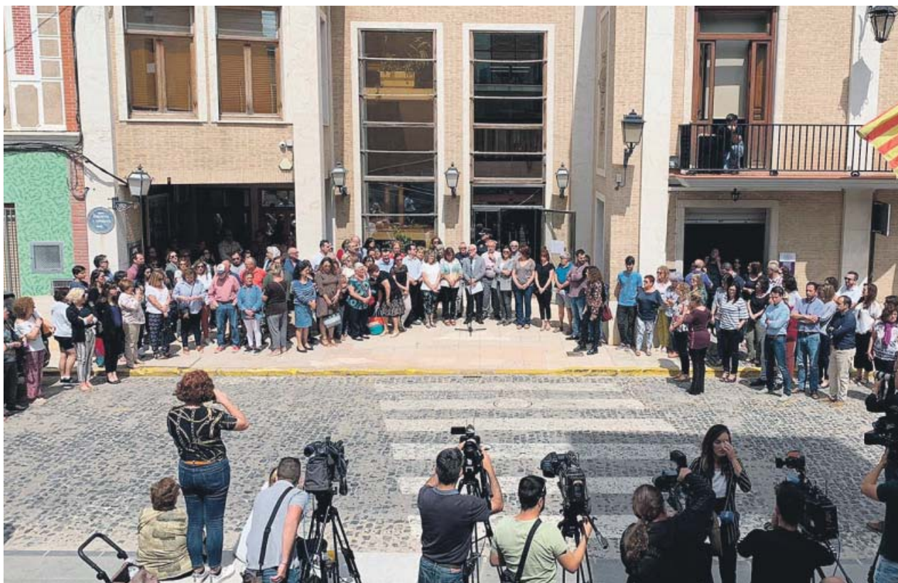
Vista general del ayuntamiento de Alboraya durante los tres minutos de silencio que se han guardado por el crimen.

La Comunidad Valenciana es la segunda región –junto a Andalucía y Madrid– donde más crímenes machistas se han cometido en 2019, solo por detrás de Canarias. Concretamente han sido cuatro las mujeres asesinadas por sus parejas o exparejas en la región. ●