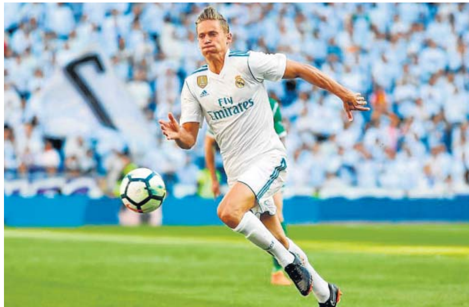
Marcos Llorente, con el Real Madrid.