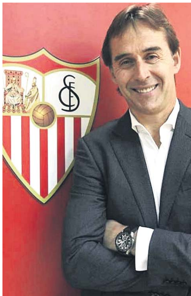
Lopetegui, el día de su presentación.

Ambos casos son diferentes. El futbolista francés aprovechó los recientes partidos de su selección para abrir la puerta de salida, para dejarse querer y para dejar claro que quiere progresar. Su nombre ha sido relacionado con los principales equipos europeos, desde el PSG hasta el Barcelona. Se dice que el club francés llegó a ofrecer 35 millones, pero que el Sevilla no se va a bajar ni un euro de los 40 de su cláusula. El probable destino del ariete es la Premier League, donde son varios los equipos que pue-