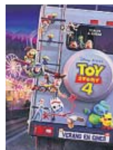
2019. Animación. Director Josh Cooley

El mérito de Toy Story 4 parece mayor si uno recuerda que, justo tras el despido de John Lasseter por acoso sexual, a la película le toca la papeleta de presentar al pri-