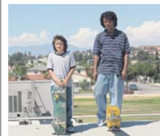
Joya de la cultura skater y hip hop de los 90. DIAMOND FILMS

En esta carta de amor a la cultura skater , el hip hop y una callejera Los Ángeles, Hill tira de su experiencia y de su admiración por esa escena en la que creció. Dibuja un re-