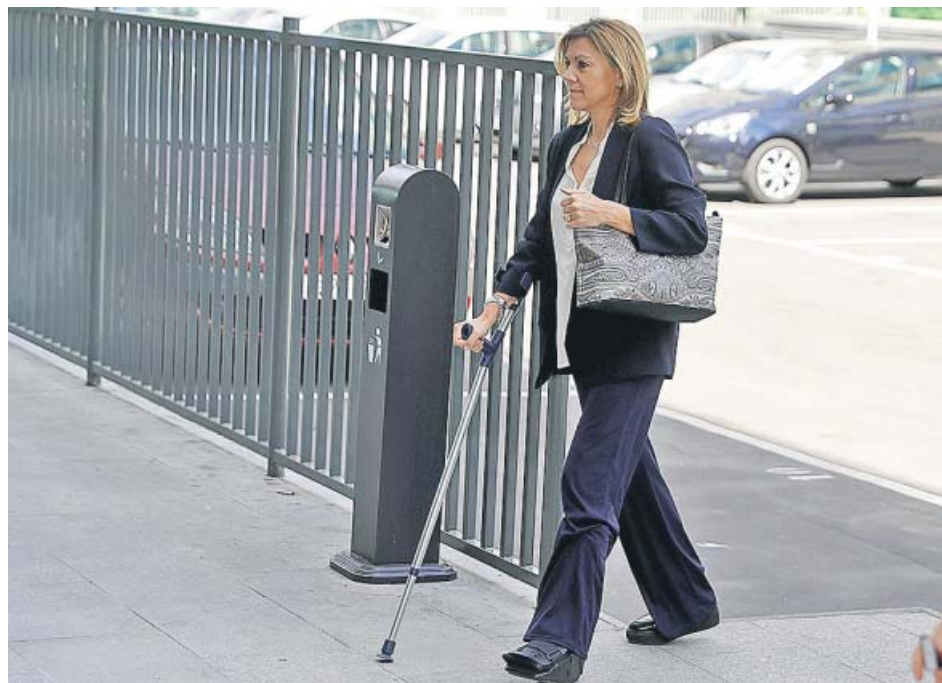
La exsecretaria general del PP, María Dolores de Cospedal, acude a declarar en muletas.

El exalcalde de Londres Boris Johnson y el ministro británico de Exteriores, Jeremy Hunt, se disputarán el liderazgo del Partido Conservador y la jefatura del Gobierno del Reino Unido.