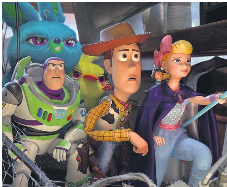
Esta vez, Buzz Lightyear, Woody y Bo Peep se han metido en una buena juguetería.

De esta manera, cuando uno se pregunta si esta película es necesaria para Toy Story , para Pixar o para el público en general, la respuesta está clara: no. Pero, aunque uno esté seguro de que Toy Story 4 no hace falta, tiene la obligación de valorarla como película. Y aquí está el lado positivo de nuestro mensaje: resulta que Toy Story 4 es buena. Buena, sin más, en oposición a «pionera» (como la entrega inaugural), «prodigiosa» (20 años