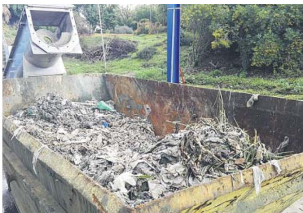
Parte de los residuos retirados por Emasesa.

LOS ATASCOS pueden causar malos olores en la ciudad y problemas de salubridad