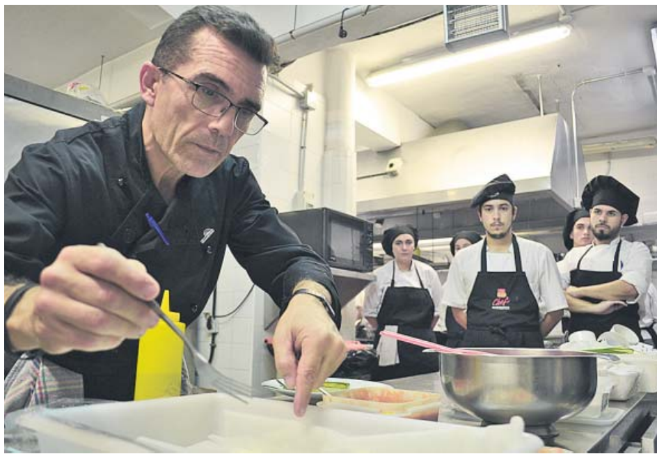
Alumnos en una de las clases de hostelería del IES Heliópolis.

Durante este curso que ahora termina, el IES Heliópolis ha contado con 30 alumnos en FP Básica, 320 en Grado Medio y 515 matriculados en un Grado Superior. En total, 865 estudiantes repartidos en distintos cursos, como los de energías renovables, sistemas de refrigeración y calor y administración de empresas, entre otros.