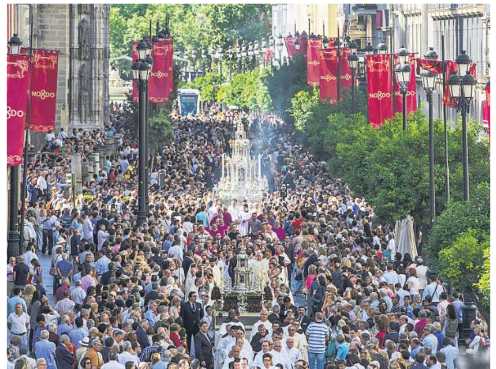
La Custodia de Juan de Arfe procesiona por las calles del centro de Sevilla.

No deben tirarse tampoco medicamentos, ya que resultan «muy perjudiciales» por su «gran carga química» y su dificultad de depuración. Contaminantes son también los aceites usados y las grasas, cuya depuración es «muy costosa», por lo que se recomienda su depósito en los puntos limpios. ●