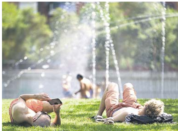
Los termómetros se dispararon ya ayer en algunas ciudades.

Del Campo destacó en declaraciones a 20minutos que el de 2019 será el cuarto verano con registros por encima de lo normal de la última década,