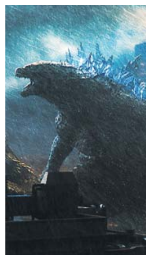
Godzilla quiere entrar en tu mente pisando fuerte.

No es ya que su libreto, estructurado según las arcanas leyes del desbarajuste, sea incapaz de transmitirnos las motivaciones de sus personajes humanos: es que tampoco sabe hacernos ver las de esos monstruos que se enfrentan en escenas repletas de un caos que no es ni estimulante ni abrumador, sino solo confuso. Por otra parte, mientras el tratamiento dispensado al