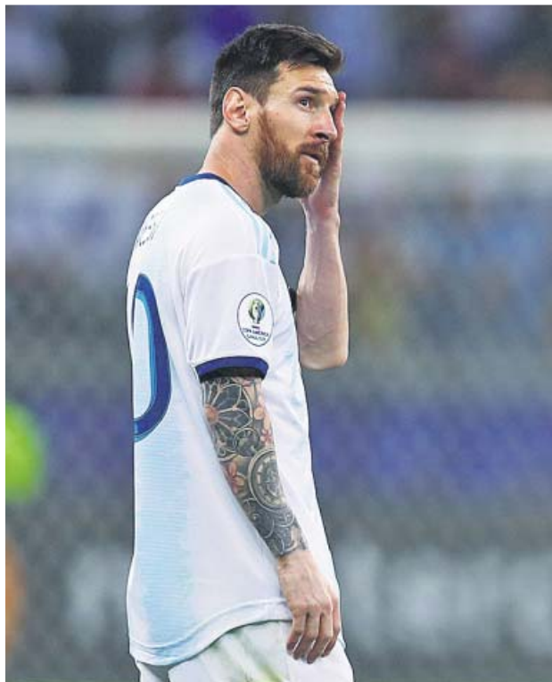
Messi, ayer durante el partido.

Era el momento de cargarse la selección a la espalda. La exigencia era máxima tras una dura derrota ante Colombia en Salvador (0-2), en la que Argentina no fue capaz de generar peligro y la Pulga había