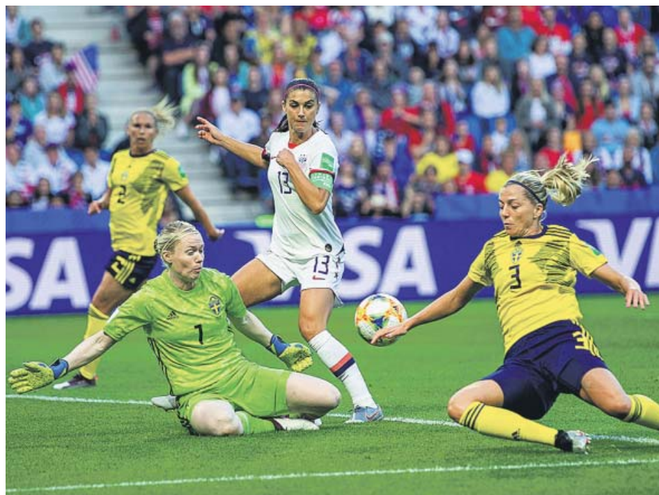
Alex Morgan (c) de EE UU, contra las suecas Hedvig Lindahl (portera) y Linda Sembrant (d).

La selección española de fútbol femenino jugará el próximo lunes, a las 18.00 h, los octavos de final del Mundial de Francia ante Estados Unidos, actual campeona del mundo y que ayer derrotó en el último partido de su grupo a Suecia (0-2). Las de Jorge Vilda afrontarán un partido con muchísimo que ganar, puesto que las norteamericanas parecen, a priori , inalcanzables. «Toque quien toque, lo daremos todo», dijo el lunes el propio Vilda tras el empate ante China. ● R. D.