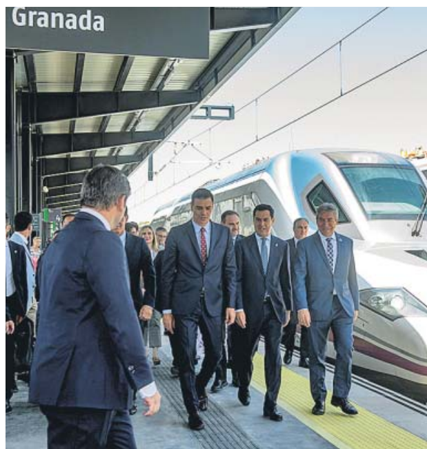
Pedro Sánchez (c) y Juanma Moreno (2d), en la estación.

En total, tres trenes diarios de Alta Velocidad harán a partir de hoy 568 kilómetros entre Madrid y Granada, con una duración de entre tres horas y tres horas y veinte minutos en fun-