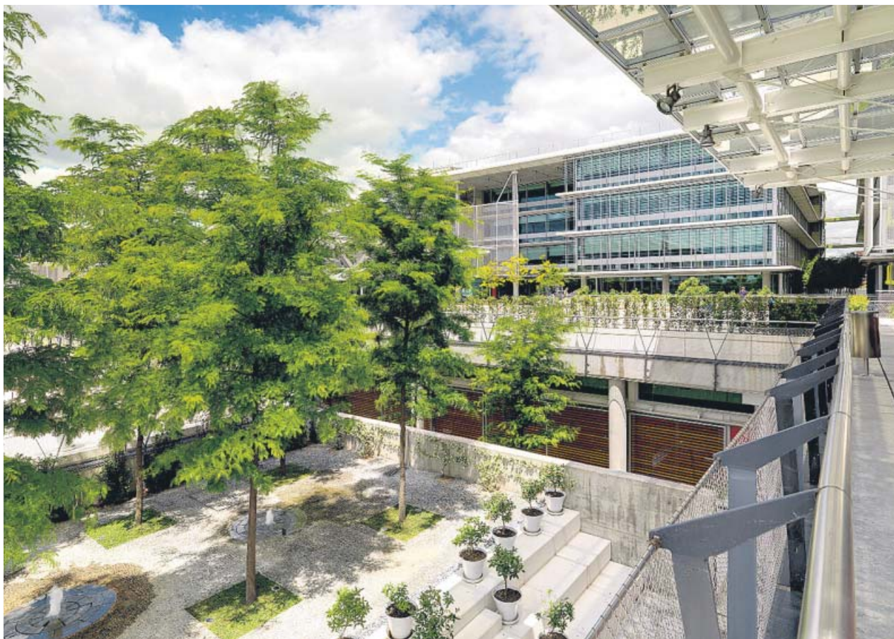
Campus de Palmas Altas, una de las sedes de la empresa Abengoa.