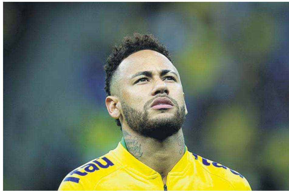
Neymar, en un partido con Brasil antes de lesionarse.