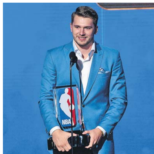
Luka Dončić, con el premio a mejor rookie del año.