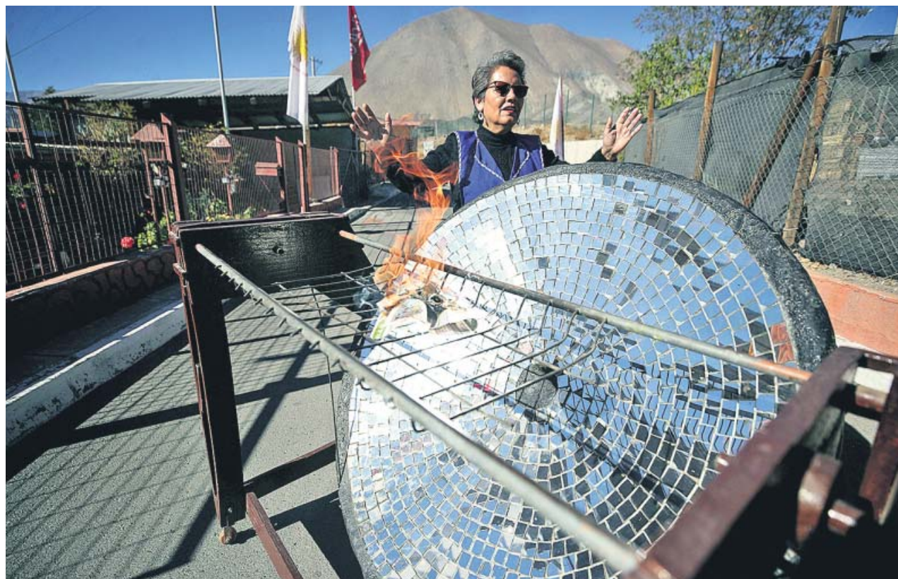
Una mujer prepara una parrilla solar para cocinar en la localidad chilena de Villaseca.

Para prevenir los efectos adversos del calor, especialmente en los más vulnerables —niños, mayores y enfermos crónicos—, la Cruz Roja propone una serie de medidas. Se recomienda beber líquidos aunque no se tenga sed, utilizar ropa ligera y con colores claros o evitar las actividades físicas en las horas centrales del día siempre que sea posible. Para proteger a los animales de compañía, la Guardia Civil recomienda comprobar si el asfalto no está demasiado caliente antes de pasearlos. ●