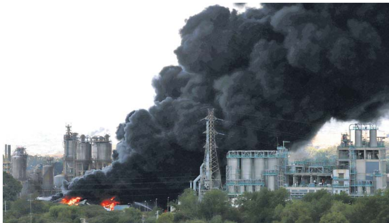
Una voluminosa columna de humo negro sale de las instalaciones industriales de Indorama, en San Roque (Cádiz).

Un centenar de efectivos —entre personal de la empresa, Cepsa y bomberos de Algeciras, San Roque, La Línea, Guadacorte, Cádiz, Jerez y Chiclana— seguían al cierre de esta edición (23.00 h) trabajando en su extinción, aunque el Plan de Emergencia se había desactivado. Los bomberos también refrigeraron otras naves cercanas para que el fuego no se propagara. ● R. A.