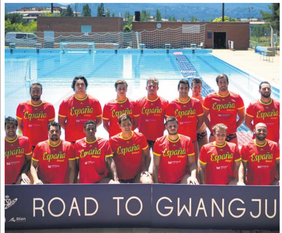
La selección española de waterpolo, lista para jugar el Mundial.

Juan Manuel Calderón, primo del futbolista José Antonio Reyes, que resultó herido grave en el accidente de tráfico en el que falleció el jugador hace ayer un mes, se mantiene estable dentro de la gravedad en la Unidad de Cuidados Intensivos (UCI) del hospital Virgen del Rocío de Sevilla.