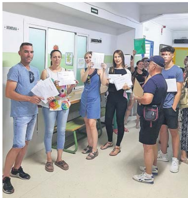
Padres del Alvareda con los sobres de matrícula.