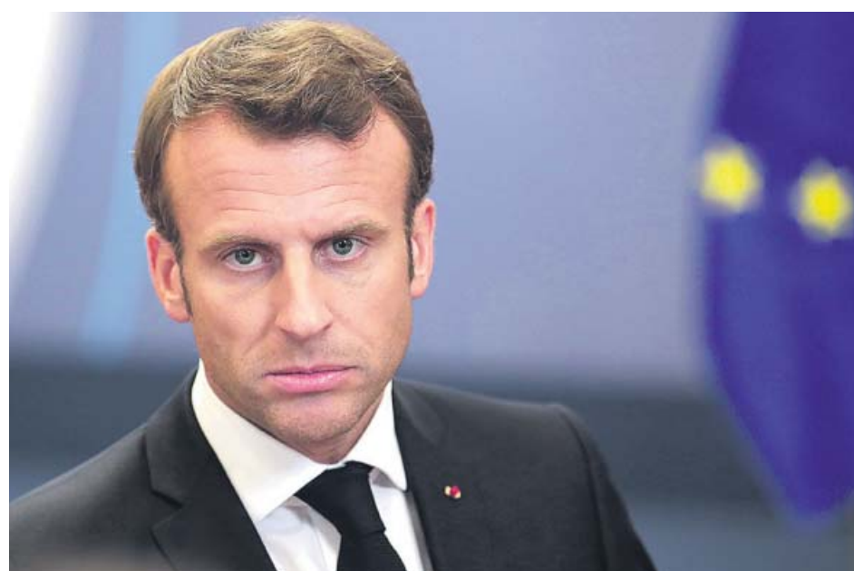
El presidente francés, Emmanuel Macron, ayer en Bruselas en el Consejo Europeo.

España parece que va a sacar poco provecho de ese tira y afloja entre familias europeas. Con los altos cargos muy lejanos para un representante español, Sánchez aspira a obtener un puesto de segunda línea. El Alto Representante sigue siendo una opción, pero muy lejana, por lo que Nadia Calviño o Teresa Ribera —Borrell ha perdido opciones— podrían optar a una Comisaría relevante o una vicepresidencia de la Comisión. ●