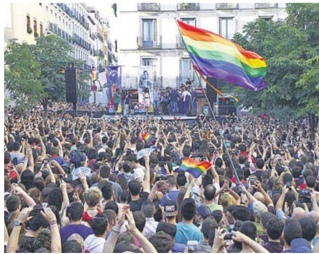
La plaza de Chueca (Madrid), durante las fiestas del Orgullo.