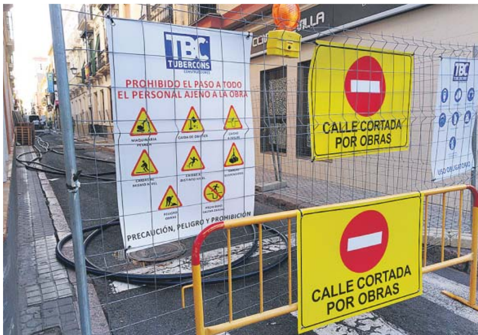
Una valla impide el acceso a la calle San Vicente, en obras desde hace unos días. B.R.

En cuanto a la parte más visible de los trabajos, el Consistorio va a renovar más de un kilómetro de tuberías de abastecimiento y saneamiento para mejorar el servicio, todo ello a través de una inversión de 1,5 millones de euros. «Se trata de importantes y necesarias inversiones para el distrito, en calles que requerían una intervención tanto