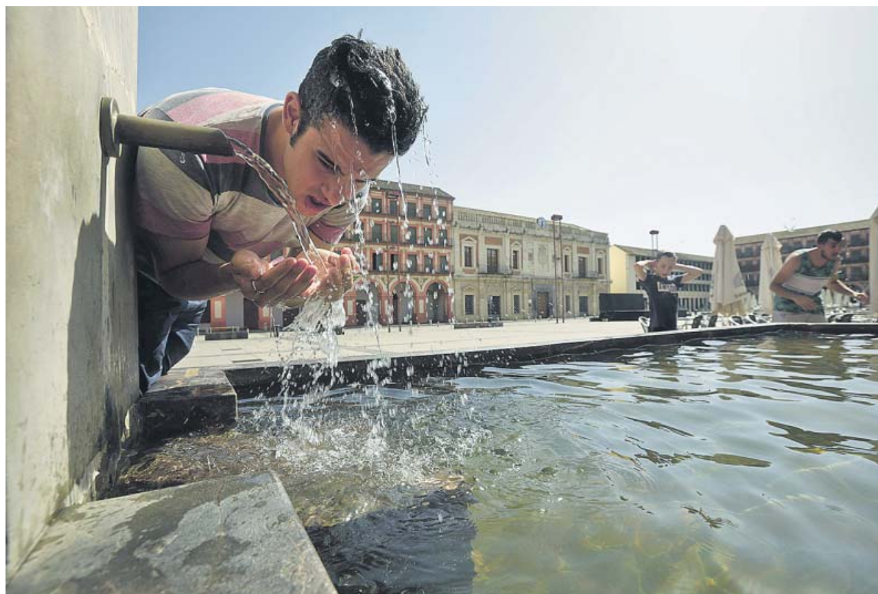
Un joven se refresca en una fuente de Córdoba, durante la pasada ola de calor.

La investigación de la Aemet ha puesto de relieve que las masas de aire de los veranos de ahora –y de los que vendrán– son notablemente más cálidas que las de antes. Más concretamente, 1,3°C de media. Si se observa la naturaleza de estos episodios entre siglos las diferencias saltan rápidamente a la vista. Desde 1975 hasta el final del siglo pasado, la Aemet registró 27 olas de calor, frente a las 31 (incluida esta última) que se han producido en este. Además, los dos únicos episodios que superaron los diez días de duración se dieron después del año 2000 y las anomalías térmicas superiores a los tres grados duplicaron en el siglo xxi a las del siglo xx. Las olas más mortíferas, el año con más episodios y la que afectó a más provincias simultáneamente también ocurrieron en este siglo.