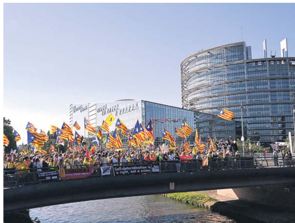
Manifestación independentista, ayer, frente al Parlamento Europeo de Estrasburgo.

Teléfono gratuito de atención a las víctimas de violencia machista