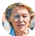
Ursula van der Leyen

Socialdemócrata. El español es ministro de Exteriores en funciones y encabezó la lista europea del PSOE el 26-M. Presidió el Parlamento Europeo entre 2004 y 2007.