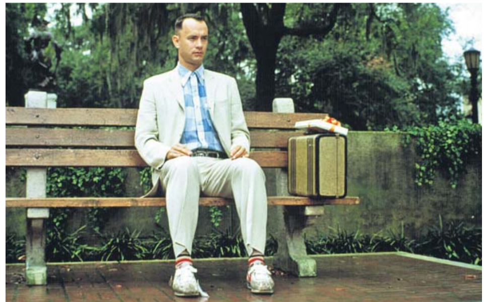
Forrest Gump (Tom Hanks) sentado en un banco con su caja de bombones.

Forrest Gump es una historia ejemplar de superación personal, pero también de la extraordinaria relación del protagonista con su madre (Sally Field) o con el amor de su vida, Jenny (Robin Wright). A todo ello hay