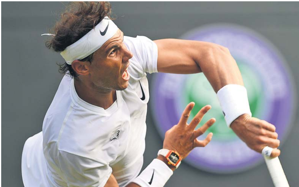
Nadal, durante un momento del partido de ayer ante Sugita.