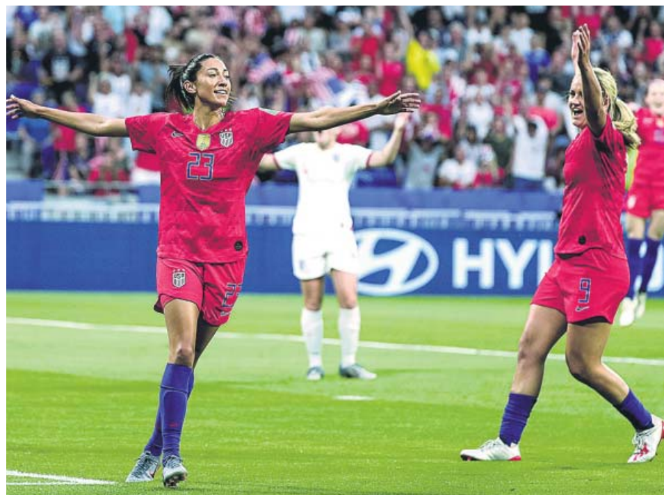
Las jugadoras de Estados Unidos celebran uno de sus goles.