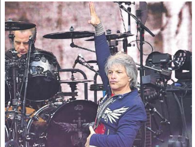
Bon Jovi durante uno de sus conciertos recientes.