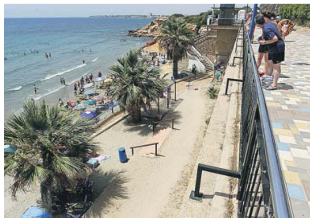
Paseo marítimo de Orihuela, donde se produjo el accidente.

La aseguradora Línea Directa presentó ayer sus nuevos servicios digitales para mejorar la experiencia de sus clientes. A partir de ahora ya es posible obtener un presupuesto del seguro simplemente fotografiando con el móvil el carné de conducir y la matrícula del coche, o recibir una indemnización por la rotura de una vitrocerámica con solo enfocarla con el móvil y gracias al vídeo peritaje, así como gestionar y cerrar una cita con el médico que más convenga al cliente utilizando un asistente de voz. Además, a la hora de renovar el seguro, los clientes podrán recibir descuentos personalizados.