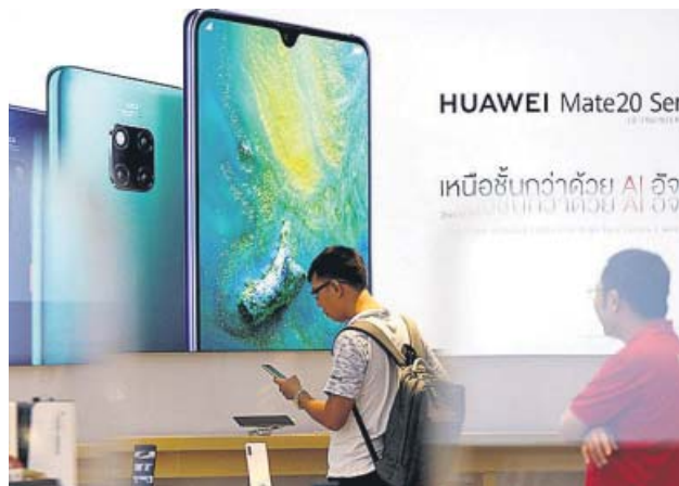
Un cliente revisa un móvil Huawei en una tienda de la marca.

El veto de Trump, que parece seguir en vigor, ha hecho que la compañía pierda un 50% de cuota en España, lo que ha beneficiado a su competencia directa