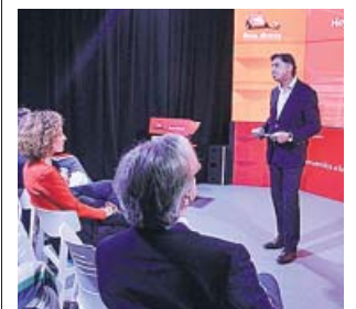
Acto de Línea Directa. J. PARÍS

mento de nubosidad con chubascos y tormentas. Las temperaturas aumentarán en el este y sur de la península, disminuirán en Galicia y el Cantábrico y se mantendrán en el resto de regiones.