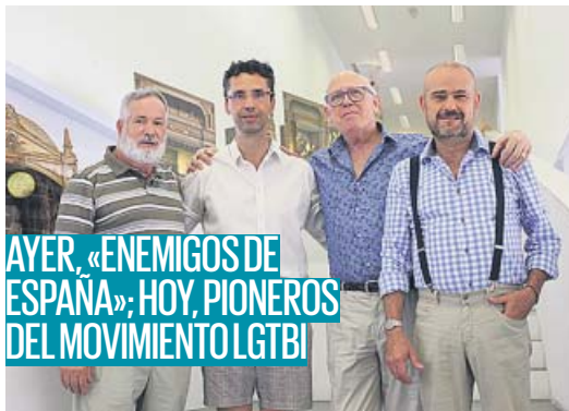
AYER, «ENEMIGOS DE ESPAÑA»; HOY, PIONEROS DEL MOVIMIENTO LGTBI

El veto impuesto por Donald Trump a la multinacional china ha provocado una disminución en su cuota de mercado que ronda el 50%, a la vez que ha provocado el efecto contrario en su competencia. Las ventas de Xiaomi y Samsung en las últimas semanas han aumentado en el mismo porcentaje, un 50%. PÁGINA 11