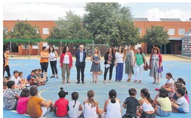
Visita al CEIP Juan Sebastián El Cano, ayer.