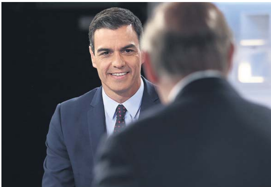
El presidente del Gobierno en funciones, Pedro Sánchez, durante la entrevista con Piqueras.