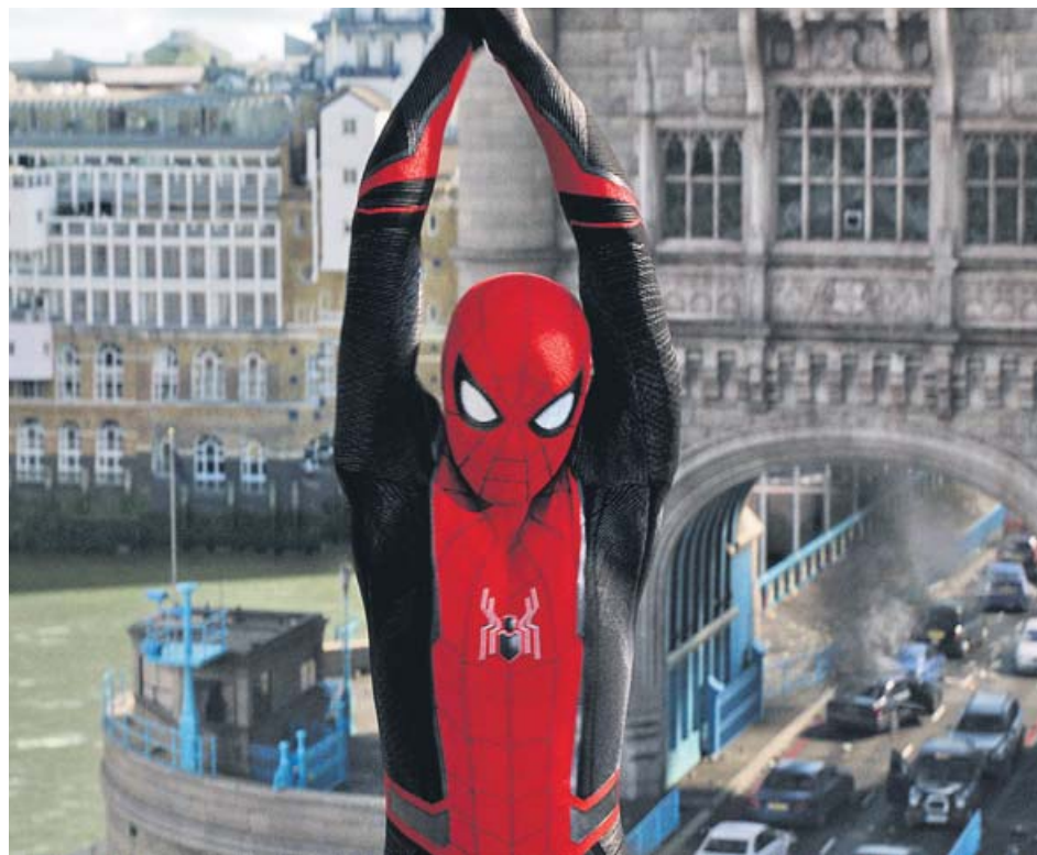
Spider-Man (Tom Holland) cambia Queens por Europa en su segundo filme.

Spider-Man: Lejos de casa no pasa página de forma abrupta, sino que se toma el tiempo necesario para dejarnos sentir añoranza del universo marvelita que fue y no volverá a ser,