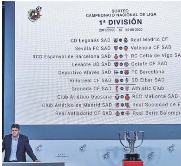
Sorteo del calendario con la copa para el campeón.

Los derbis sevillanos prometen ser, un año más, apasionantes. Los nuevos proyectos de Julen Lopetegui y Rubi se verán las caras por primera vez en la jornada 13, en el Be-