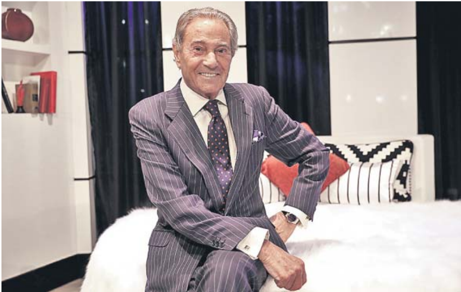
El actor Arturo Fernández en la obra de teatro Alta seducción , en el año 2018.