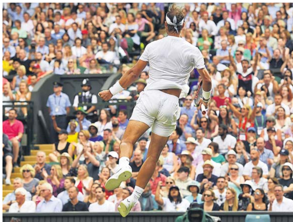
Nadal celebra un punto durante el partido de ayer.

Rafa comenzó el encuentro durante todo el primer set y la bola siempre llegaba antes que Kyrgios. Decían las malas lenguas que algo tendría que ver el entrenamiento nocturno de Nick en la noche anterior: una cerveza tras otra has-