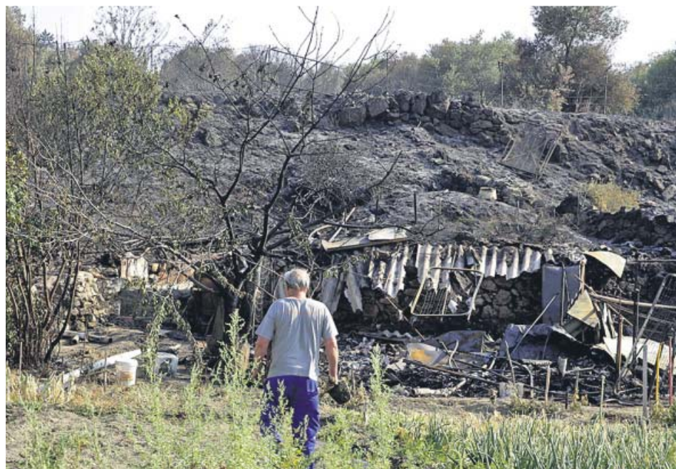
El incendio en Cadalso de los Vidrios (Madrid) ha sido el peor en la Comunidad en el siglo XXI.