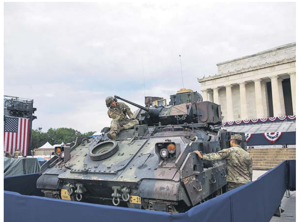
Los tanques preparados en Washington para celebrar el Día de la Independencia.

En España, este fenómeno tiene su particularidad cultural en los encierros. Ya en 2014 se hizo célebre una fotografía durante las carreras de San Fermín que mostraba a un joven tomándose una foto mientras corría por las calles de Pamplona delante de los toros. De hecho, el año pasado un hombre fue arrollado por un toro mientras sacaba su móvil para fotografiarse. El Ayuntamiento de Pamplona prohíbe explícitamente estas prácticas bajo severas sanciones económicas. ●