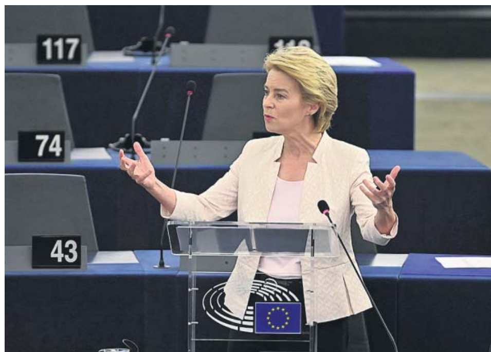
Ursula von der Leyen se dirige al Parlamento Europeo antes de la votación de ayer.

Por su parte, el grupo socialista otorgó cerca de un centenar de votos de su formación, mientras que un puñado de delegaciones nacionales votaron en contra, como la alemana, la austríaca o la holandesa. ●