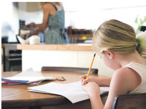
Una niña realizando sus deberes escolares en casa.

Puedes encontrar más noticias y reportajes sobre los deberes escolares en 20minutos.es