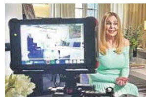
SOCIEDAD Lazos de sangre LA 1. 22.45 H