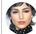
ÚRSULA CORBERÓ La actriz, sobre el boom de La casa de papel

«Sabía que iba a necesitar un tiempo para procesarlo. Y el momento de superarlo llega. Ahora estamos un poco mejor»