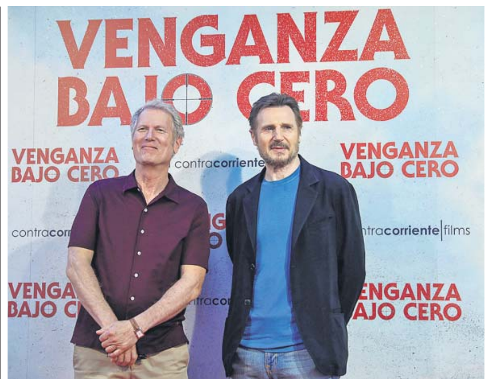
El director Hans Peter Moland (izda.) y Liam Neeson, ayer, en Madrid.

●●● El Rastro de Madrid fue el lugar donde Ceesepe conoció al fotógrafo Alberto García-Alix y donde se gestó en 1976 la Cascorro Factory, sello para vender sus publicaciones artesanales, que fotocopiaban y traducían del underground estadounidense. También auspiciaría el nacimiento de Vicios Modernos , mítico fanzine creado a partir de fotografías de Alix que da título a la exposición y en el que colaboraron otros amigos como El Hortelano y Ouka Lele.