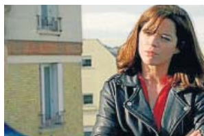
'Profilage' A3S. 22.30 H

La alianza. Hayley organiza un día de chicas para la hija adolescente de Rainer Shine, pero la jornada resulta angustiosa. Mientras, Gloria, Phil y Cam forman una alianza para asegurarse de que sus errores quedan silenciados para sus parejas.