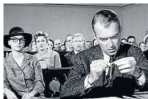
'Anatomía de un asesinato' LA 2. 22.00 H

Frederick Manion (Ben Gazzara), un militar, asesina fríamente al presunto violador de su mujer (Lee Remick). Ella contrata al abogado Paul Biegler (James Stewart). En el juicio se reflejan todo tipo de emociones y pasiones, desde los celos a la rabia.