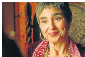
Señoras del (h)ampa TELECINCO. 22.40 H

50.000 euros: esta es la cifra que Mayte, Virginia y Amparo necesitan reunir para pagar el rescate de Lourdes, que permanece secuestrada por la banda de Carmona. Acuciadas por la situación tienen que tomar medidas a la desesperada.