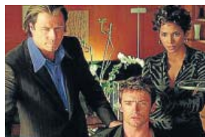
'Operación Swordfish' LA SEXTA. 22.30 H

Frederick Manion (Ben Gazzara), un militar, asesina fríamente al presunto violador de su mujer (Lee Remick). Ella contrata al abogado Paul Biegler (James Stewart). En el juicio se reflejan todo tipo de emociones y pasiones, desde los celos a la rabia.