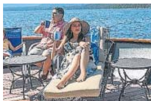
Modern Family NEOX. 22.30 H

50.000 euros: esta es la cifra que Mayte, Virginia y Amparo necesitan reunir para pagar el rescate de Lourdes, que permanece secuestrada por la banda de Carmona. Acuciadas por la situación tienen que tomar medidas a la desesperada.