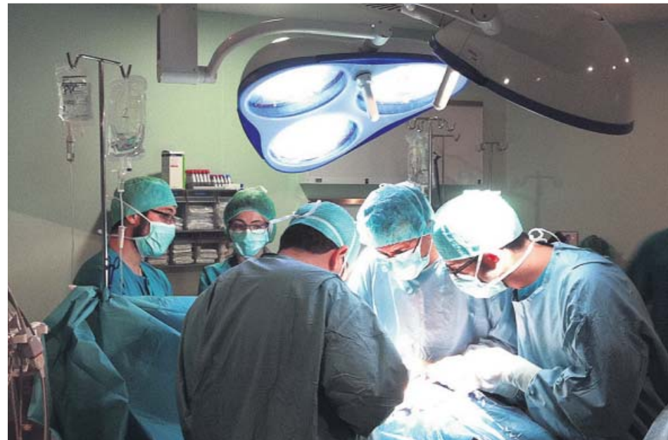
Un grupo de cirujanos realizan una intervención en un centro público andaluz.

CIFRAS. Según los datos publicados ayer mismo en la web del Servicio Andaluz de Salud (SAS), en la provincia de Sevilla hay un total de 39.812 pacientes esperando una intervención, por los 39.279 del pasado diciembre, lo que supone 533 personas más, es decir, un 1,3% de incremento. De estos, 4.881 son usuarios fuera de plazo o con demoras de más de 365 días, por los 6.175 que