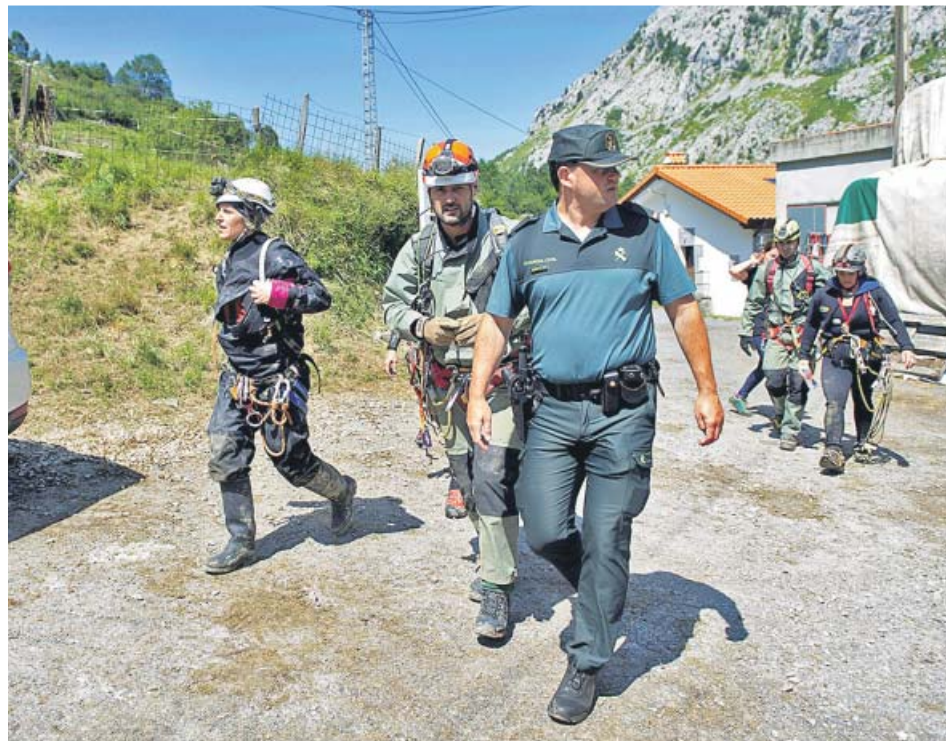
Los servicios de rescate junto a las tres espeleólogas al salir de la cueva, el lunes.

de espeleología propio, tenemos un contrato con Esocan. En él se acuerda que ellos tengan un servicio cualificado para intervenir en caso de rescate, estar localizados para realizar esos rescates y además man-