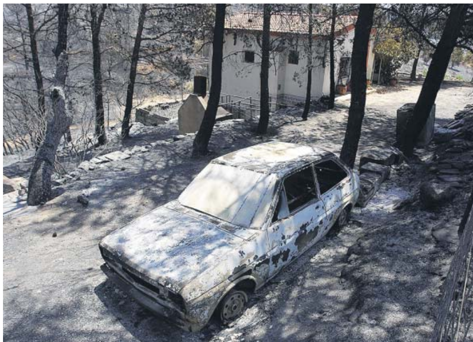
Un coche calcinado tras el paso del incendio por la localidad de Beneixama.