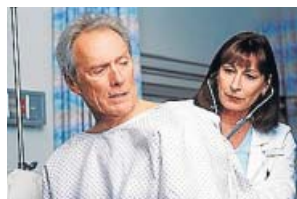
'Deuda de sangre' MEGA. 22.00 H