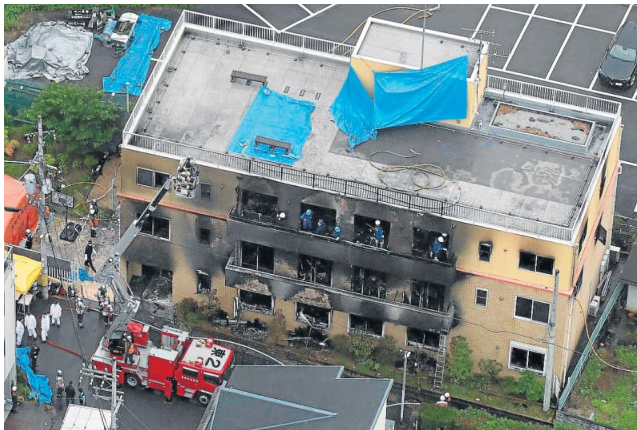
En la imagen, los bomberos buscan posibles víctimas del incendio provocado en el Kyoto Animation.