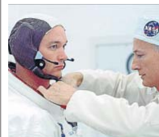
El legado de la NASA para la eternidad. A CONTRACORRIENTE

La desbordante emoción a la que nos traslada este relato conmemorativo del 50.º aniversario de la llegada del hombre a la Luna nos llega a través de un montaje irrepro-