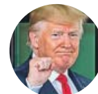
DONALD TRUMP Sobre las consignas racistas en su mitin: «Envíale de vuelta [a una congresista musulmana]», gritaban.

«No me gustó escuchar ese cántico, no estoy de acuerdo. Empecé a hablar pronto para detenerlo. Creo que lo hice»