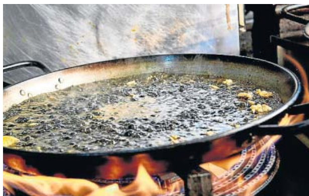
El secreto de la paella es preparar un buen fondo y dedicarle tiempo.