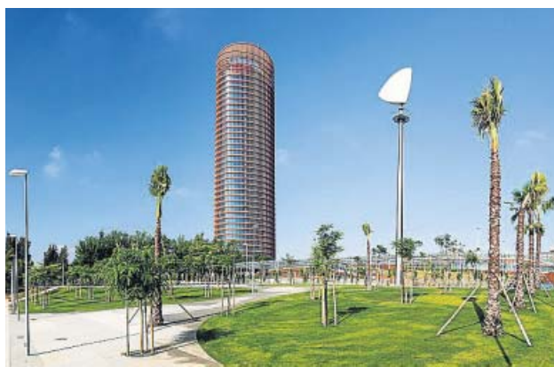
Vista del parque Magallanes y la Torre Sevilla. PUERTO TRIANA

El entorno de Torre Sevilla contará con una nueva pérgola que unirá el puente del Cristo de la Expiración con el rascacielos sevillano, dotando de nuevas zonas de sombreado el principal acceso peatonal y ciclista desde el centro de la ciudad. Esta nueva pérgola, de 106 metros de longitud por 6 metros de anchura, estará situada junto al parque Magallanes, el nuevo entorno natural con 40.000 metros cuadrados de zonas verdes a orillas del río Guadalquivir, y en paralelo al carril bici.