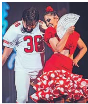
Un momento del espectáculo en Granada.