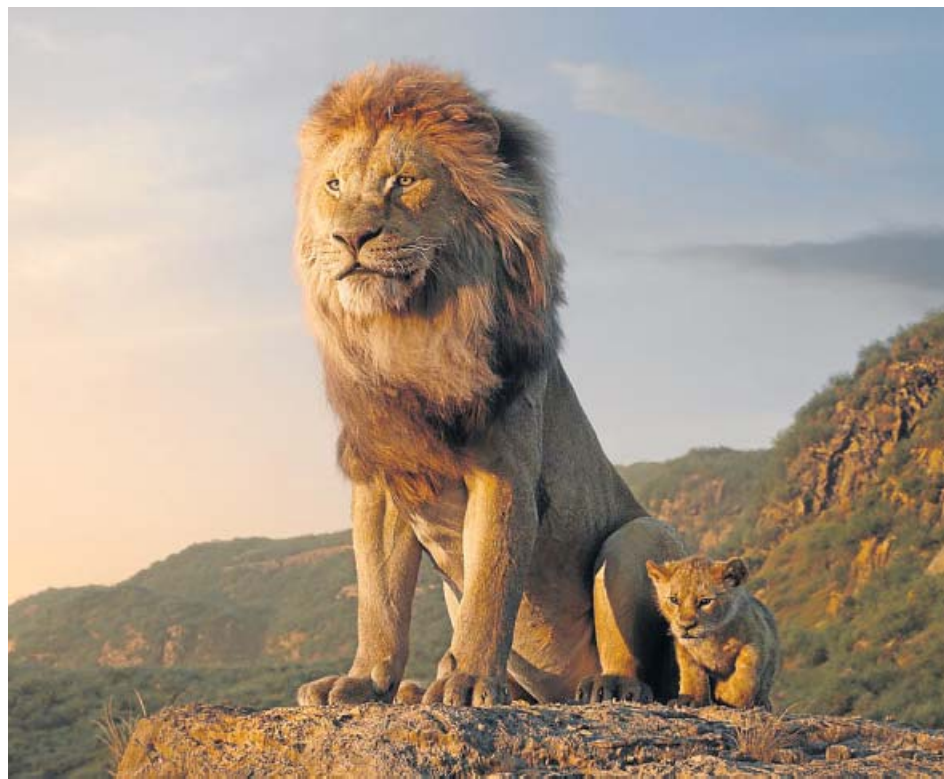
Mufasa y Simba, más hiperrealistas que nunca para Jon Favreau.

Esta nueva versión del clásico animado de tu infancia desecha vueltas de tuerca ( Malefica ) o subtramas que tratan de actualizar el filme original ( Aladdin , La bella y la bestia ). En su lugar, opta por re-