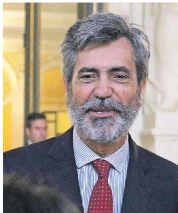
Imagen de archivo del presidente del CGPJ, Carlos Lesmes.

Un portavoz del Departamento de Justicia negó ayer rotundamente a la agencia Efe que la Conselleria haya intentado acceder a información reservada y precisó que el mensaje aparecido en el ordenador de los juzgados se ha enviado a todos los trabajadores de la Generalitat, en el marco de una iniciativa que pretende recordarles que los equipos informáticos son para uso estrictamente laboral, no para fines personales.