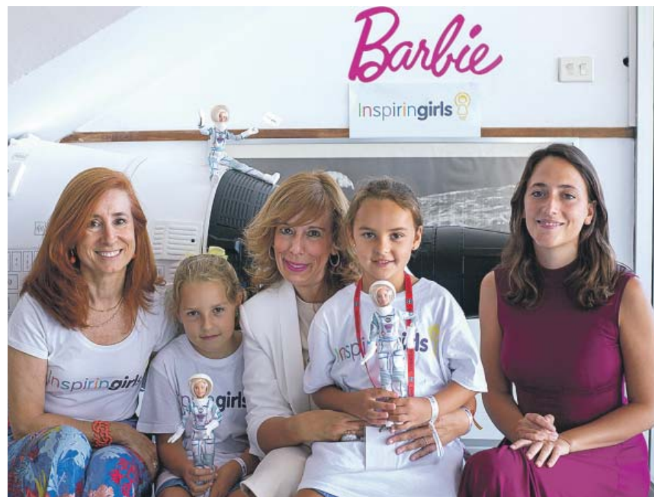
Las dos pequeñas junto a la Barbie astronauta en el Centro Espacial Maspalomas.

20M.ES/ACTUALIDAD Política, economía, sociedad... consulta toda la actualidad diaria en la web de 20minutos.es .