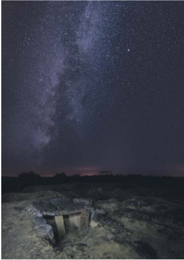
Ruina Porcuna, Jaén.