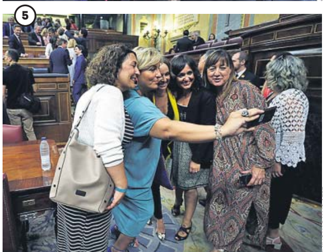
Barones del PSOE con Sánchez Presidentes autonómicos como Guillermo Fernández Vara o Ximo Puig respaldaron a Sánchez durante la sesión. También estuvo presente la expresidenta andaluza Susana Díaz.