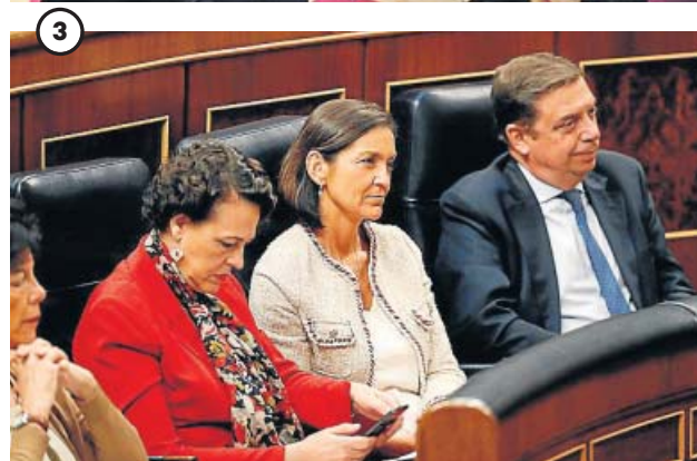
Todos los ministros presentes El Gobierno en funciones estuvo presente al completo en el Congreso de los Diputados. Ocuparon sus escaños para escuchar el debate y secundaron el mensaje de Pedro Sánchez.