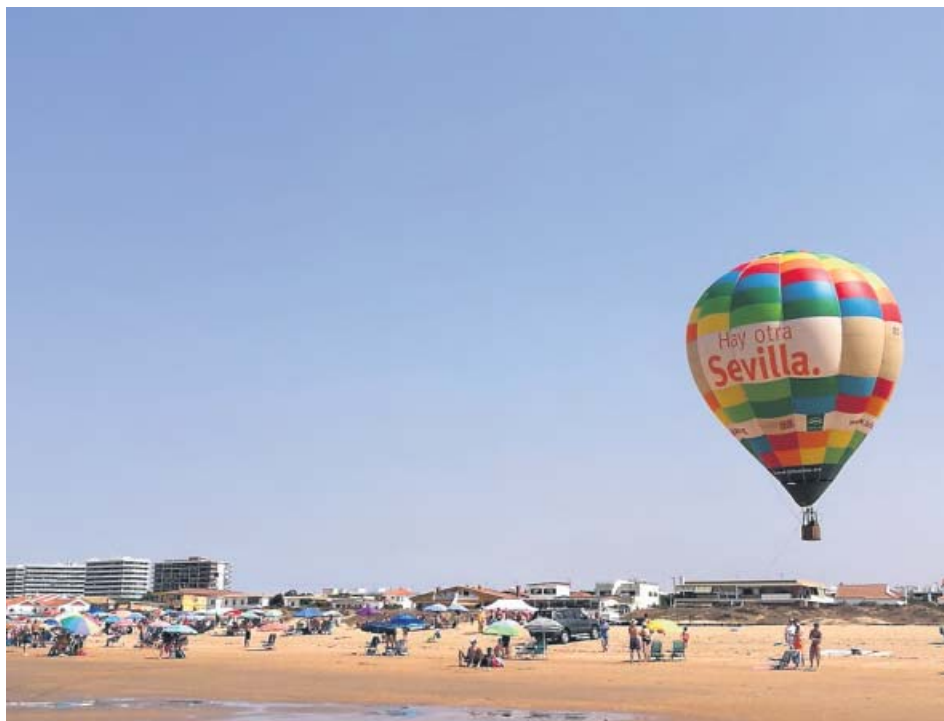
Globo de la Diputación de Sevilla en la playa de Punta Umbría el pasado domingo.

El globo aerostático Hay otra Sevilla se dejó ver el pasado fin de semana por los cielos de Punta Umbría, en Huelva, como parte de la campaña veraniega de la Diputación Hay otra Sevilla... Descúbrela, mientras que el próximo sábado estará en Rota y el domingo, en Chipiona (Cádiz). Además, el globo ha participado en el II Festival Accesible de Globos Aerostáticos de Segovia, una convocatoria internacional con participantes de República Checa, Austria y Marruecos. ● R. S.