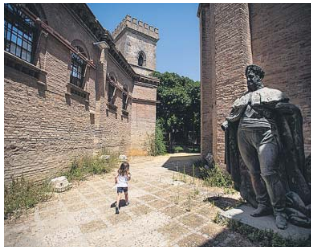
Entorno de la Torre de Don Fadrique. FERNANDO RUSO

Los trabajos cuentan con un presupuesto de un millón de euros, que será cofinanciado en un 45% por el Gobierno central, a través del programa 1,5% Cultural , y el resto por la Gerencia de Urbanismo. Esta inversión se suma a los más de ocho millones de euros que