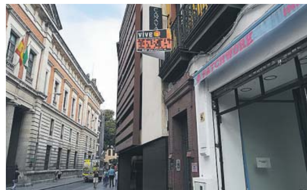
Cartel anunciando el alquiler de una vivienda en el centro. B. R.

Otros dos datos reveladores del informe son que el pensamiento de que alquilar es «tirar el dinero» retoma fuerza, pues consideran que «compensa más pagar una hipoteca» que un arrendamiento vuelve a ganar terreno entre los particulares. Aunque estos, en casi un 50% de los casos, también se muestran convencidos de que el mercado en España está próximo a sufrir una nueva burbuja inmobiliaria. ●