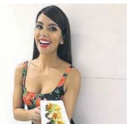
Pedroche posa con su plato.

La presentadora sorprendió en Instagram presumiendo de dotes culinarias: «Os juro que lo he hecho yo sola, ahora ya llevo la gastronomía dentro de mí y hasta sueño con recetas». El plato (cogollos de lechuga, langostinos, huevas de trucha, mayonesa de aguacates, cebollino y lima) ha desatado los rumores sobre si veremos a Cristina Pedroche tras los fogones de forma profesional. Además, lanzó una encuesta en Instagram preguntando a sus seguidores si acudirían a su restaurante si ella fuera la cocinera.