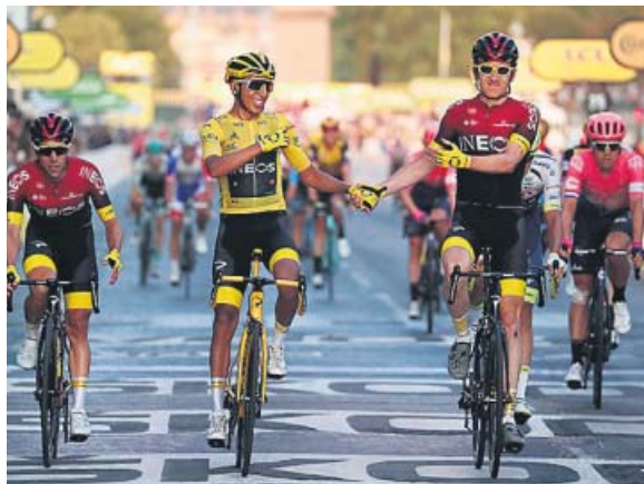
Bernal cruza la meta de París de la mano de Thomas.