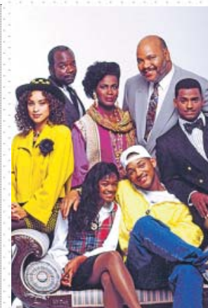
La familia protagonista de El príncipe de Bel-Air.

Si bien Smith se reveló aquí como un actor muy solvente (y no solo cómico), el show no sería lo mismo sin los secundarios, empezando por James Avery como el tío Phil. Asimismo, su humor amable da envoltorio