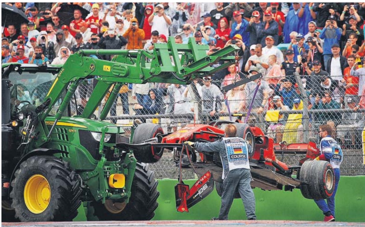
Una grúa retira el Ferrari de Charles Leclerc, uno de los muchos accidentes que hubo ayer en Hockenheim.

Tampoco fue el día de Mercedes, que celebraba su 125 aniversario en competiciones de motor, pero vivió su peor fin de semana en más de un año. Lewis Hamilton, primero hasta que empezó a complicarse la carrera, acabó undécimo y Valtteri Bottas, empujado contra el muro. «Ahora mismo me siento horrible, tengo ganas de irme a casa», fue el balance del líder del Mundial, que subió al puesto 9 gracias a una sanción por carrera a los Alfa Romeo. ●