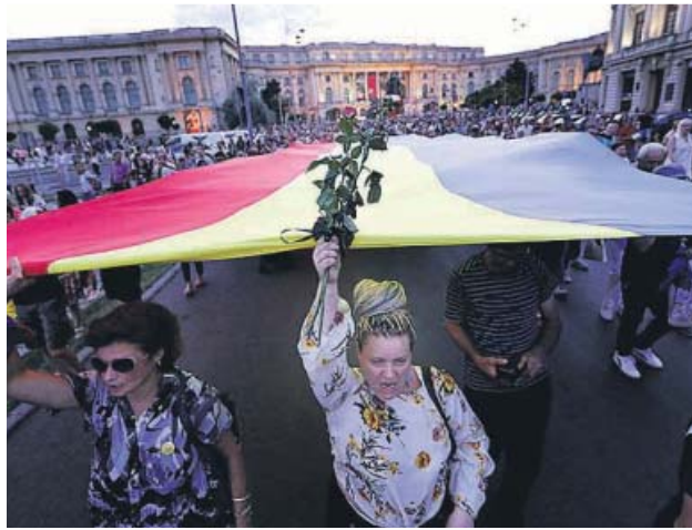
Protestas en las calles de Bucarest contra la Policía del país.