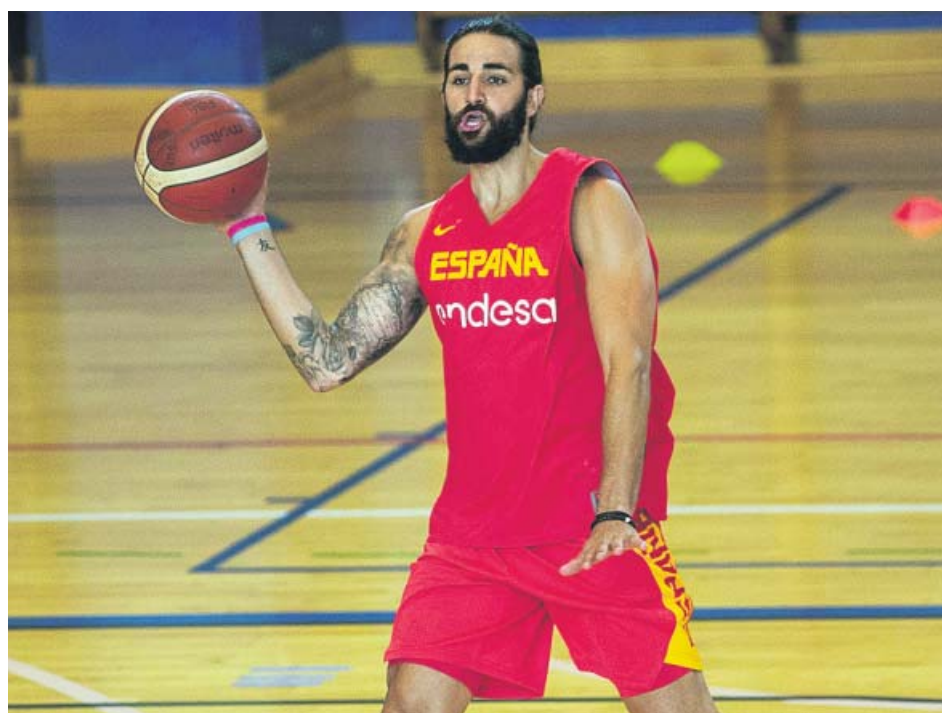
Ricky Rubio en el entrenamiento de ayer de la selección española de baloncesto.

Marc Gasol, Willy y Juancho Hernangómez y Ricky Rubio ya están al 100% a las órdenes de Sergio Scariolo tras haber superado las restricciones impuestas por la NBA para estos primeros días de concentración con la selección española de cara al Mundial de basket. «Tenemos que poner el objetivo muy alto, conseguir medallas», afirmó ayer Ricky, nuevo base de los Suns. «No tenemos que pensar en los que no están, somos los que estamos aquí», añadió sobre las importantes bajas. ●