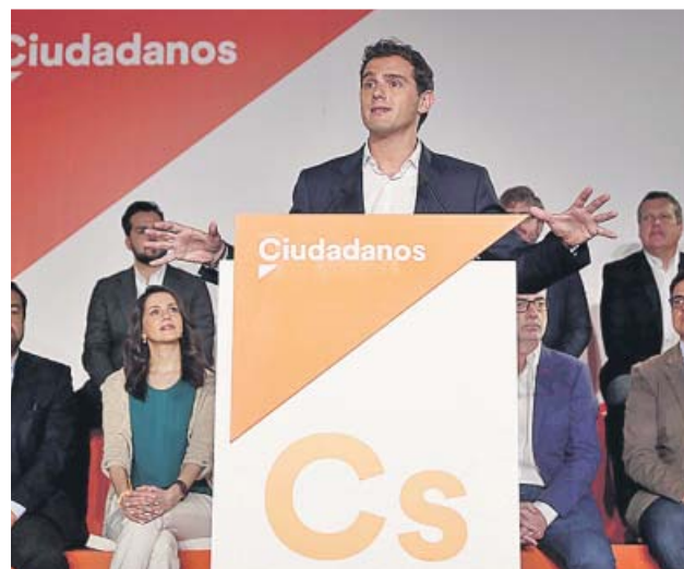
Albert Rivera, ayer durante su discurso en el Consejo General de Cs.