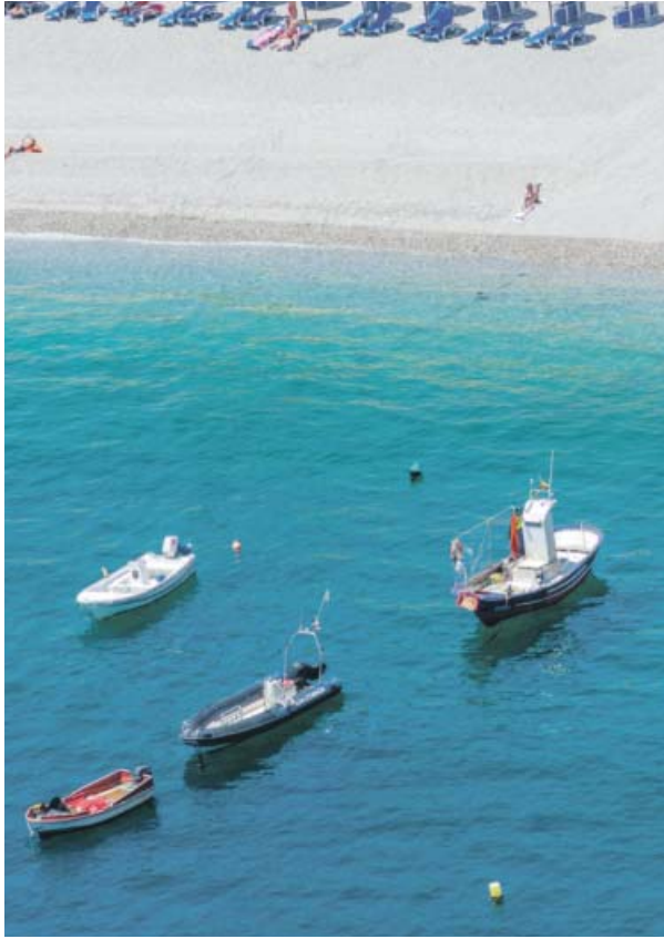
Playa de Calahonda, Granada.