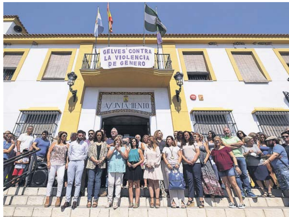
Concentración contra la violencia machista en el Ayuntamiento de Gelves.

Sin entrar en detalles sobre esta reestructuración, el presidente de la Junta y líder del PP-A, Juanma Moreno, demandó ayer al PSOE-A y a la propia Susana Díaz que se «centre» y salga de la «crisis de liderazgo» para volver a ser «ese partido serio, coherente, que creía, entendía y era capaz de acordar políticas de Estado». Por su parte, desde Podemos Andalucía avisaron de que «cambiarán las caras y la retórica, pero la política es la misma». ●