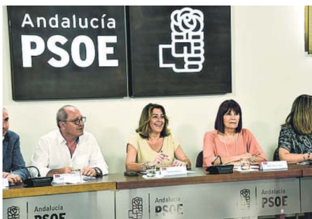
Reunión de la Comisión Ejecutiva del PSOE-A, ayer. PSOE-A

La víctima se encuentra ingresada en la Unidad de Cuidados Intensivos (UCI) del Hospital Universitario Virgen del Rocío de Sevilla. El agresor, detenido, está en prisión desde el sábado. ● R. A.