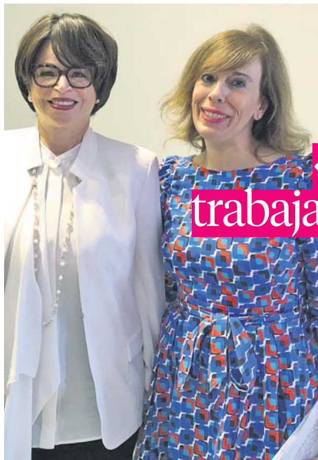
Valerie Jarrett (izda.), con la autora de la entrevista.

Valerie Jarrett, asesora de Obama en la Casa Blanca, habló con Inspiring Girls y 20 minutos en Nueva York, durante el Ellevest Network