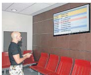
Un familiar busca a un paciente en el sistema. SALUD

El Hospital Universitario Virgen del Rocío ha implantado un sistema digital que permite conocer en tiempo real la localización del paciente quirúrgico. Se trata de un dispositivo tag que se integra en las pulseras de identificación que se colocan a todos los pacientes intervenidos quirúrgicamente. La tecnología detecta el lugar en que se en-