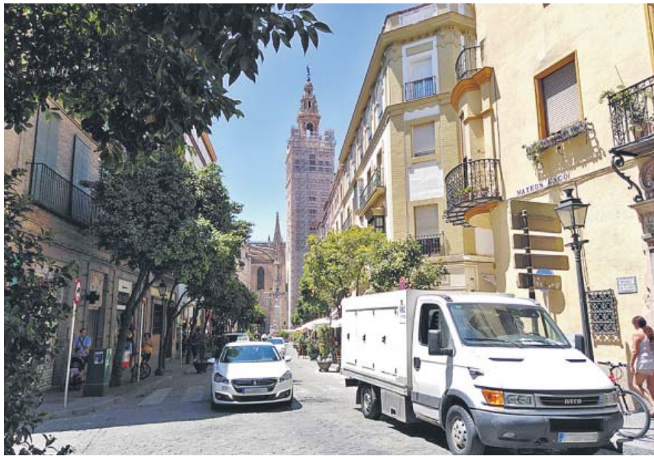
Varios vehículos circulan por la calle Mateos Gago, una de las arterias del centro.