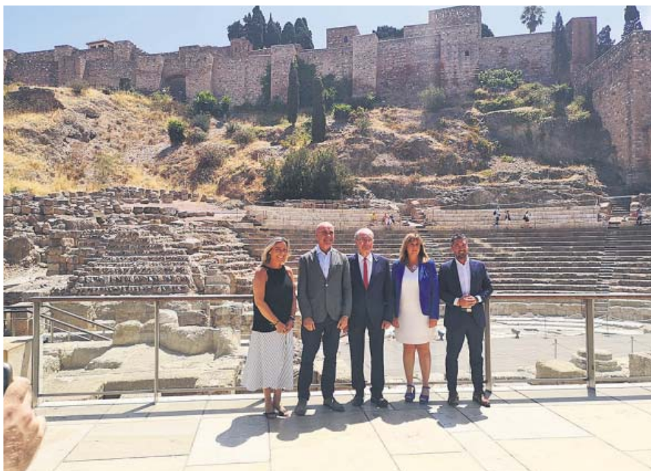
Reunión celebrada en Málaga donde se ha consolidado la alianza turística. AYTO. SEVILLA

Los responsables de Turismo de las ciudades que componen Andalusian Soul –la alianza turística de Córdoba, Granada, Málaga y Sevilla para la promoción en mercados de media y larga distancia– ratificaron ayer su continuidad. Andalusian Soul registró, durante el primer semestre del año, un crecimiento del 9,38% en pernoctaciones procedentes de sus mercados estratégicos: China, Corea del Sur, Japón, Canadá, EE UU, Argentina, Brasil, México y Rusia. ● R. A.