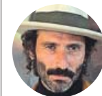
LEIVA El cantante, de gira por Argentina, a la Agencia EFE

«De un disco a otro siempre pienso que la gente se va a aburrir de mí y que ya nadie va a venir a verme»