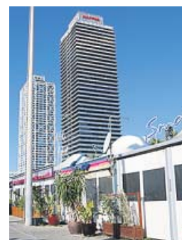
Imagen de la zona de ocio del Port Olímpic.

subieron este tipo de robos en el conjunto de Cataluña comparando los mismos periodos.