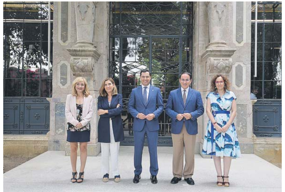
Moreno, en su reunión de ayer con los empresarios y los sindicatos andaluces.

En la misma línea se pronunció Sergio Romero, portavoz de Ciudadanos, quien se mostró optimista al pensar que Vox respaldará el presupuesto. ●