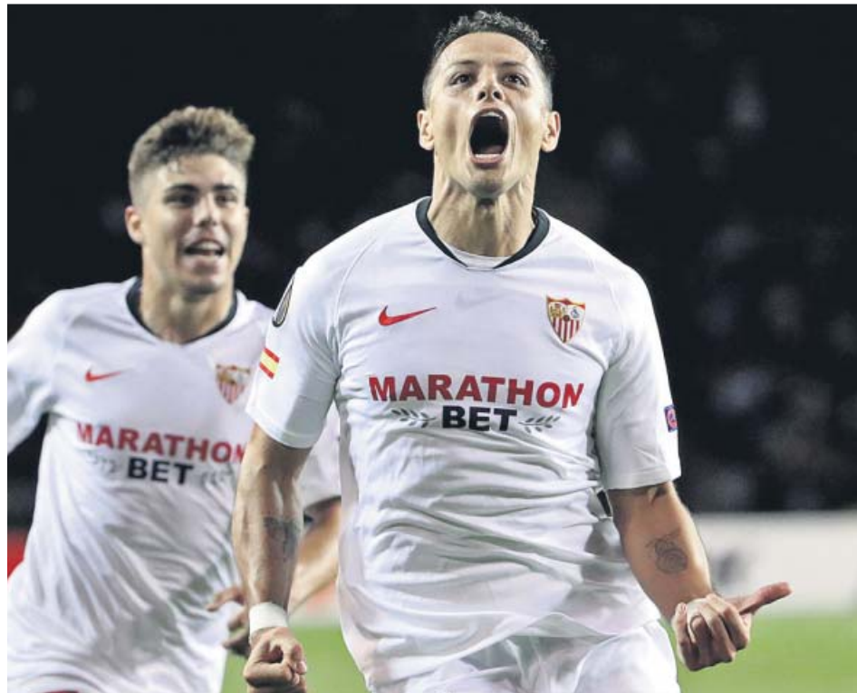
El mexicano Chicharito Hernández celebra eufórico su gol en Azerbaiyán.

El conjunto de Azerbaiyán es bien conocido por la afición española desde que hace dos temporadas logró que el Atlético no le ganara en ninguno de sus dos partidos de Cham-