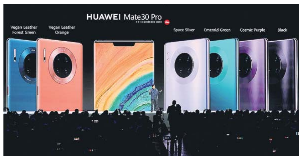
El CEO de Huawei, Richard Yu, ayer durante la presentación en Múnich.

comparables a equipos de grabación profesionales. El Mate 30 está equipado con una triple SuperSensing, que comprende una lente de 40 Mpx, una cámara ultra gran angular de 16 Mpx y un teleobjetivo de 8 Mpx. El Mate 30 Pro, por su parte, tiene un revolucionario sistema