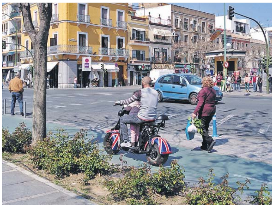
Un hombre circula en un patinete eléctrico por el carril bici de la Macarena. B. R.

Solo podrán circular por Sevilla los vehículos que dispongan de autorización municipal. Para obtenerla, deberán cumplir una serie de requisitos.