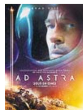
2019. Director James Gray Reparto Brad Pitt, Liv Tyler, Ruth Negga, Tommy Lee Jones

Hasta que, tras burlar a la muerte en un accidente insólito colgando de una antena gigante —píldora de acción que Gray filma con la gracia del caos inevitable,