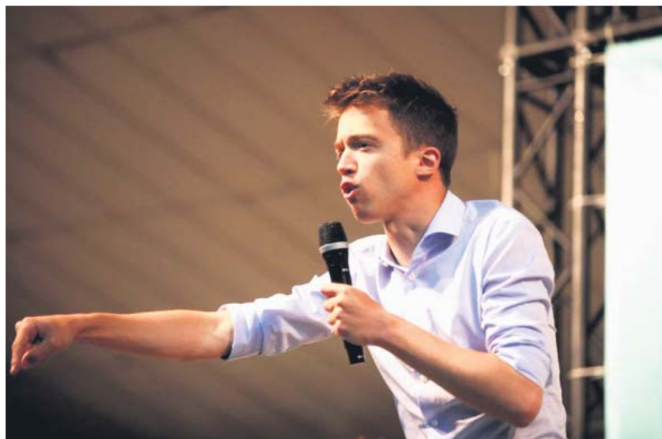
Imagen de archivo del portavoz de Más Madrid en la Asamblea regional, Íñigo Errejón.

LOS COMUNES han reafirmado su alianza con Unidas Podemos y han negado contactos con Errejón