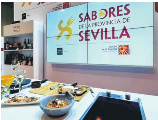
Expositor de la Diputación de Sevilla. ANDALUCÍA SABOR

Por otro lado, este año se han incorporado 17 unidades móviles de mayor tamaño a todos los centros de transfusión sanguínea de Andalucía. R.S.