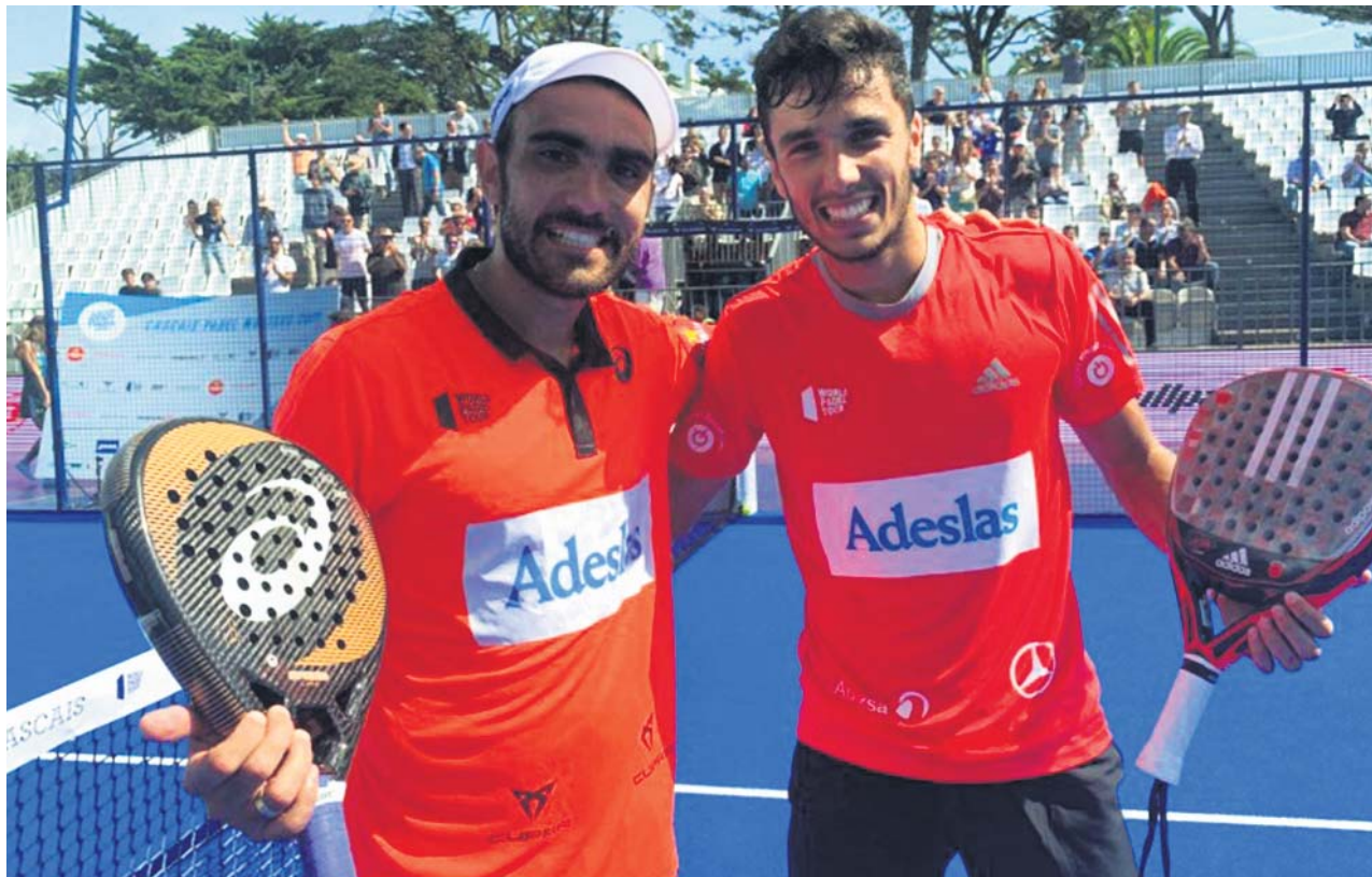
Pablo Lima (izquierda) y Alejandro Galán (derecha) tras su victoria en Cascais.