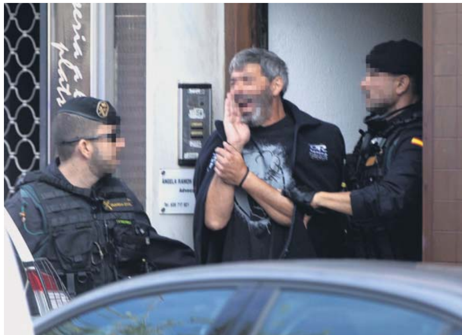
Agentes de la Guardia Civil acompañan a uno de los nueve detenidos, ayer, en Sabadell.

En este sentido, el ministro del Interior, Fernando Grande Marlasca, explicó ayer en un entrevista a RNE que la operación iniciada por orden judicial ha llevado a detenciones ante la «posible comisión de delitos de carácter violento» por parte de miembros de «unas determi-