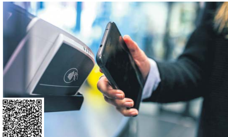
La nueva normativa de pagos PSD2 aumenta la seguridad en los pagos 'contactless'.