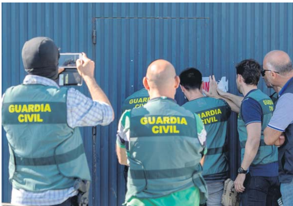
Agentes del Seprona de la Guardia Civil entran en la nave industrial de Magrudis.

R. S. zona20andalucia@20minutos.es / @20m