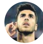
Marco Asensio Rotura ligamento rodilla izquierda