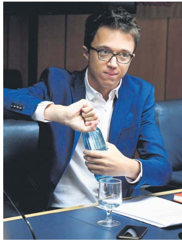
Errejón, ayer, en la Asamblea de Madrid.

En Andalucía, por su parte, Unidas Podemos está vivien-