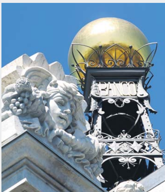
Fachada del Banco de España, en Madrid. JORGE PARÍS