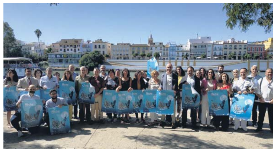
Presentación de la Noche en Blanco, ayer.

A esto se suman la ya anunciada línea 35 de Tussam, con cabecera en el Prado, y la nueva pasarela peatonal y ciclista que conecta con los Bermejales y Heliópolis. ● R.S.