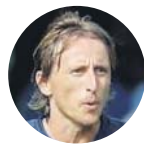
Luka Modric Lesión muscular aductor pierna der.