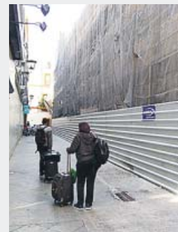
Turistas junto a las obras del hotel de la Magdalena.

personas estaban ocupadas en estos hoteles, lo que supone un crecimiento del 1,46% interanual.