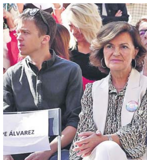
Íñigo Errejón asistió ayer a la clausura del 130 aniversario de UGT, donde coincidió con la vicepresidenta, Carmen Calvo. Pablo Iglesias intervino en la fiesta del PCE.

A pesar de ello, el PP no cedió ayer en su empeño. Casado recurrió al ultimátum al advertir a Rivera de que, sin coalición, el PP competirá con él para salvar con los votos de la ciudadanía «lo que algún