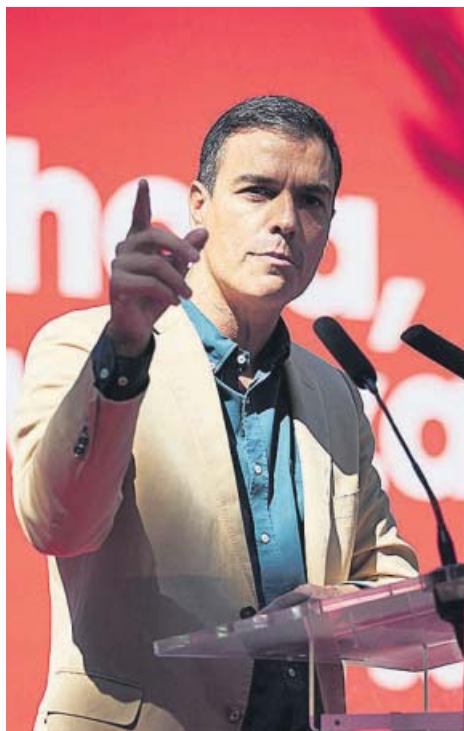
Pedro Sánchez, ayer en la fiesta de la rosa del PSC, en Gavá, y Pablo Casado, en Zaragoza.

En lugar de condenar los planes de los arrestados, el Parlament pidió en una resolución la retirada de la Guardia Civil de Cataluña y Torra se unió a la petición de libertad para los detenidos y se niega a condenar la violencia. Este sábado, Sánchez le instó a «condenar cualquier tipo de violencia que venga del movimiento independentista». Torra niega que haya independentistas violentos y, por tanto se opone a repudiarlos. «No podemos condenar lo que no existe porque somos pacíficos».