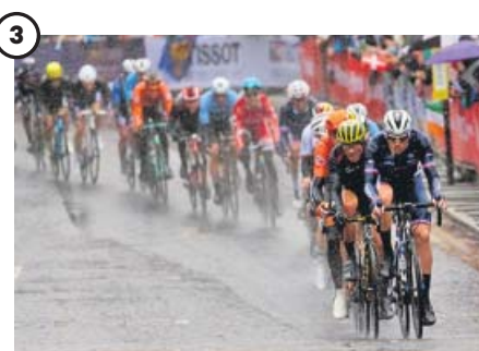
Una carrera bajo la tormenta

Pedersen posa en el podio de Yorkshire con su maillot arcoíris junto a Trentin (izq.), no demasiado satisfecho, y el suizo Stefan Küng, que se colgó la medalla de bronce.