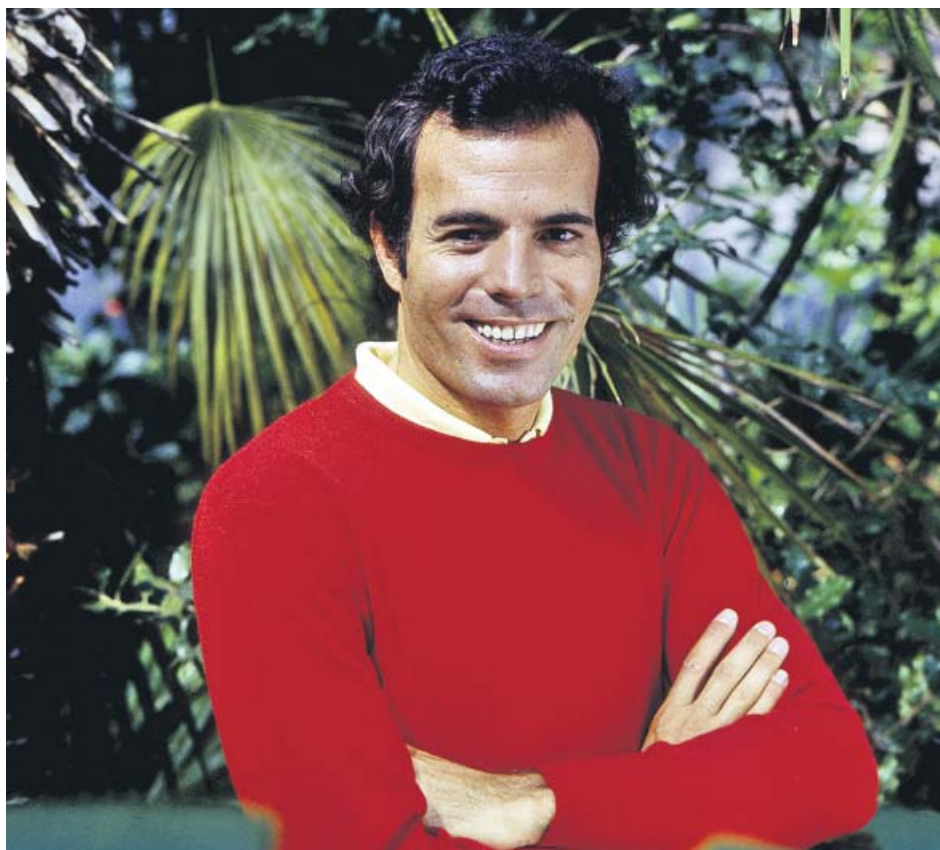
El cantante Julio Iglesias, en una imagen tomada en 1974.