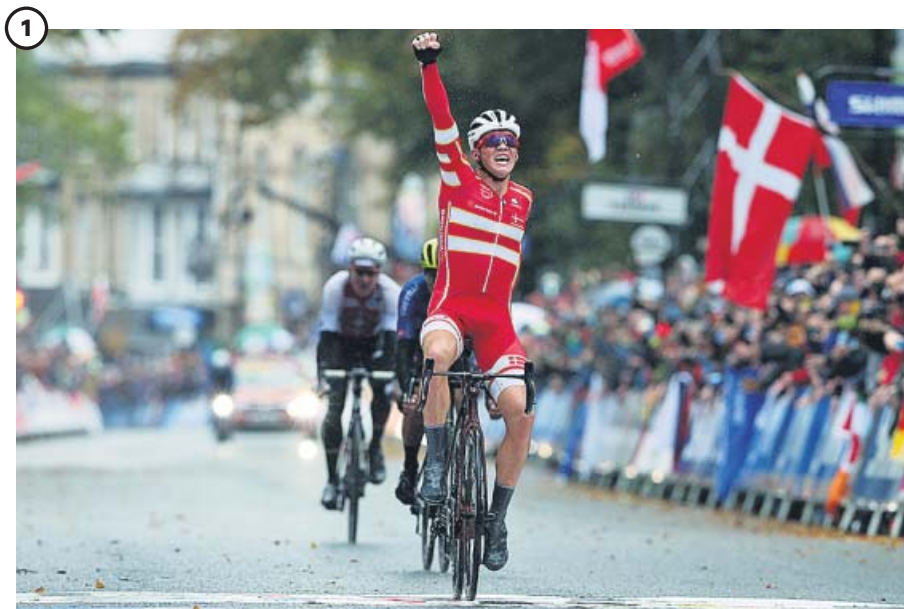
Mads Pedersen sorprende en la meta

El danés Mads Pedersen alza el puño tras cruzar primero la meta de los Mundiales de Yorkshire. El joven ciclista nórdico, de 23 años, sorprendió en el esprint final a Matteo Trentin, que parecía el favorito al oro, pero tuvo que conformarse con la plata.