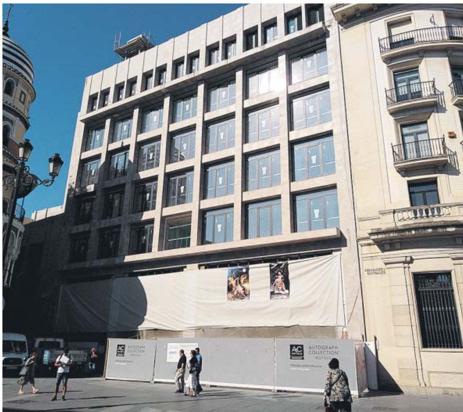
Obras de construcción de un hotel en la Avenida de la Constitución. B. R.