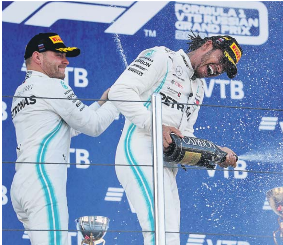
Valtteri Bottas y Lewis Hamilton celebran el doblete de Mercedes en el podio de Sochi.

El equipo italiano arriesgó en busca de un doblete, pero el tiro le salió por la culata y Mercedes lo aprovechó. Sainz fue sexto