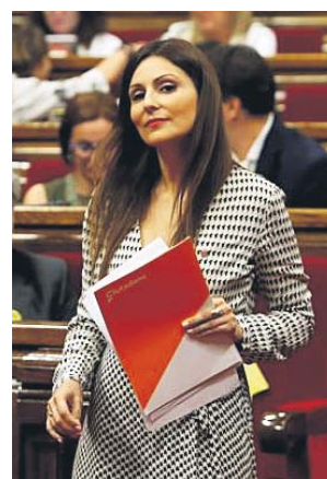
La portavoz de Ciudadanos, Lorena Roldán.

También denunció la resolución que se aprobó en el Parlament con el apoyo de los diputados independentistas mientras que a ella se la ha reprochado por decir que Torra actúa como si fuera el «cabecilla» de los CDR y que es «un peligro público». «Tenemos al presidente de la Generalitat