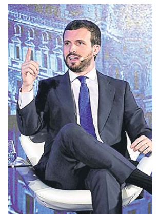
El presidente del PP, Pablo Casado, ayer.

Pablo Casado urgió ayer al Gobierno a tomar decisiones «dentro de la ley» para frenar la deriva adquirida por los independentistas en Cataluña en las últimas semanas. El presidente del PP considera que antes de aplicar el 155, se deben recurrir las decisiones adoptadas por el Parlament, por ejemplo, en contra de la Guardia Civil. En este sentido, recordó que es «un artículo más de la Constitución, que está para cumplirse». Casado aseguró que los primeros