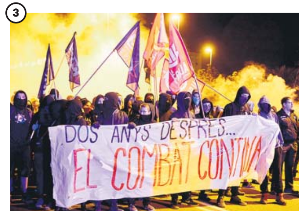
Los CDR, ante el cuartel de la Guardia Civil de Girona

El presidente de la Generalitat, Quim Torra, junto a los altos cargos del Govern, leyó ayer un manifiesto en el Palau de la Generalitat en el que se comprometió a avanzar «sin excusas» hacia la república.