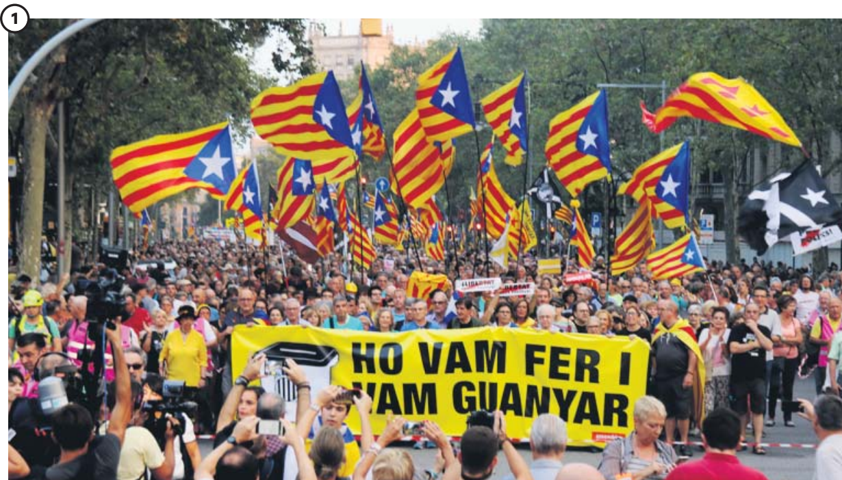
«1-O, ni olvido ni perdón» fue una de las proclamas en las manifestaciones independentistas

18.000 personas, según la Guardia Urbana, se manifestaron ayer en la plaza Catalunya de Barcelona para conmemorar el segundo aniversario del 1-O. El acto, convocado por la ANC, finalizó ante el instituto Jaume Balmes, que fue uno de los escenarios de las cargas policiales hace dos años en los centros de votación del referéndum ilegal.