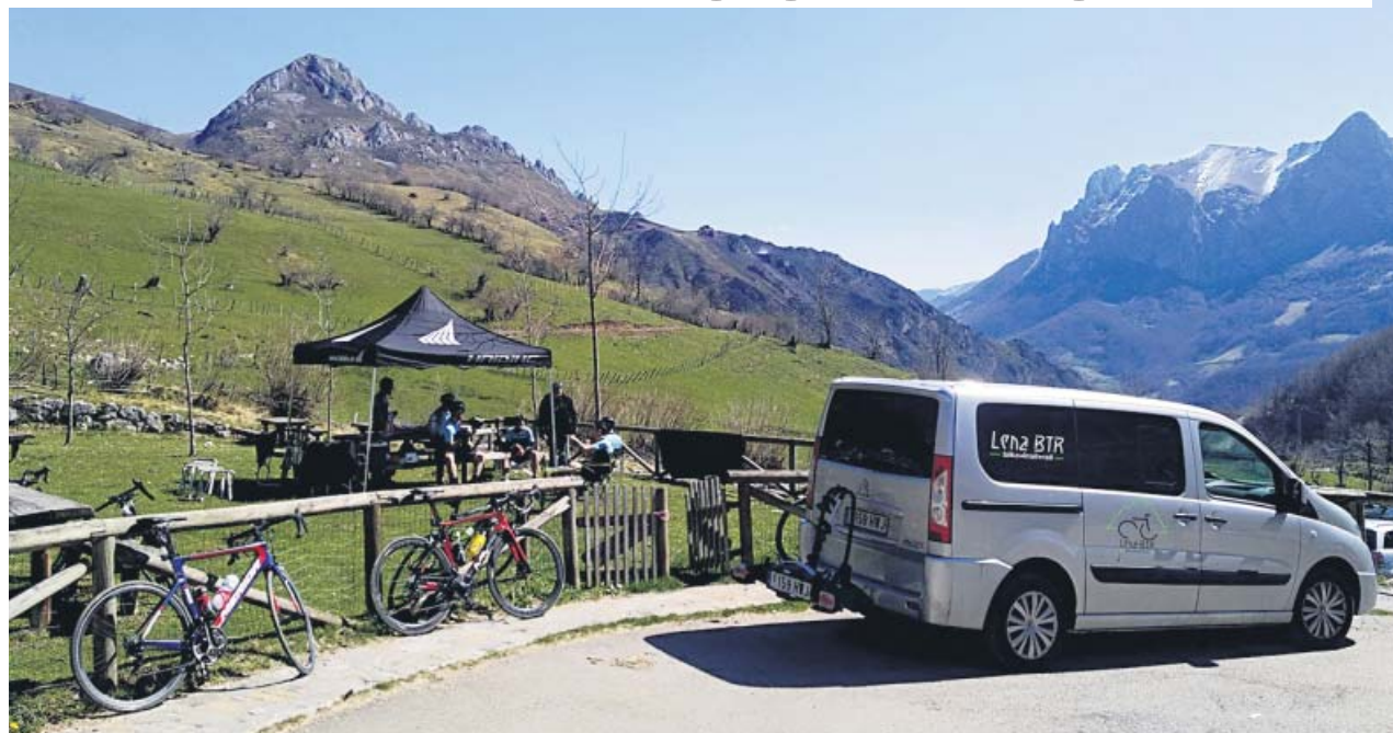
La empresa Lena BTR oferta rutas turísticas en el Concejo de Lena, en Asturias. MANUEL BARROS