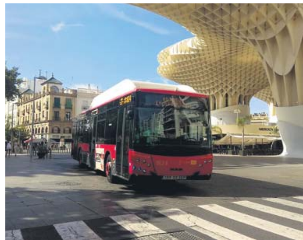
Un autobús circula por la plaza de la Encarnación.

«Es una medida en la que llevamos trabajando durante varios meses y que ponemos en servicio desde esta semana, de forma que cualquier usuario podrá acceder de for-