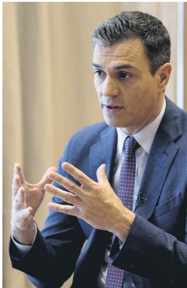
Pedro Sánchez, durante la entrevista, ayer en Huesca.

¿Cómo puede afectar la sentencia del proceso a la precampaña y a los pactos postelectorales?