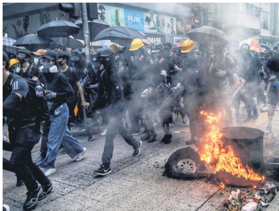
Grupo de manifestantes en Hong Kong durante el Día Nacional Chino.