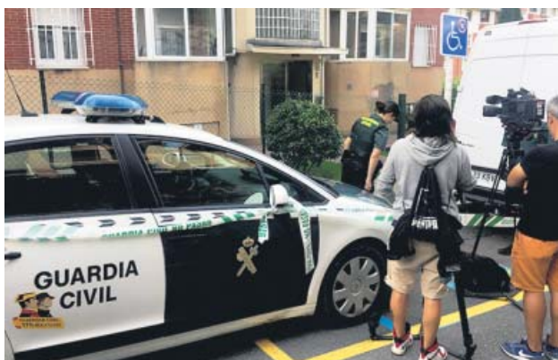
La Guardia Civil, ayer, registrando la vivienda de la detenida.

La causa será instruida por el Juzgado número 3, donde ya se han incoado diligencias previas y se ha ratificado el secreto de las actuaciones acordado previamente por el Juzgado de Primera Instancia e Instrucción número 2. Mientras, los castreños esperan que «pronto se conozca la verdad de todo este asunto» porque la gente está «consternada» con el suceso. ●