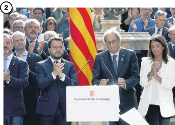
El 'compromiso de octubre' de Torra y su Govern

18.000 personas, según la Guardia Urbana, se manifestaron ayer en la plaza Catalunya de Barcelona para conmemorar el segundo aniversario del 1-O. El acto, convocado por la ANC, finalizó ante el instituto Jaume Balmes, que fue uno de los escenarios de las cargas policiales hace dos años en los centros de votación del referéndum ilegal.