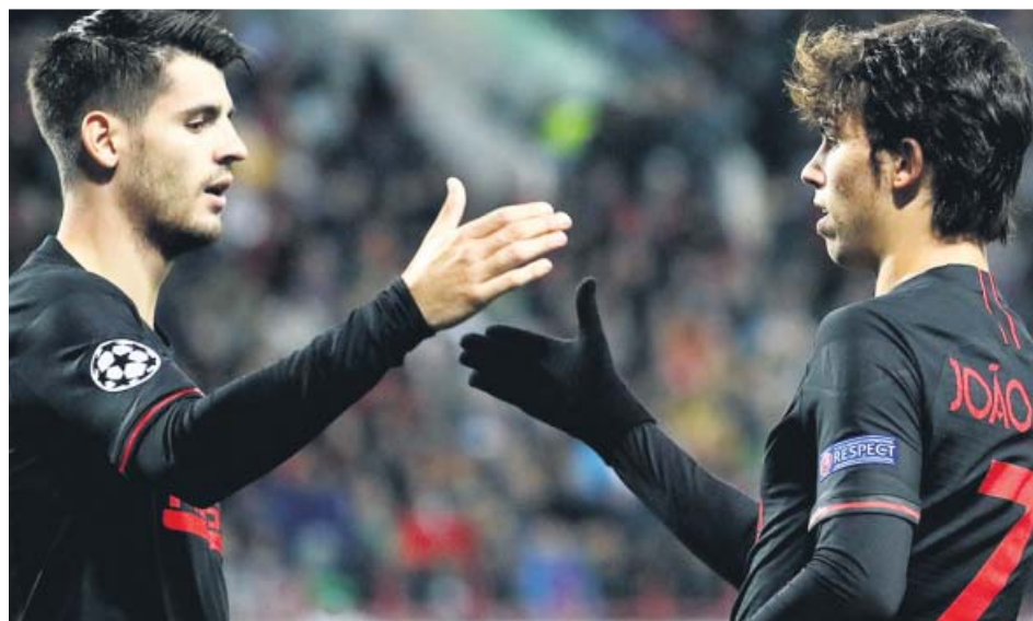
Sergio Ramos se lamenta ante el Brujas (arriba); saludo de Morata y Joao Félix (abajo).

la partida. Y poco después llegó el 1-2 en un cabezazo de Ramos en pleno asedio blanco.