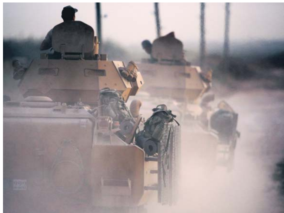
El Ejército de Turquía avanzando hacia el norte de Siria en vehículos blindados.

Un bebé de nueve meses falleció ayer por la tarde tras tener contacto con un cubo que contenía agua con lejía cuando estaba gateando en una vivienda de la localidad valenciana de Gandia. La Policía Nacional investiga lo ocurrido y si existe alguna responsabilidad en la muerte del bebé, que se encontraba con la madre en ese momento.