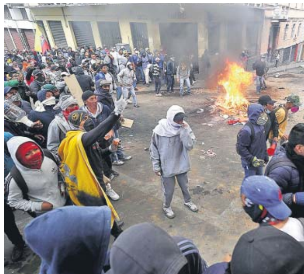
Manifestantes enfrentándose a la policía en Quito.

La crisis por la subida de combustibles alcanzó ayer otro punto álgido, con choques entre policía y manifestantes