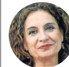
MARÍA JESÚS MONTERO Ministra de Hacienda en funciones

«Tan malo es no anticipar que realmente puede venir una crisis, como hacer un efecto llamada a la crisis»