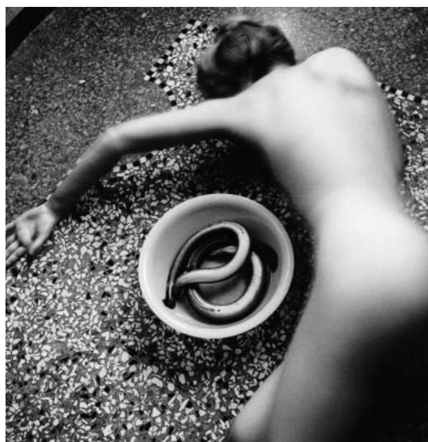
Algunas fotografías de la artista, que centró su trabajo en retratar la fisonomía de las mujeres en general y de ella misma en particular.