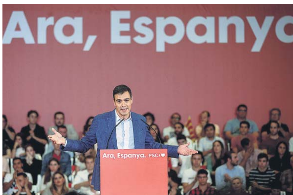
El presidente del Gobierno en funciones, Pedro Sánchez, ayer en Barcelona.

EVITA advertir del 155 o la Ley de Seguridad aunque Torra responderá a la sentencia con «autodeterminación» DESPRECIA PACTOS con el PP, Cs, Podemos o Más País y pide votar al PSOE como única forma de «desbloquear»