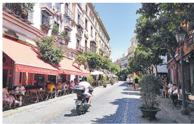
Veladores en las dos aceras de la calle Mateos Gago. B. R.

SE ABORDARÁ la homogeneización de los 60 negocios del barrio, como ya se ha hecho en la Avenida