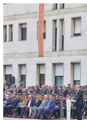
Celebración ayer de la patrona de la Guardia Civil.

La crisis entre los dos cuerpos se produjo justo antes de que se conozca la sentencia del procés y cuando las fuerzas de seguridad están transmitien-