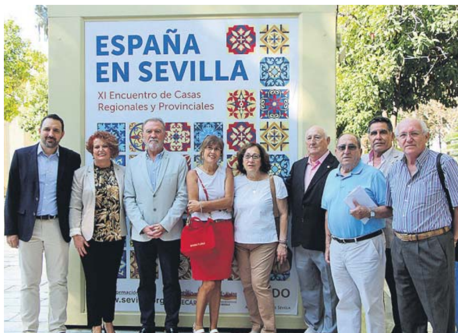
Presentación del encuentro que tendrá lugar este fin de semana.

El segundo ciclo de la Muestra de la Provincia 2019 comenzará este fin de semana en el patio de la Diputación con la Feria de Vinos y Licores. En total, este ciclo contará con nueve eventos, entre ellos, la Feria de Mujeres Empresarias.